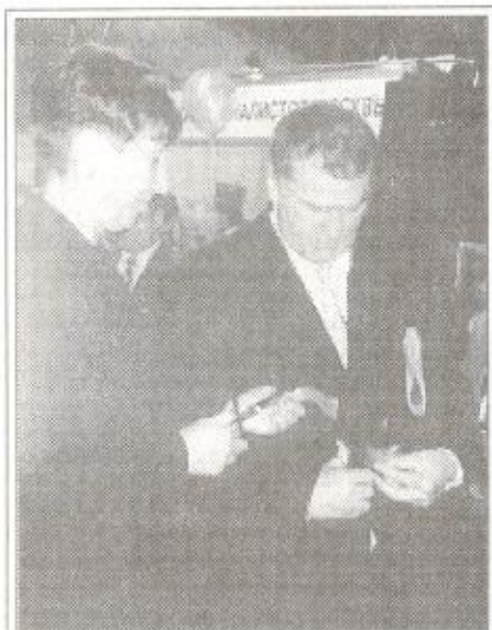
Владимир Вольфович разрезает ленточку на открытии выставки "Пресса-2001"