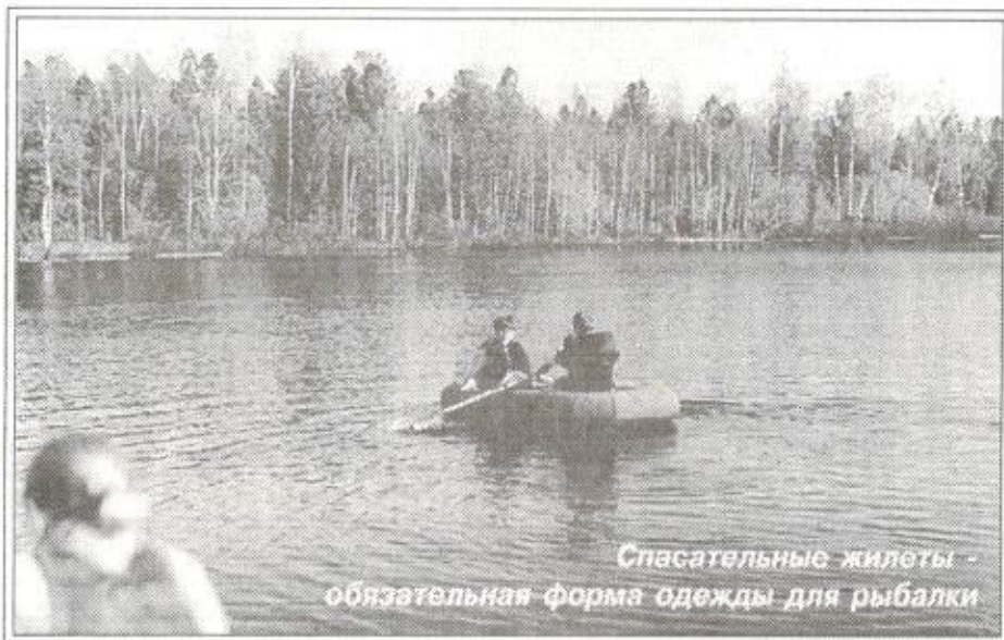
Спасательные жилеты - обязательная форма одежды для рыбалки

В рамках программы занятий по этнографии был организован поход в стойбище, приготовление юкы (рыбного блюда), изготовление "птицы сна", проведен обрядовый праздник с целью пропаганды береж-