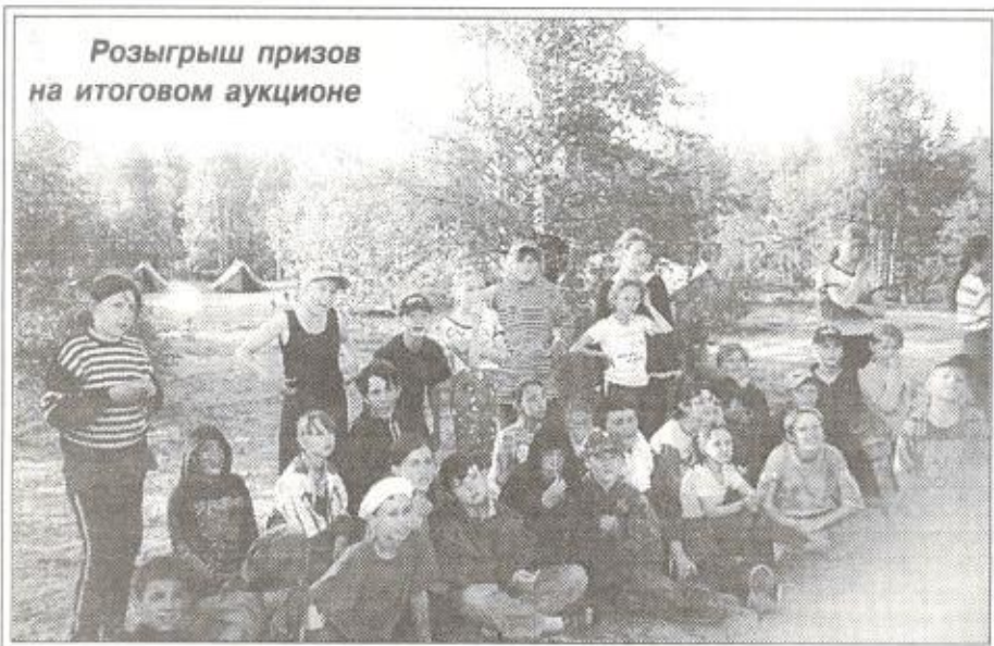
Розыгрыш призов на итоговом аукционе

озеро Лебяжье, представляющие собой хвосты термокарстового происхождения. Было показано отрицательное влияние нефтегазового комплекса на природу прилегающей тундры и животный мир.