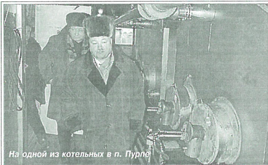
На одной из котельных в п. Пурпе