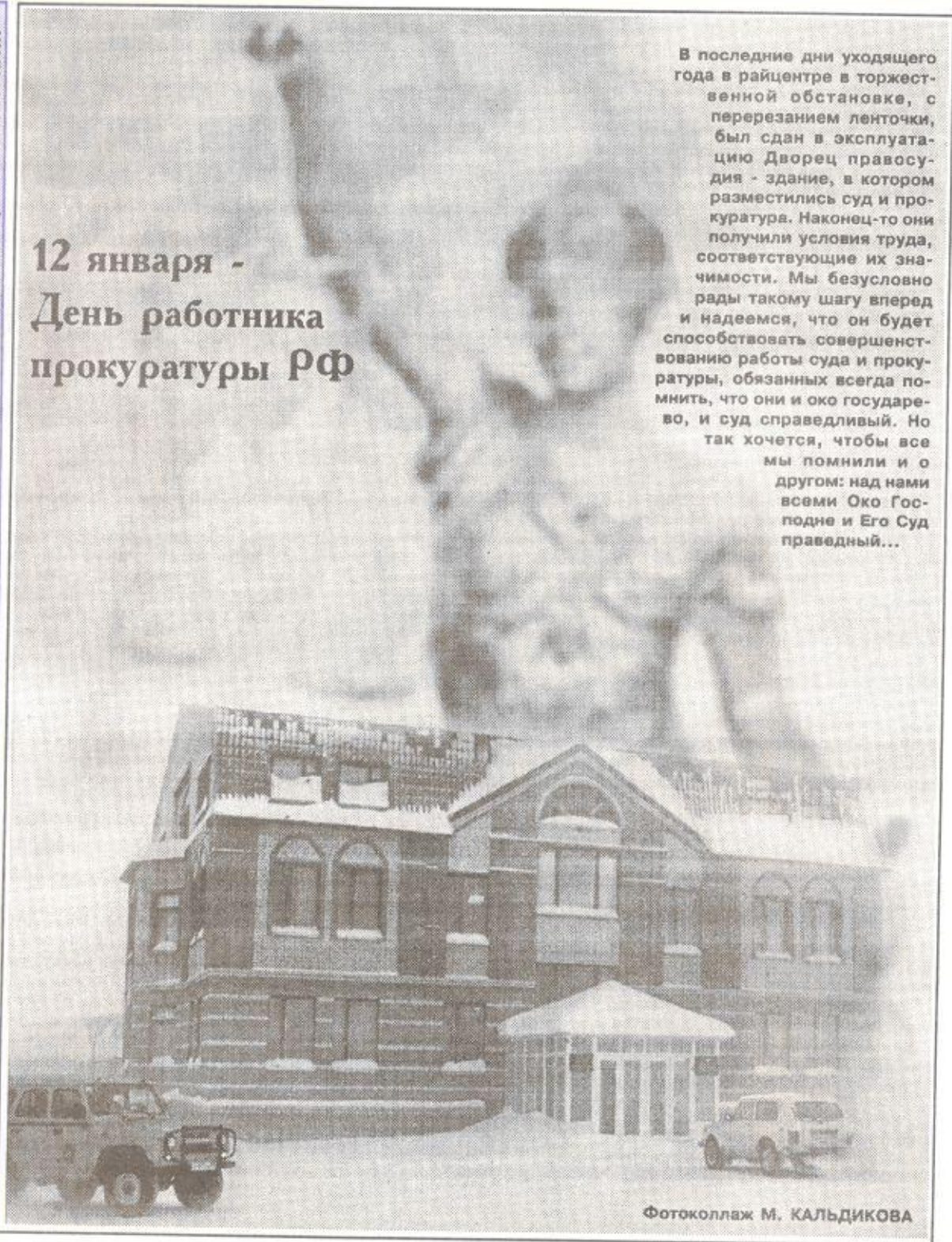
Фотоколлаж М. КАЛЬДИКОВА