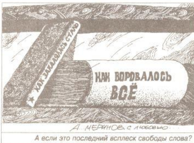
А если это последний всплеск свободы слова?