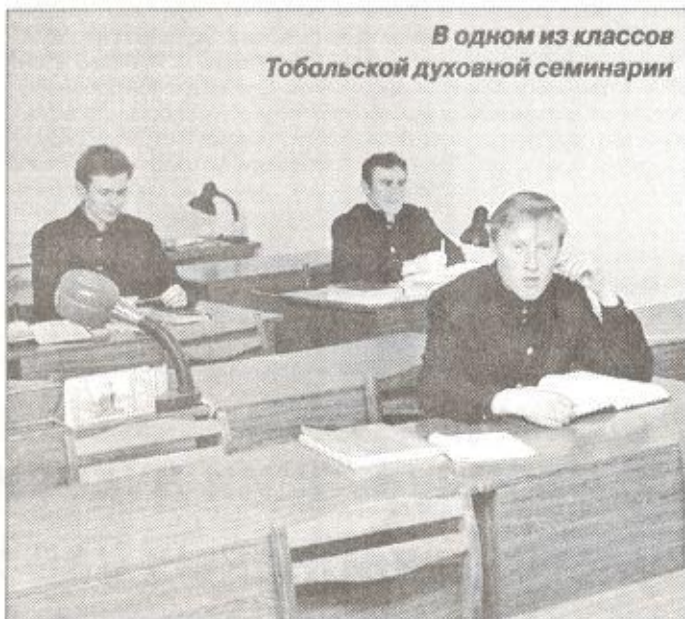
В одном из классов Тобольской духовной семинарии