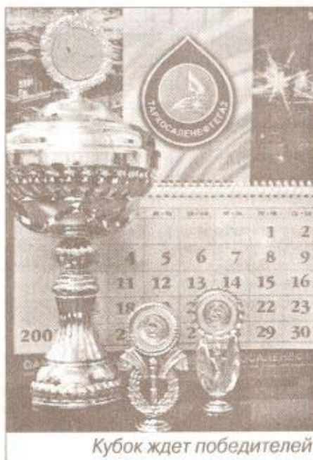
Кубок ждет победителей

Материалы подготовлены отделом информации и связей с общественностью ОАО НК «Таркосаленефтегаз»