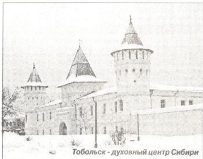
Тобольск - духовный центр Сибири