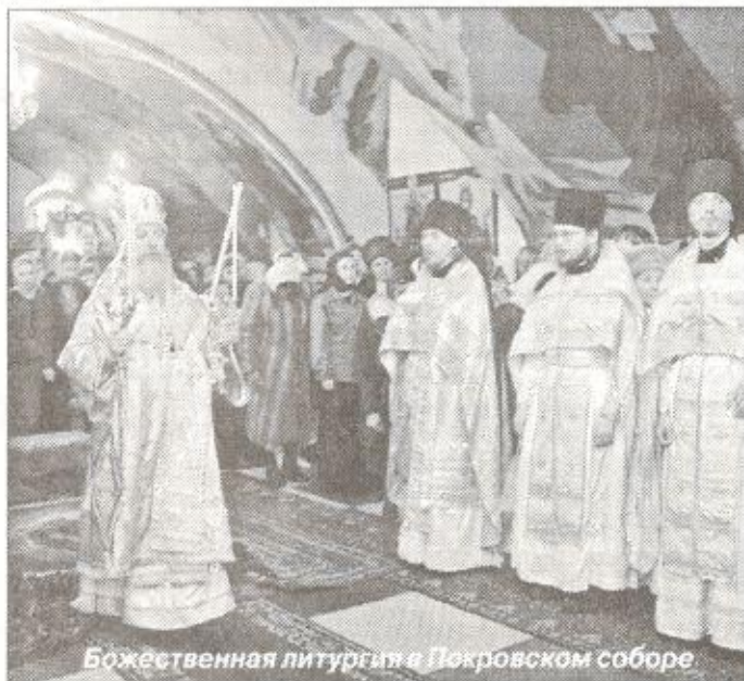
Божественная литургия в Покровском соборе