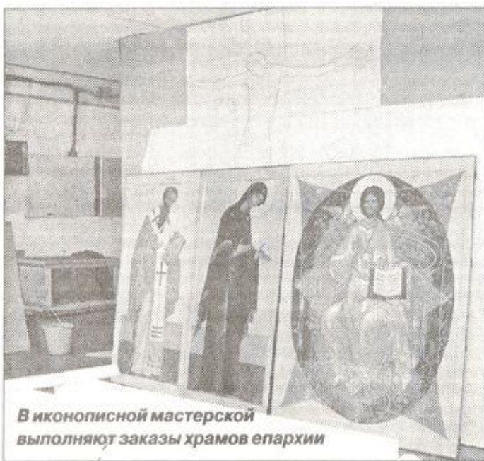
В иконописной мастерской выполняют заказы храмов епархии