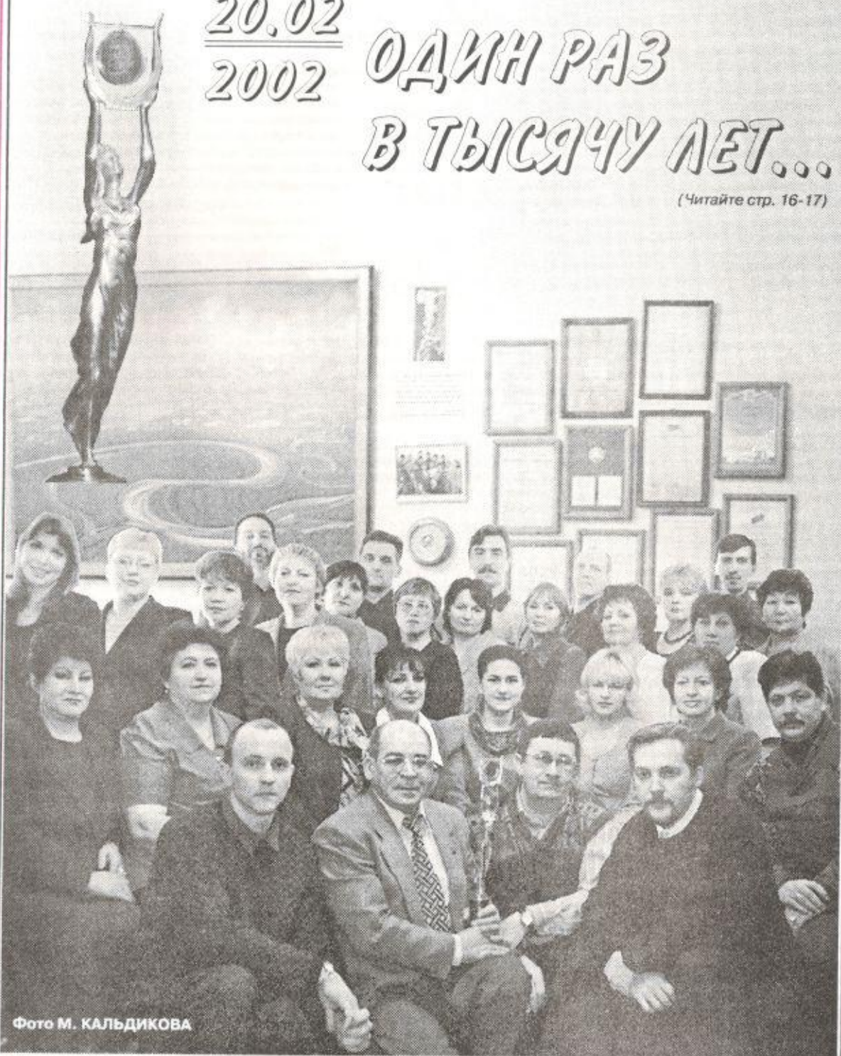
Фото М. КАЛЬДИКОВА