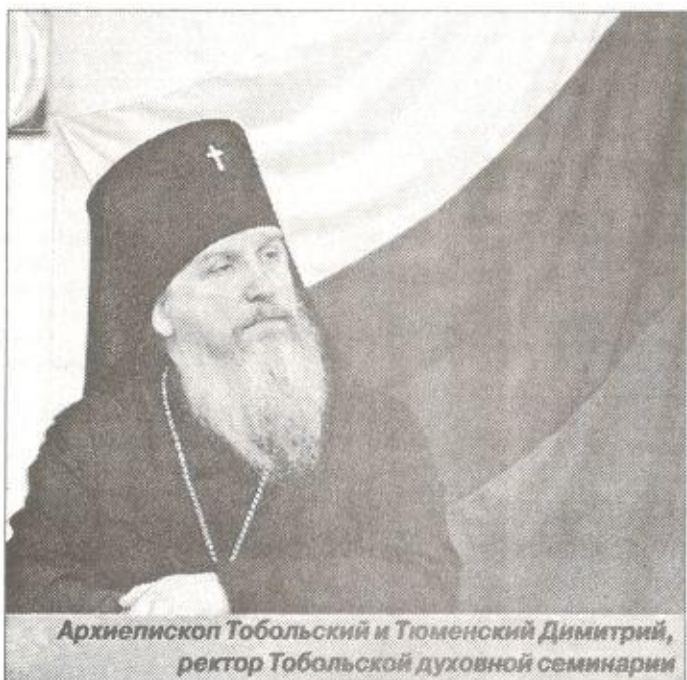
Архиепископ Тобольский и Тюменский Димитрий, ректор Тобольской духовной семинарии