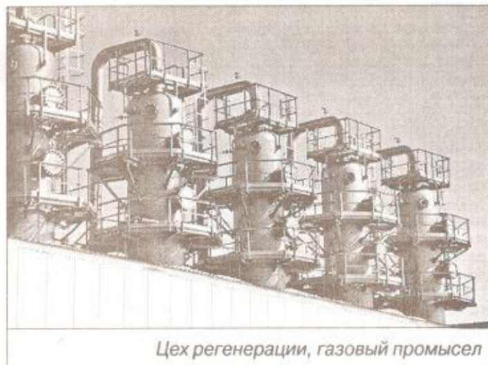
Цех регенерации, газовый промысел

По анализам химической лаборатории полученная жидкость соответствует по ГОСТу дизельному топливу.