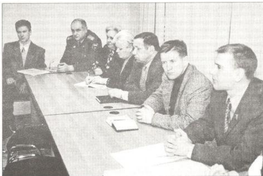
Опять в повестке дня «несовершеннолетние» проблемы