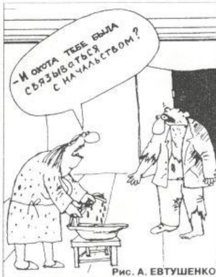
Рис. А. ЕВТУШЕНКО

Потому как в статье 140 «Сроки расчета при увольнении» нового Трудового Кодекса, который, кстати, начал действовать с 1 февраля нынешнего года, черным по белому записано: «При прекращении трудового договора выплата всех сумм, причитающихся работнику от работодателя, производится в день увольнения работника. Если работник в день увольнения не работал, то соответствующие суммы должны быть выплачены не позднее следующего дня после предъявления уволенным работником требования о расчете». К слову, в статье 393 «Освобо-