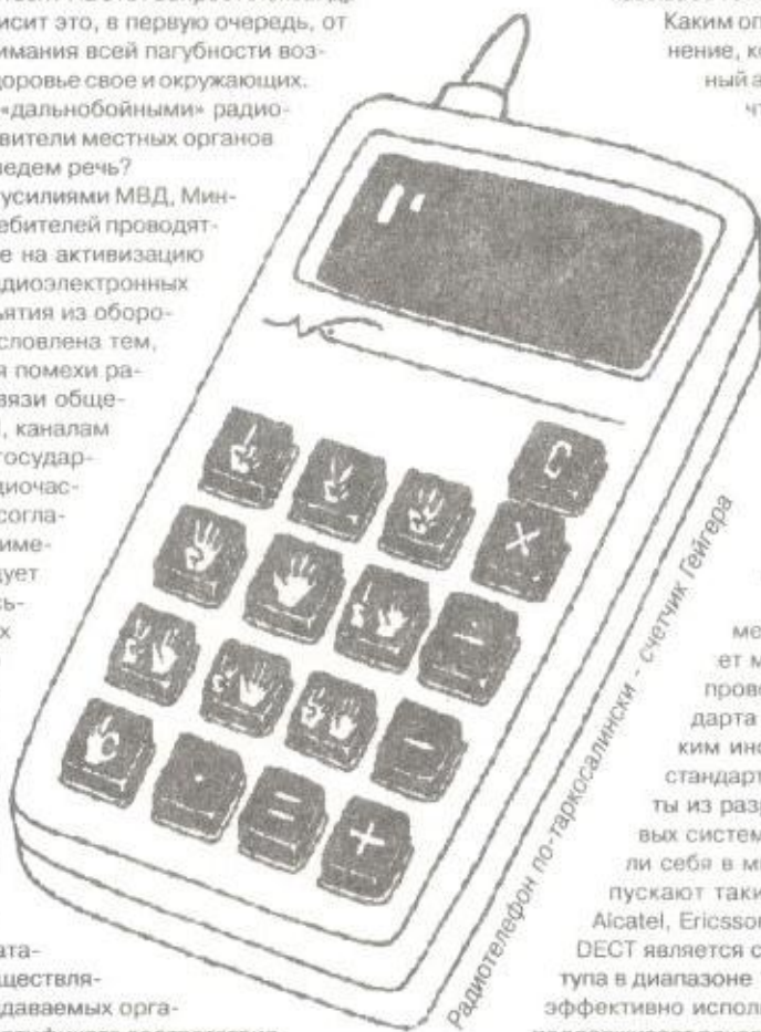
Радиотелефон по-таргасалински - счетчик Гейгера

Среди нашего населения пользуются популярностью радиотелефоны мощностью до 20 Вт с усилителями до 40 Вт. Не сложно подсчитать, что допустимую мощность они перекрывают в тысячи раз. Пользоваться таким аппаратом - что голову в микроволновке держать!