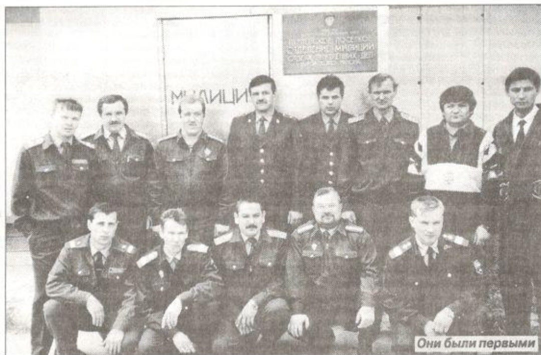
Они были первыми

Важно отметить, что за пять лет работы коллектив поселкового отделения обновился более чем на 90%. В настоящее время в ПОМе продолжают нести службу только пять сотрудников, которые пришли сюда работать еще в