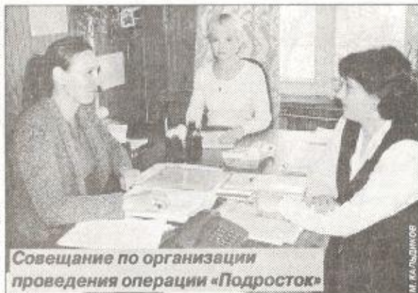
Совещание по организации проведения операции «Подросток»

С уважением к комиссии и редакции газеты бывшие подростки, побывавшие на учете комиссии