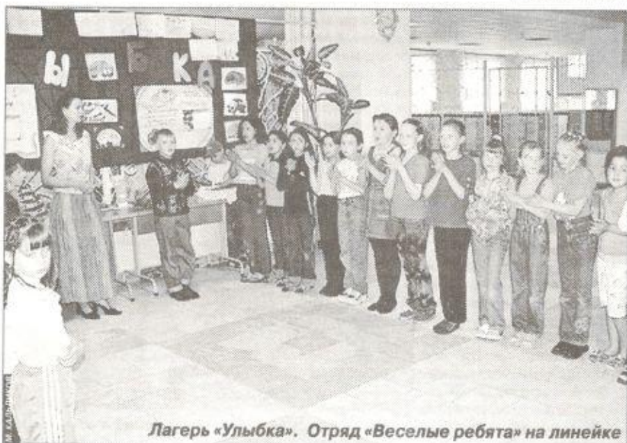
Лагерь «Улыбка». Отряд «Веселые ребята» на линейке