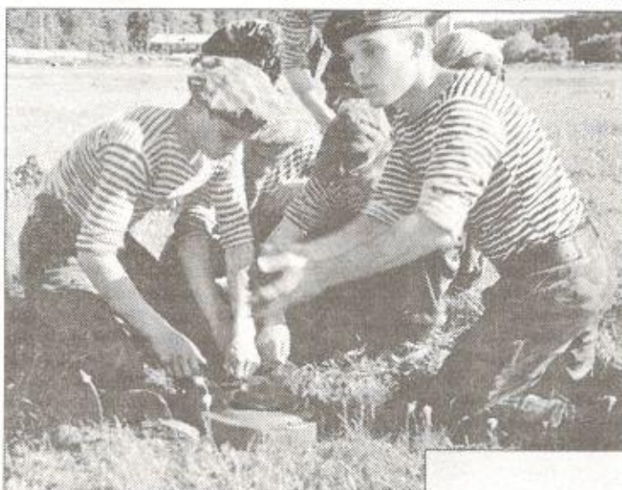
Занятия на минном поле. Одна группа минирует, другая ищет

Защита Отечества, согласно Конституции Российской Федерации, является долгом и обязанностью ее граждан. Она требует от военнослужащих огромного напряжения физических и духовных сил, постоянного совершенствования морально-боевых качеств. Именно для этих целей - воспитания будущих защитников Отечества - 1 октября 1999 года