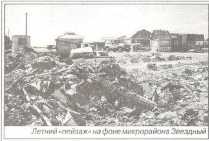
Летний «пейзаж» на фоне микрорайона Звездный