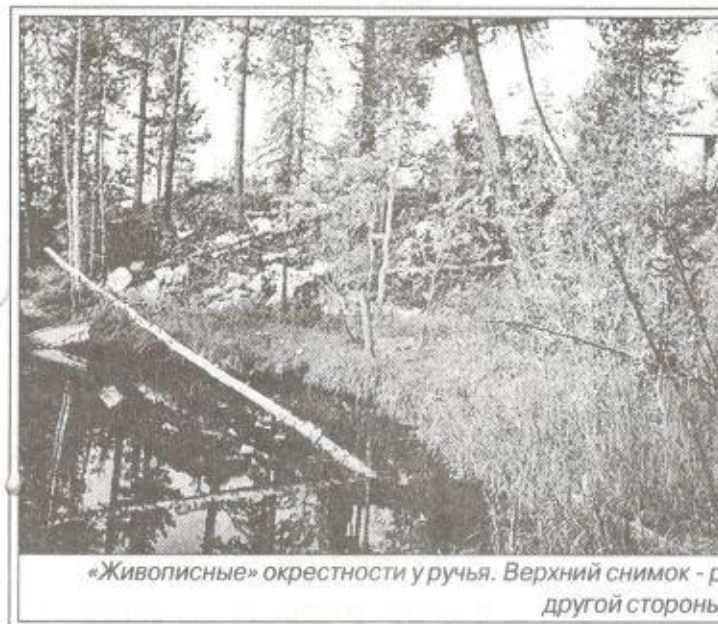
«Живописные» окрестности у ручья. Верхний снимок - ракурс с другой стороны оврага

Начнем со стороны многолетней свалки в районе мкр. Звездный. В прошлом году здесь была предпринята основательнейшая попытка победить свалку. И частично она удалась. Но как видно на снимке (внизу справа), свалка в мкр. Звездный обновляется и опять растет.