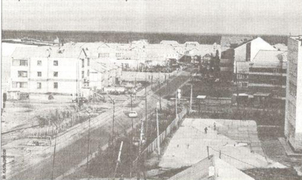
Современный облик поселка Тарко-Сале

В конце 1957 года Пуровскому району было передано село Толька из Ларьякского района Ханты-Мансийского округа (колхоз им. Ленина), расстояние до райцентра Тарко-Сале от него составляло 320 километров, водного пути сообщения с Пуровским районом не имелось.