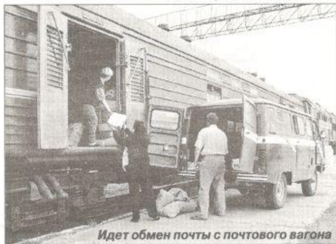
Идет обмен почты с почтового вагона