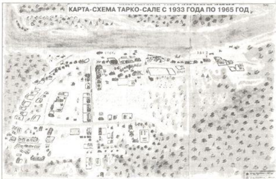
Интерес вызывают данные о размещении населенных пунктов в районе и транспортная схема.

Исходя из исторически сложившихся этапов развития населенных пунктов района, можно констатировать, что появление постоянных поселений было обусловлено тяготением местного коренного населения к водным магистралям и наличием благоприятных природно-экономических условий для развития комплексного хозяйства.