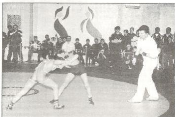
Один из самых популярных видов спорта в районе - греко-римская борьба

Теперь по поселкам. В Тарко-Сале создана детская спортивная школа олимпийского резерва. В ней занимаются 600 учащихся. Культивируются такие виды спорта, как дзюдо, бокс, вольная и гре-