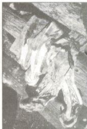
Зимняя обувь: женская - слева, мужская - справа

Многие создавали запасы мехов, передавали их по наследству, включали в состав калыма, использовали в качестве подар-