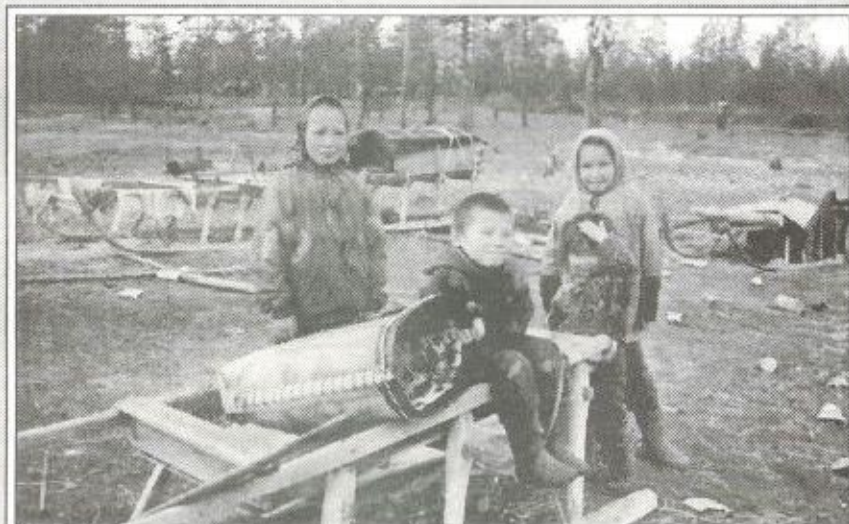
Юные знатоки загадок

* Загадки на лесном диалекте ненецкого языка, говор - харампурский, собраны в экспедиции (август 1999 г.).