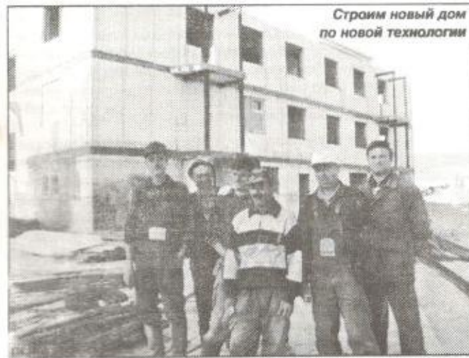
Строим новый дом по новой технологии