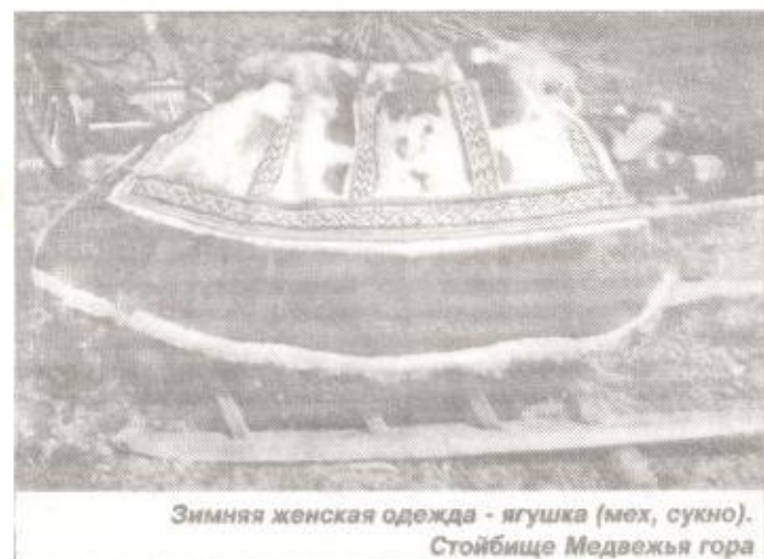
Зимняя женская одежда - ягушка (мех, сукно). Стойбище Медвежья гора

Женская зимняя одежда распашная, имеет разрез спереди. Она шьется из оленьих шкур мехом наружу с подкладом из оленьих же шкур внутри, украшается полосами орнамента из белого и темного меха из камуса оленя и сукном. Встречаются ягушки и из белчиных шкурок. Только у лесных ненцев (и южных ханты) встречается зимняя одежда - ягушка (паны) из сукна с меховой подстежкой, украшается орнаментом из сукна (у ханты - плетеными бисерными полосами). Для лета аналогичную одежду шьют из легкого брезента, но без мехового подклада. Женская обувь отличается по крою от мужской; спереди узкий мысок заканчивается низко расположенным поперечным узором. Дети почти до двух лет содержатся в люльке (чулу - лесной диалект). Затем дети начинают носить мужскую и женскую одежду уменьшенных размеров. Одежда детей украшается специальными детскими орнаментами, цветным сукном, бусами, значками, металлическими подвесками, бубенчиками и др. Все украшения в прошлом имели символическое значение, они служили оберегом и в то же время украшением.