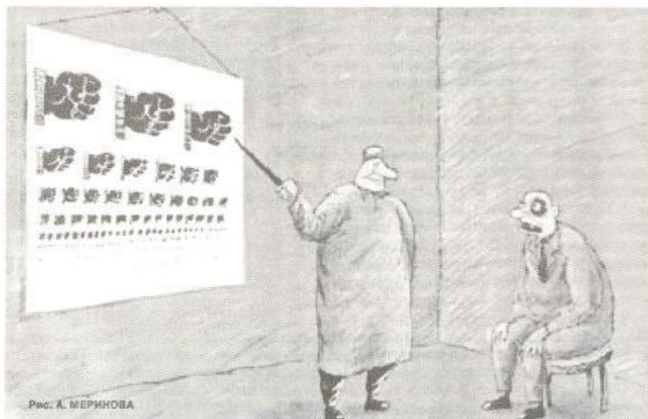
Рис. А. МЕРИНОВА