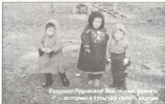
Будущее Пурувской Земли - им хранить историю и культуру своего народа

Вглядитесь повнимательнее в эти лица, в них - вся мудрость векового уклада тундрово-таежной жизни, который и держится на таких людях.