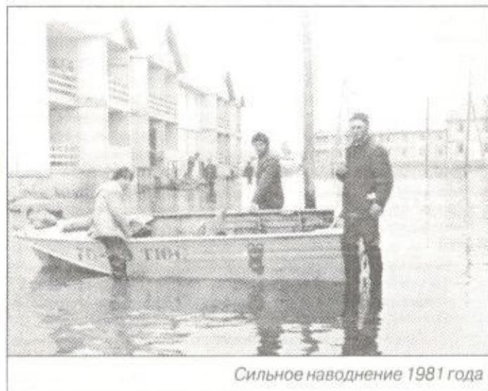
Сильное наводнение 1981 года

Дарья СЕЛЕЗНЕВА.