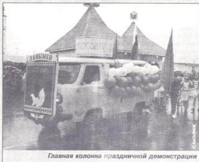
Главная колонна праздничной демонстрации

Двумя центральными событиями юбилея стали открытие памятника-мемориала ветеранам Ханымея и торжество по случаю ввода в эксплуатацию первого в округе открытого спортивного стадиона, выполненного по всем спортивным стандартам. В обоих случаях глава Пуровского района отметил: «Памятник ветеранам - это наше дорогое прошлое. А великолепный стадион - не менее дорогое, блистательное будущее».