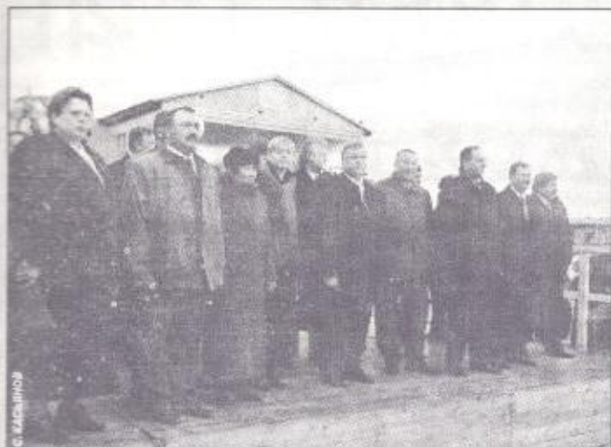
На трибуне - почетные гости Ханымея