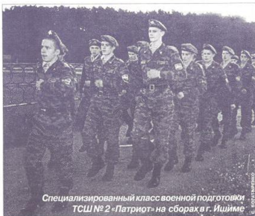
Специализированный класс военной подготовки ТСШ № 2 «Патриот» на сборах в г. Ишме

Готовясь к юбилеям, мы обычно стараемся достичь пика реализации всех аспектов патриотического воспитания. Но вот юбилей закончился, и начинается заметный спад и откат. Снижается внимание не только к живым ветеранам, но и к мемориалам и