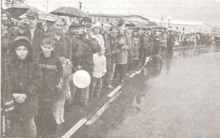
Празднику дождь не помеха

2002 год для пуровчан оказался богатым на юбилеи. Мы с радостью и душевным подъемом отмечаем их, нам есть что вспомнить, есть чем гордиться. Вслед за 70-летием Пуровского района 21 сентября отметил свой 25-летний юбилей поселок Ханымей, который был образован строителями железной дороги «Сургут - Кортчаево».