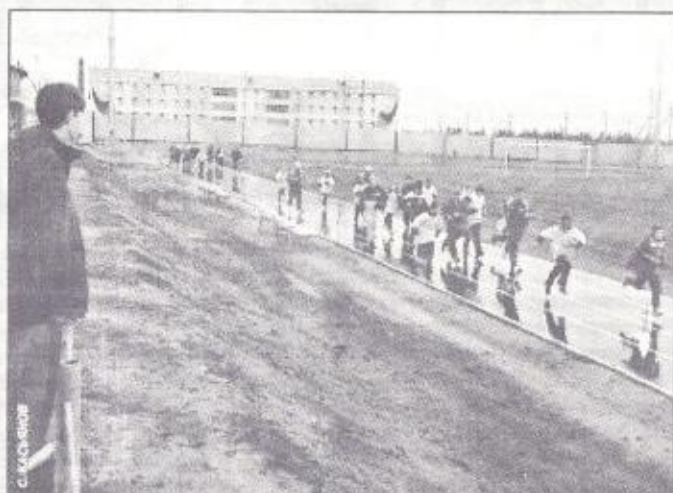
Первый забег на новом стадионе

вало прохождение ветеранов-первопроходцев. Поименно был назван каждый из них, отмечены его заслуги, трудовая биография. Не были забыты и те, кто не смог порадоваться этому празднику вместе со всеми.