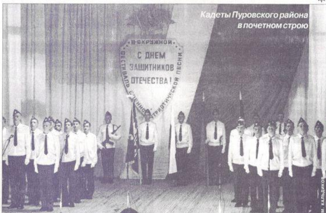
Кадеты Пуровского района в почетном строю