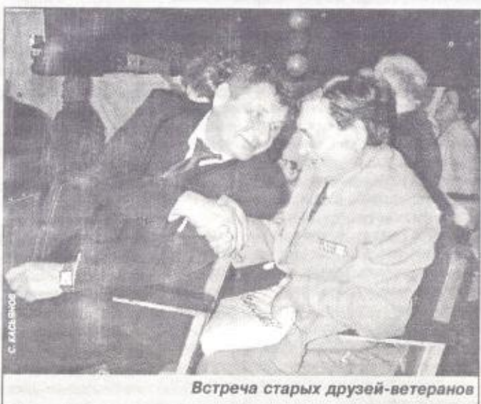
Встреча старых друзей-ветеранов