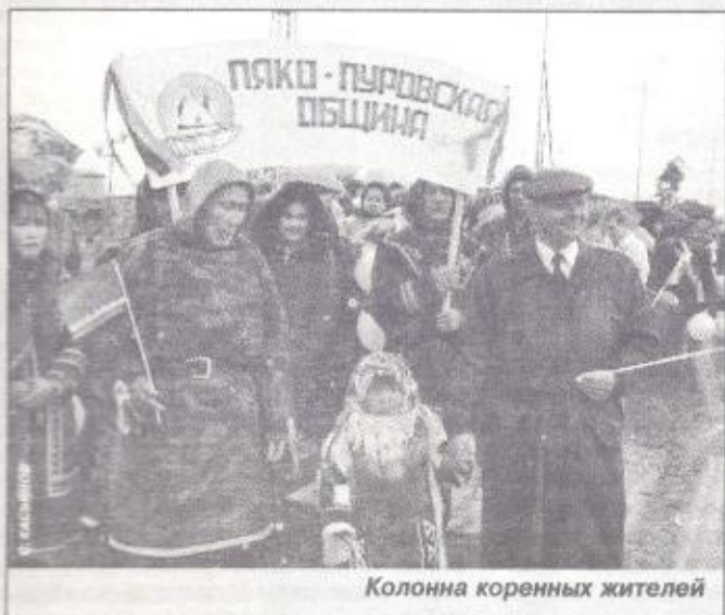
Колонна коренных жителей

Управление информационно-аналитических исследований и связей с общественностью администрации Пуровского района. Отдел политики редакции газеты «Северный луч»