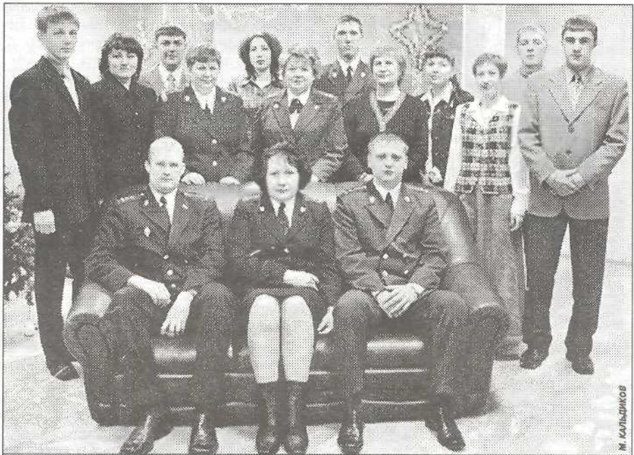
Коллектив Пуровской прокуратуры

- Я окончила Уральскую государственную юридическую академию. Три года проходила практику в прокуратуре Пуровского района, ну и вследствие этого поступила сюда на работу. С 26 августа прошлого года вступила в должность старшего помощника прокурора.