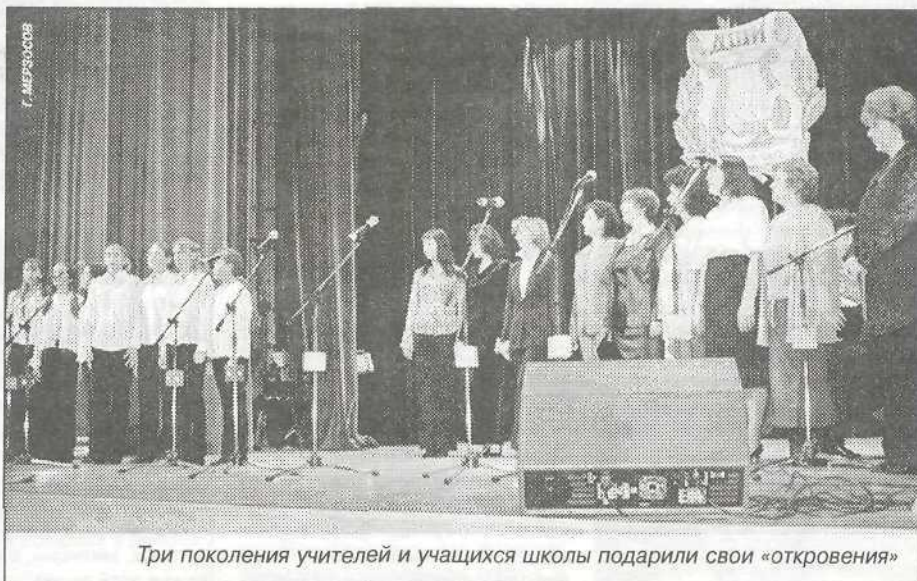
Три поколения учителей и учащихся школы подарили свои «откровения»