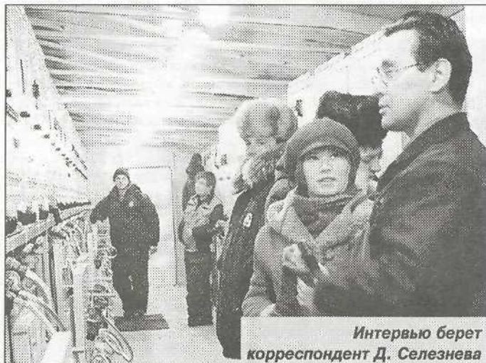
Интервью берет корреспондент Д. Селезнева