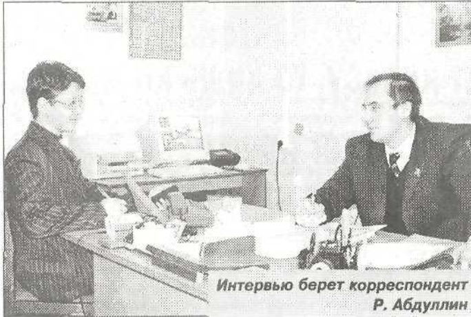
Интервью берет корреспондент Р. Абдуллин