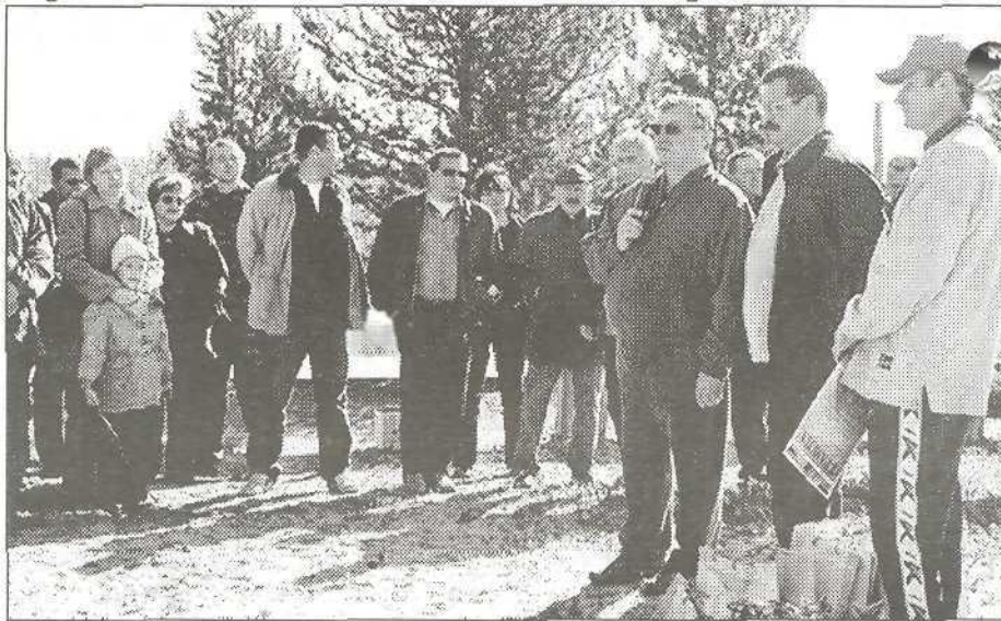
День нефтяника. Награждение команд

Людей объединять может многое - идея, бизнес. Насколько спорт помогает трудовому коллективу стать единым целостным организмом?