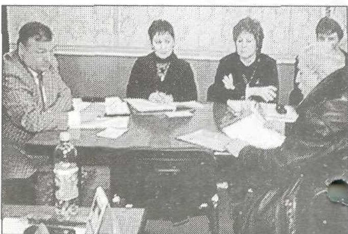
Прием по личным вопросам