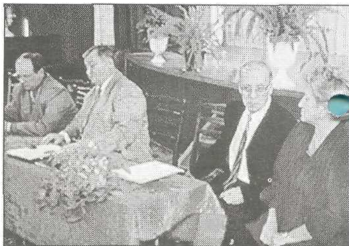
На встрече с педагогами