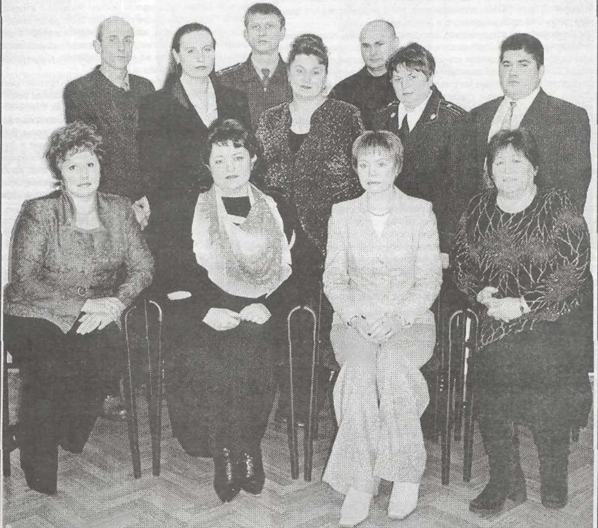
Члены комиссии по делам несовершеннолетних и защите их прав при администрации Пуровского района

85 лет назад, 14 января 1918 года, декретом Совета Народных Комиссаров, подписанным В. И. Лениным, впервые были созданы комиссии по делам несовершеннолетних. (Материал читайте на стр. 4).