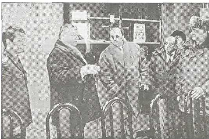
В новом здании Уренгойского ПОМа