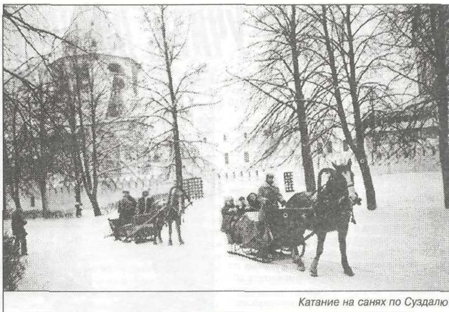
Катание на санях по Суздалью

Обедали мы в Суздале в трапезной действующего женского Покровского монастыря. Впечатления были совершенно необычные. За время поездки нас кормили в основном в ресторанах гостиниц, питание было обильное, и многие не всегда могли осилить свои порции, но в трапезной все справились со своими пор-