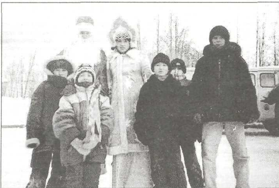
В Ярославле с Дедом Морозом и Снегурочкой

Утром 30 декабря мы тронулись в Суздаль. Насыщенный достопримечательностями Суздаль не имел себе равных. По дороге мы посетили резиденцию князя Андрея Боголюбского, придворный Рождественский собор, заложенный в 1158 году, церковь Покрова на Нерли, княжескую резиденцию Юрия Долгорукова, главный белокаменный храм Бориса и Глеба. Мы многое узнали о истории древней