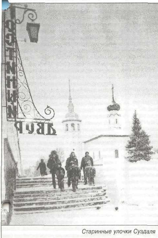
Старинные улочки Суздаля

Е. ШУГАЕВ, работник ОАО «Таркосаленефтегаз»