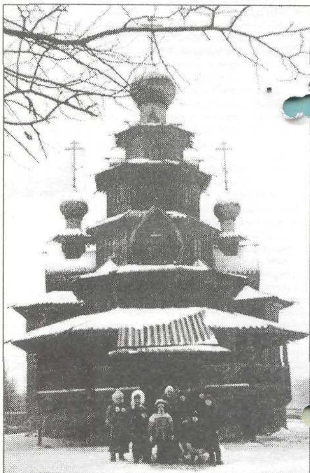
Музей деревянного зодчества, г. Суздаль

было все: и улочки старинного города, и крепостной вал, и древние, уцелевшие, со следами ударов от монголо-татарских баллист, сохранившиеся золотые ворота, и фрески в соборах, расписанные рукой самого Андрея Рублева, и музей стекла, хрусталя, лаковой миниатюры, и напоследок - великолепный кинотеатр «КиноМакс» со всевозможными развлечениями и демонстрацией очередной серии о Гарри Поттере. Многим запомнился Владимир, это были первые впечатления от созерцания старины.