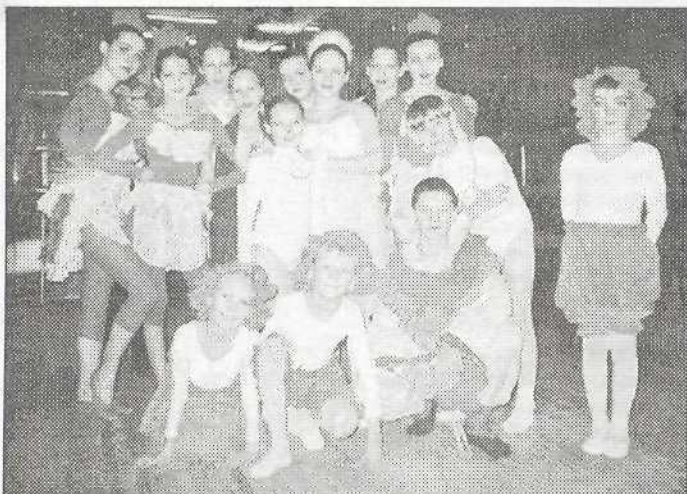
Хореографический коллектив «Виктория»