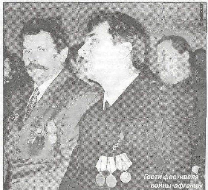
Гости фестиваля - воины-афганцы