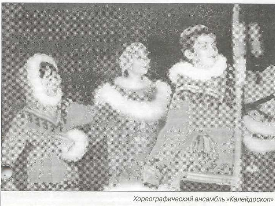
Хореографический ансамбль «Калейдоскоп»