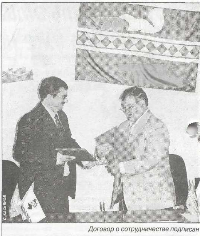
Договор о сотрудничестве подписан

Какой еще информацией радушно поделились хозяева? На совещании, в первый день совместной работы, была представлена общая картина развития Пуровского района, его возможности, перспективы. Рассказано о плодотворном сотрудничестве администрации района с научной организацией «АСКА» по разработке комплексной схемы градостроительного развития и планирования территории района. Глава