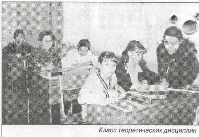
Класс теоретических дисциплин

Всеми двигало стремление приобщить детей к искусству, передать им свою любовь к нему, знания, которыми владеем, - продолжает Дмит-