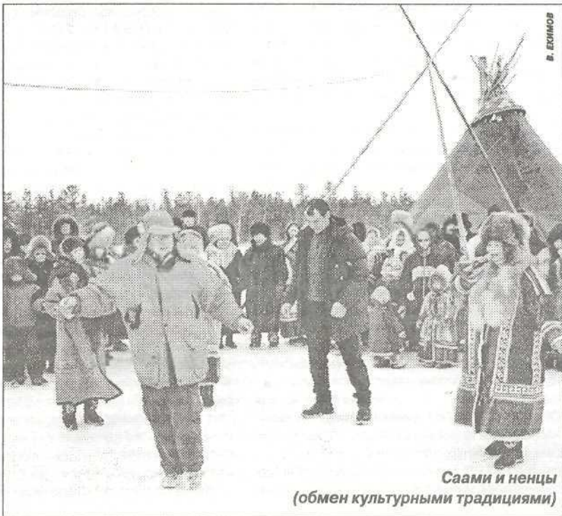
Саами и ненцы (обмен культурными традициями)

Ну что же, вот вам три различных мнения. Выбирайте, какое по вкусу. Но почему-то складывается такое впечатление, что если и воплотится идея международного оленеводческого туризма у нас на Ямале, то очень не скоро, хотя... чем черт не шутит, может быть через несколько лет и потянутся сюда путешественники в самолетах комфортабельного класса и СВ-вагонах, и станут наши оленеводы жить лучше.