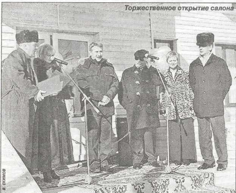
Торжественное открытие салона