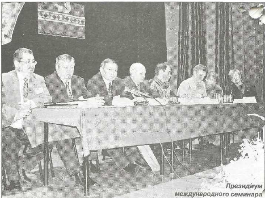
Президиум международного семинара

- Пуровская земля - удивительный край: девственно красивая природа, суровый северный климат, неисчерпаемые природные ресурсы, самобытность коренных жителей. Маленькие национальные поселки, насчитывающие сотни лет отроду, соседствуют на его территории с современными городами нефтегазодобытчиков. В районе 10 поселков с населением 48 тыс. человек, 4 тыс. человек из которых составляют малочисленные народы Севера. Третья часть коренного населения ведет кочевой образ жизни, и подавляющее большинство проживает в сельской местности. И это привносит в социально-экономическое развитие земли Пуровской уникальное своеобразие, когда чум вынужден уживаться рядом с многоэтажками, а рыбаки и оленеводы - находить общий язык с газовиками и нефтяниками. О том, как сохраняются последние традиции традиционные виды хозяйствования коренного населения,