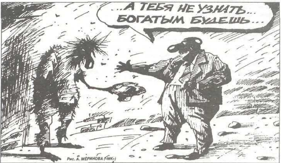
Рис. А. МЕРИНОВА (МК)

В управлении социальной политики мне сообщили следующее. В течение года как кощей маме вам будут выплачивать ежеквартально по 1500 рублей, затем как матери-одиночке - по 900 руб., также ежеквартально до трехлетнего возраста ребенка, - в отделе уровня жизни. Единовременное пособие в размере 6750