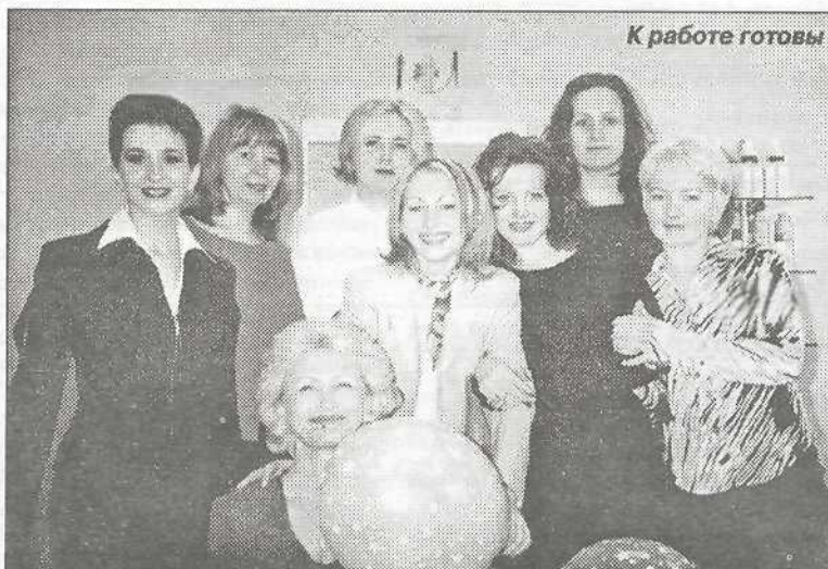
К работе готовы