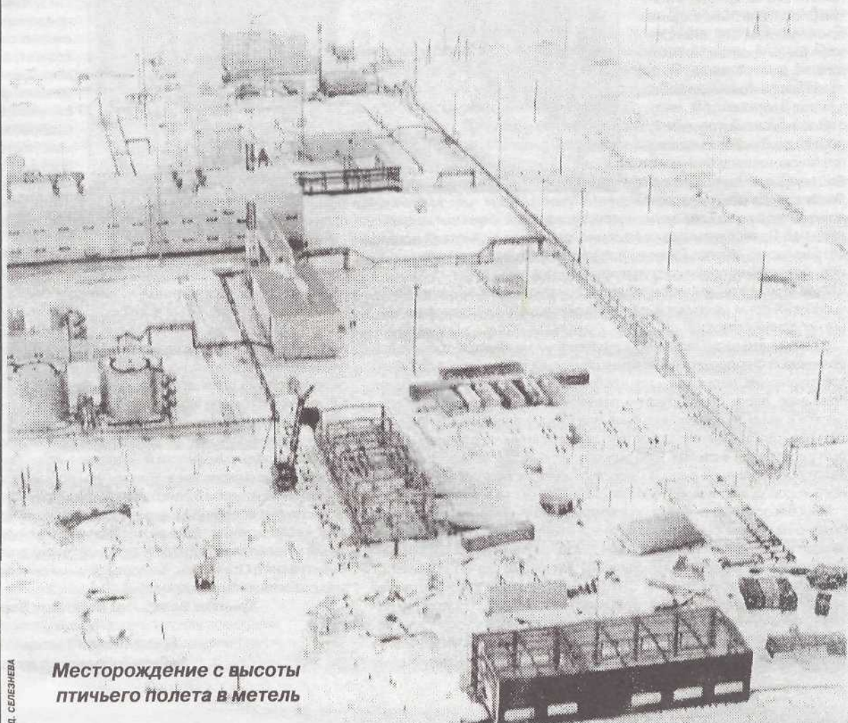
Месторождение с высоты птичьего полета в метель

(Подробности читайте в следующем номере «СЛ»)