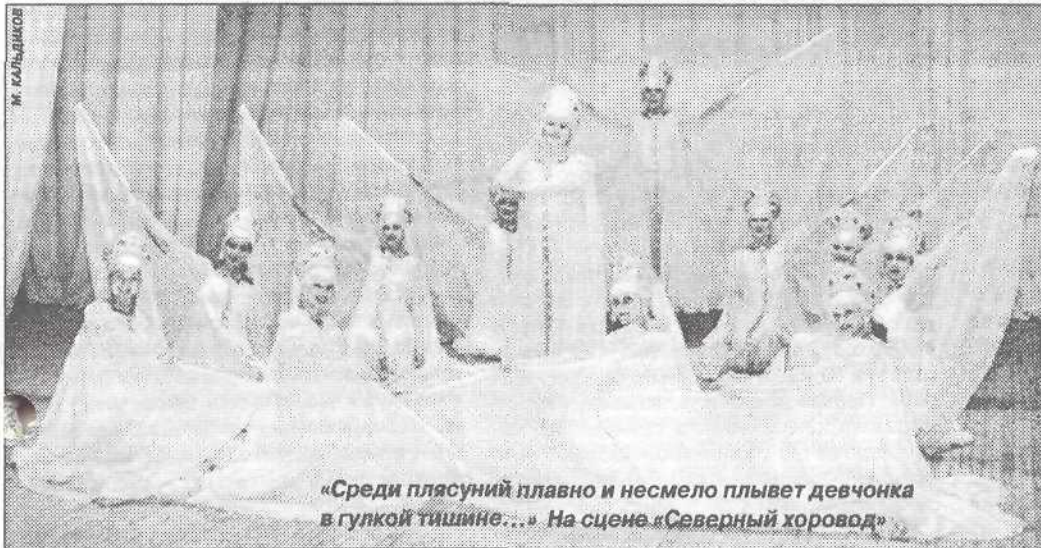
«Среди плясуньи плавно и несмело плывет девчонка в гулкой тишине...» На сцене «Северный хоровод»