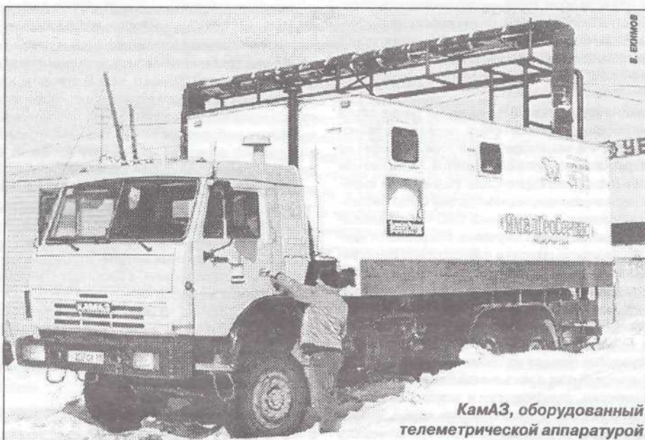
КамАЗ, оборудованный телеметрической аппаратурой

уже начато бурение двух горизонтальных скважин, в будущем планируется пробурить еще четыре. На Юрхарове ведется строительство двух ГС. Вообще, если говорить об Юрхаровском месторождении, то его можно смело назвать экспериментальной площадкой для развития технологии глубокого горизонтального бурения. Месторождение располагает нефтяными, газовыми и конденсатными залежами. Чтобы использовать их рационально, на одном из участков месторождения решено начать бурение скважины со сме-