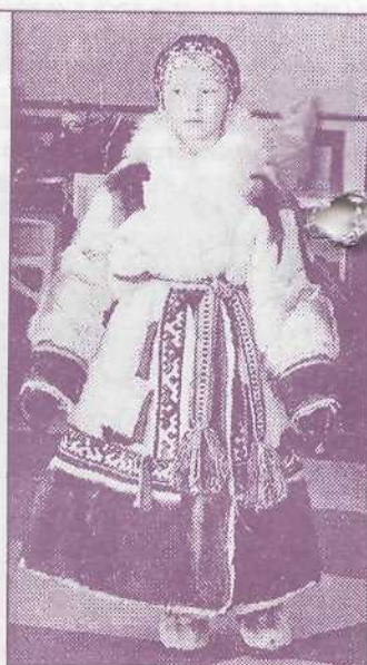
Подрастают современные хомаку и хомани