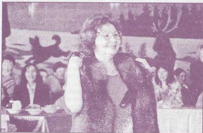
Две чернобурки - подарок совхоза «Верхне-Пуровский»