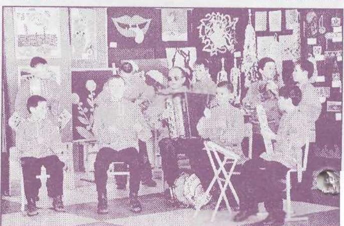
Оркестр учащихся Таркосалинской школы-интерната