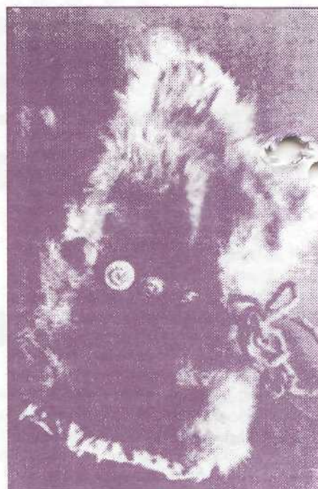
Изображение духа охоты (верхний снимок) одного из ненецких родов. На ремне, опоясывающем предмет культа, отчетливо видны пуговицы форменной одежды немецких воинов-подводников. На нижнем снимке видны более отчетливо изображения на пуговицах. Этот дух охоты в недавнем времени был экспонатом Пуровского районного музея, сейчас он утерян. Тем не менее подобные предметы еще и по сей день встречаются в чумах тундровиков-кочевников. Эти снимки взяты из публикаций «Красного Севера» 80-х годов

И. ХЭНО К публикации подготовила И. АМАНЕНКО