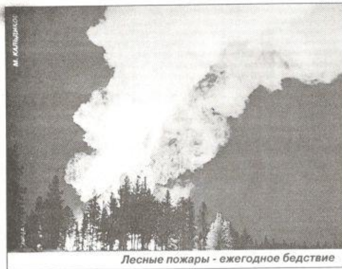
Лесные пожары - ежегодное бедствие

На Дальнем Востоке почему все горит? Да просто не хватает средств на авиацию, подъездных путей нет, а в зоне тайги и верховой пожар распространяется чуть ли не со скоростью автомобиля. Так что, главное - вовремя обнаружить пожар и высадить группу для его ликвидации.