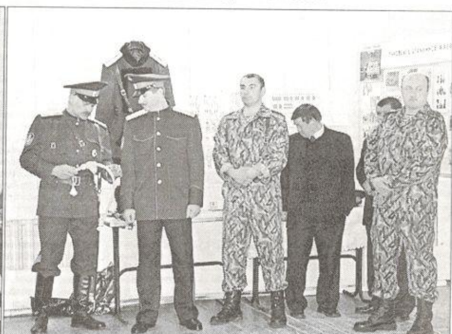
Пуровское станичное казачье общество: возрождение, становление, развитие