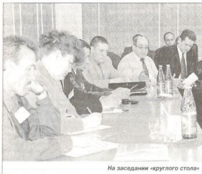
На заседании «круглого стола»