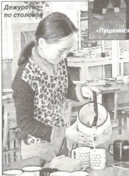
Дежурство по столовой

О. АЛФЕРОВА, п. Самбург