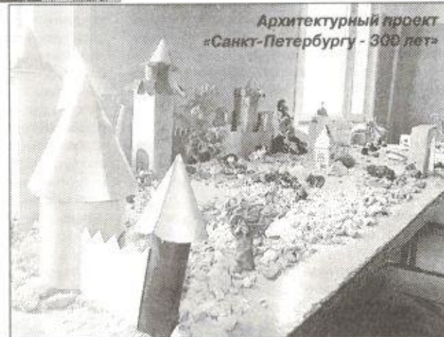
Архитектурный проект «Санкт-Петербургу - 300 лет»