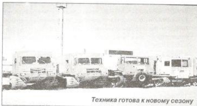
Техника готова к новому сезону

сезоном 2001 - 2002 года увеличили объем на 17 %, хотя сложность работ сильно увеличилась. Например, в этом сезоне по заказу компании «Сибнефть-Ноябрьскнефтегаз» мы работали на Вынгайинском месторождении. Для того, чтобы отработать 20500 физических наблюдений по усложненной методике в условиях мощной промышленной