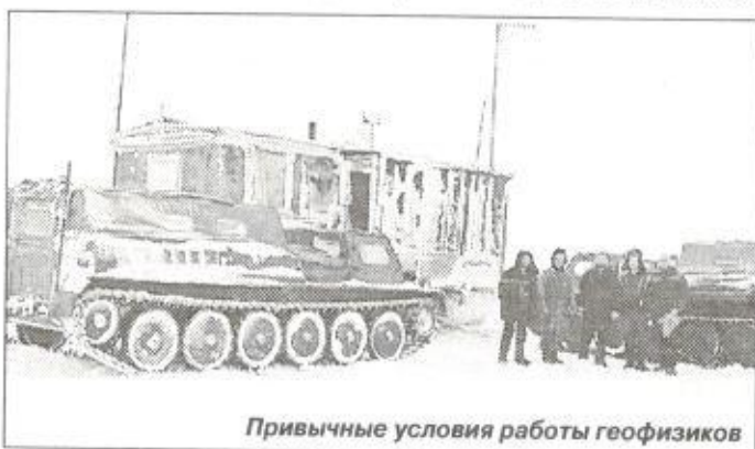
Привычные условия работы геофизиков