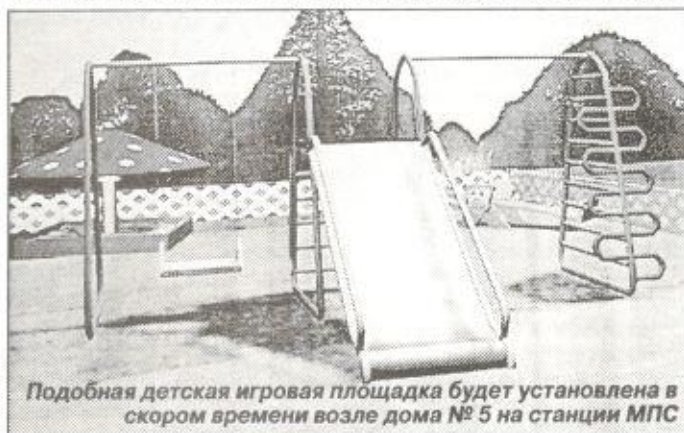
Подобная детская игровая площадка будет установлена в скором времени возле дома № 5 на станции МПС

- Нескончаемая эпопея борьбы с мусорными свалками в Пурпе... На что будут направлены основные усилия этим летом?