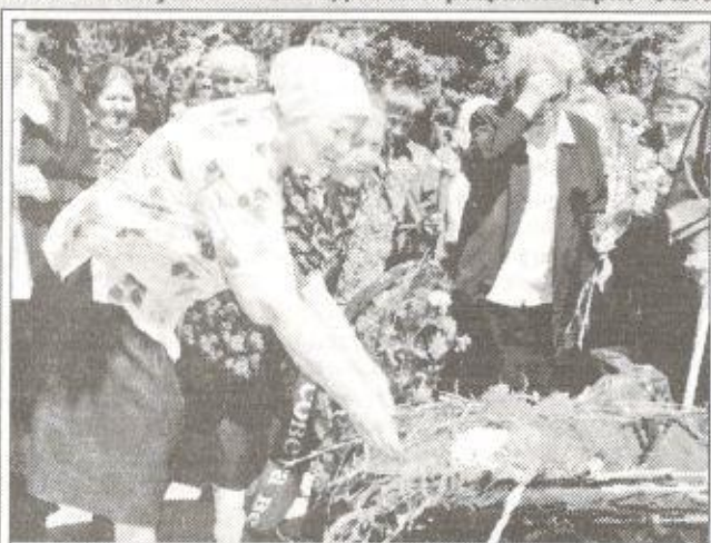
Возложение цветов к Вечному огню

района Е. К. Колесникова. Самым трогательным был момент возложения цветов к Вечному огню. Ветераны, укладывая букеты красных гвоздик, крестясь и застывая в поклоне, оставляли букеты красных гвоздик.