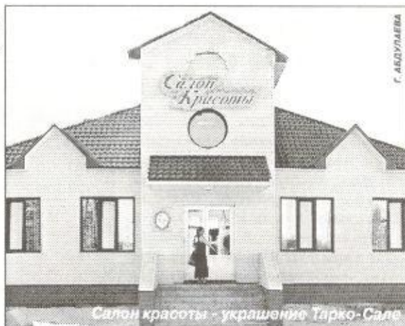
Салон красоты - украшение Тарко-Сале

Однако, где бы мы ни были и как бы ни восхищались архитектурными шедеврами, нам все же милее красоты родного поселка. Тарко-Сале хоть и не стал городом, но преобразился в последнее время ускоренными темпами. Появились дома в капитальном исполнении, похорошевшая после капитального ремонта первая школа радуется яркостью красок. Красивейший «Дом милосердия», расположившийся на берегу реки Пур, распахнул свои двери для ветеранов. Сеть современных магазинов органично вписывается в структуру поселка. Методом блочного строительства в рекордно короткий срок возведено здание «Салона красоты», внутренний и внешний дизайн которого полностью соответствует его названию. Смелым инженерным решением следует признать сооружение фонтанов в условиях Крайнего Севера. И