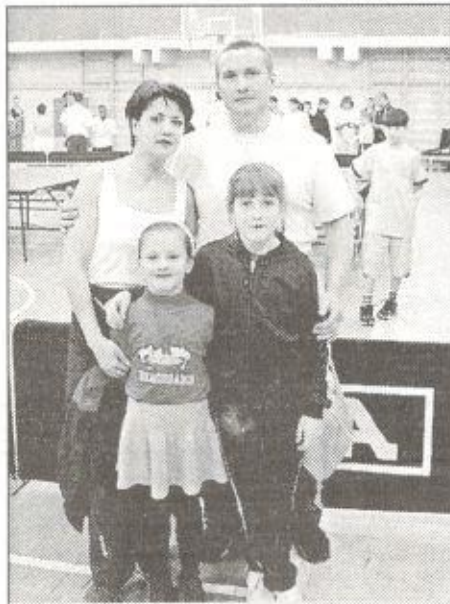
2003 год. Вторая игра - второе место