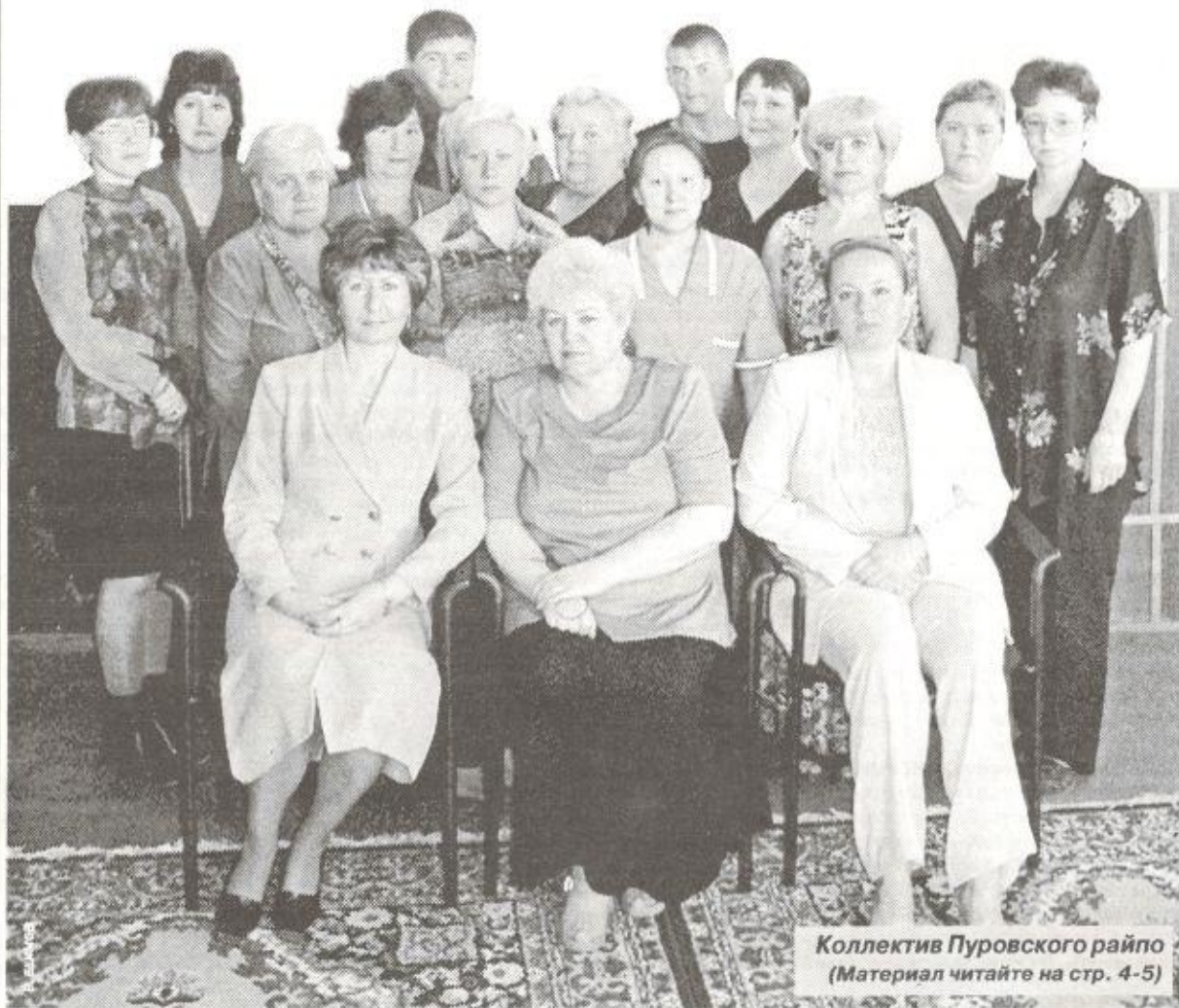
Коллектив Пуровского райпо (Материал читайте на стр. 4-5)

Совет и правление Пуровского районного потребительского общества