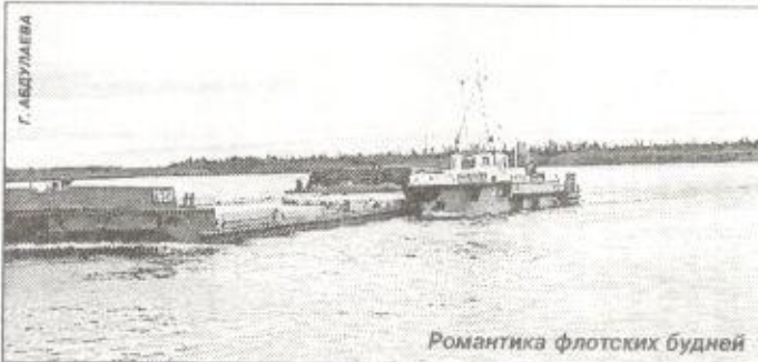
Романтика флотских будней