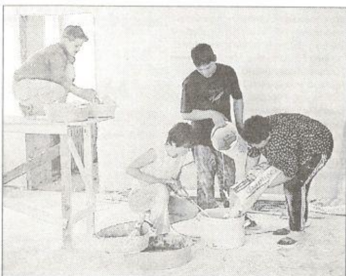
На отделочных работах в детском саду «Звездочка» работают специалисты ООО «Поиск»

выделено по 50 тысяч рублей, причем, из них нужно заплатить еще 20 процентов НДС. На оставшиеся 40 тысяч можно покрасить только несколько групп. Чтобы привести детский сад в порядок, как минимум, требуется 200-400 тысяч рублей. По 50 тысяч рублей выделено средним школам № 1 и № 2, но второй школе, как и прежде, окажет помощь ЛПУ МГ КС-02. Уже есть договоренность с руководством компрессорной станции о выполнении в счет спонсорской помощи контура заземления здания школы. Немного больше денег выделено на работы в ПСШ № 3 и детском саду «Белоснежка» - по 175 и 150 тысяч рублей соответственно. Но здесь необходимо выполнить требования по пожарной безопасности. А вообще, четырех с половиной миллионов на самом деле на ремонты этих учреждений мало. Деньг нужно во много раз больше, в том числе и потому, что во многих зданиях за эти годы построено такое, что нужен не один год, чтобы привести все к существующим нормам. В данный момент мы можем настаивать лишь на том, чтобы комитет образования запросил в новосибирском институте «Сибгипротранс» старые проекты зданий и восстановил все в соответствии с ними либо сделал заказ на перепроектировку.