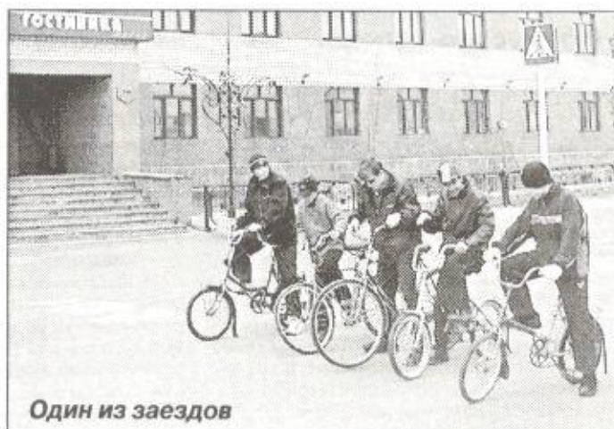
Один из заездов

В рамках операции и для организации досуга находящихся на каникулах подростков, 7 июня в райцентре инспекторы ОпДН и ГИБДД РОВД совместно с администрацией поселка организовали соревнования по велосипедным гонкам. В спортивном мероприятии приняли участие более 40 подростков. Соревнования проводились сре-