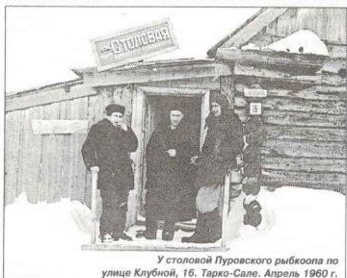
У столовой Пуровского рыбокооп по улице Клубной, 16. Тарко-Сале. Апрель 1960 г.