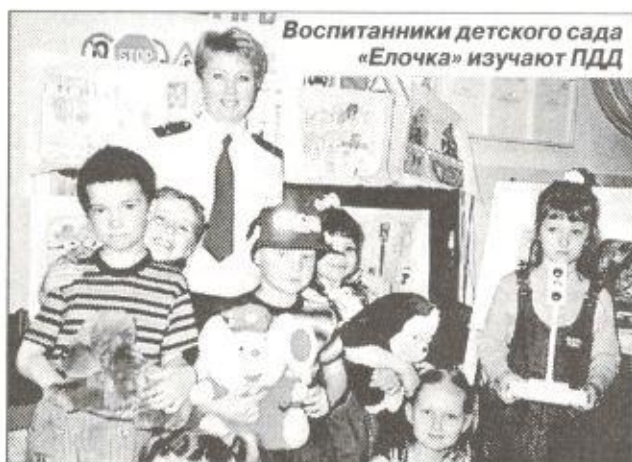
Воспитанники детского сада «Елочка» изучают ПДД

С. КОРНЕВ, инспектор ОпДН РОВД, лейтенант милиции