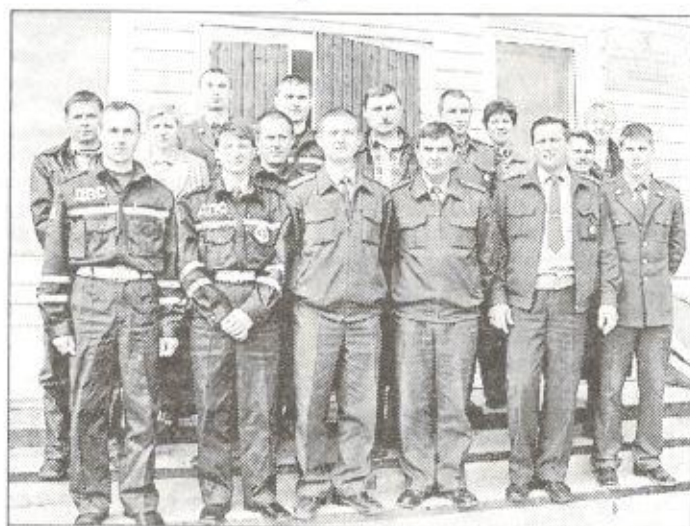
Коллектив ГИБДД Пуровского района

В начале реформирования деятельности ГИБДД изменилась направленность надзорной деятельности, а именно: на местах было организовано регулярное изучение общественного мнения, результаты которого, а также уровень аварийности на обслуживаемой территории,