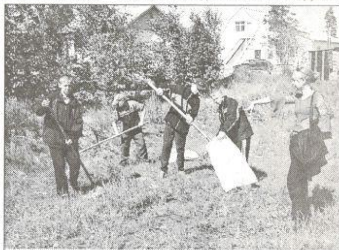
Ежегодно на уборку поселка выходят школьники

Три миллиона двести тысяч рублей - такая сумма определена бюджетом этого года на различные виды работ по уличному освещению поселка Пурпе. На эти средства планируется заменить 71 светильник, из них 25 - в поселке КС-02, деревянные опоры линий электропередачи поменять на железобетонные, произвести реконструкцию либо заменить линии электропередач общей протяженностью 2,5 километра. Основные объемы работ будут выполняться в поселке компрессорной станции, в районе жилого сектора железнодорожной станции, средней школы № 3 и детского сада «Звездочка», в микрорайоне «Солнечный», а также по Школьной и Аэродромной улицам. Устанавливать же дополнительное наружное