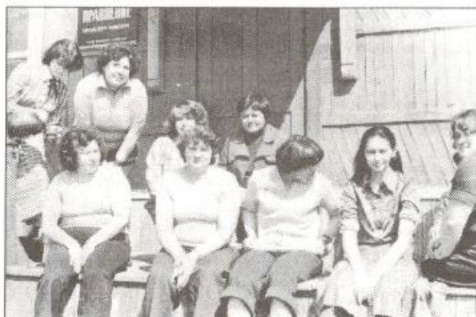
Коллектив Пуровского райпо. «Как молоды мы были...» Снимок начала 80-х годов

и самое многочисленное социально-экономическое движение, поскольку во главу угла кооперативы ставят интересы людей.