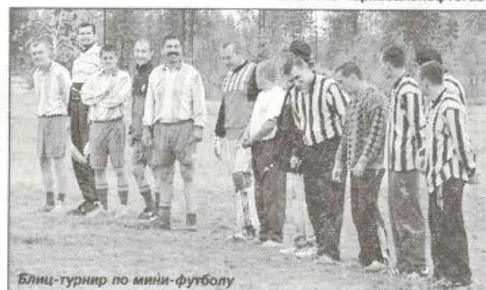
Блиц-турнир по мини-футболу