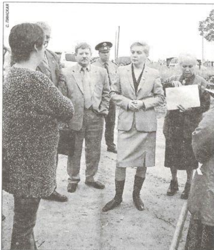
На встрече с жителями Мостоотряда