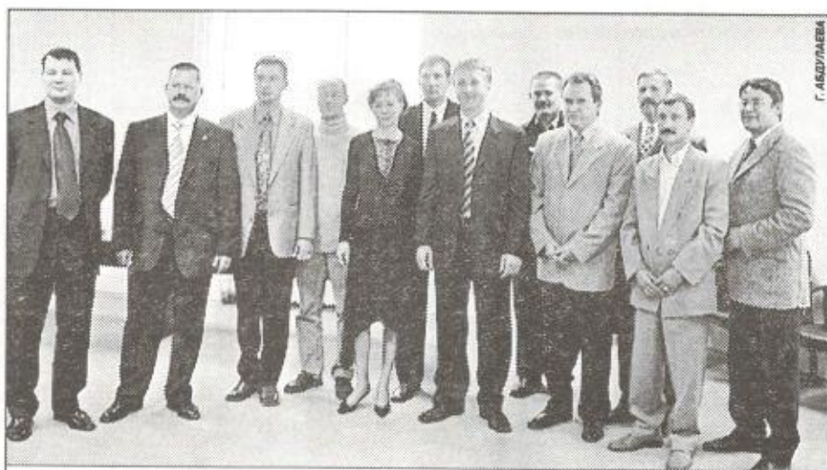
В офисе компании «НОВАТЭК». Церемония награждения состоялась