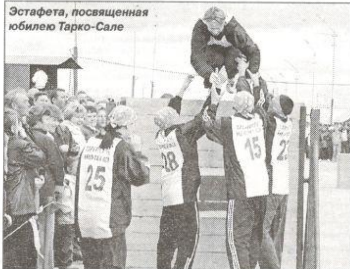
Эстафета, посвященная юбилею Тарко-Сале