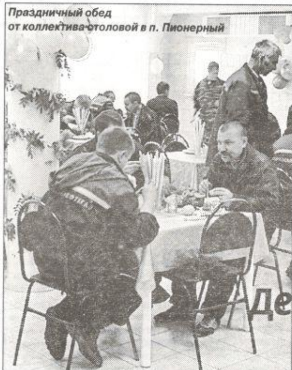
Праздничный обед от коллектива столовой в п. Пионерный