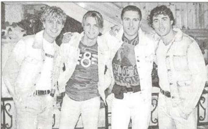
Праздник фотографировали: В. ЕКИМОВ, А. ТЕСЛЯ, С. КАСЬЯНОВ, О. КИРЕВА