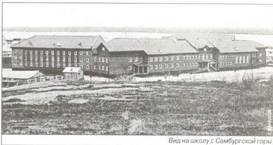
Вид на школу с Самбургской горы