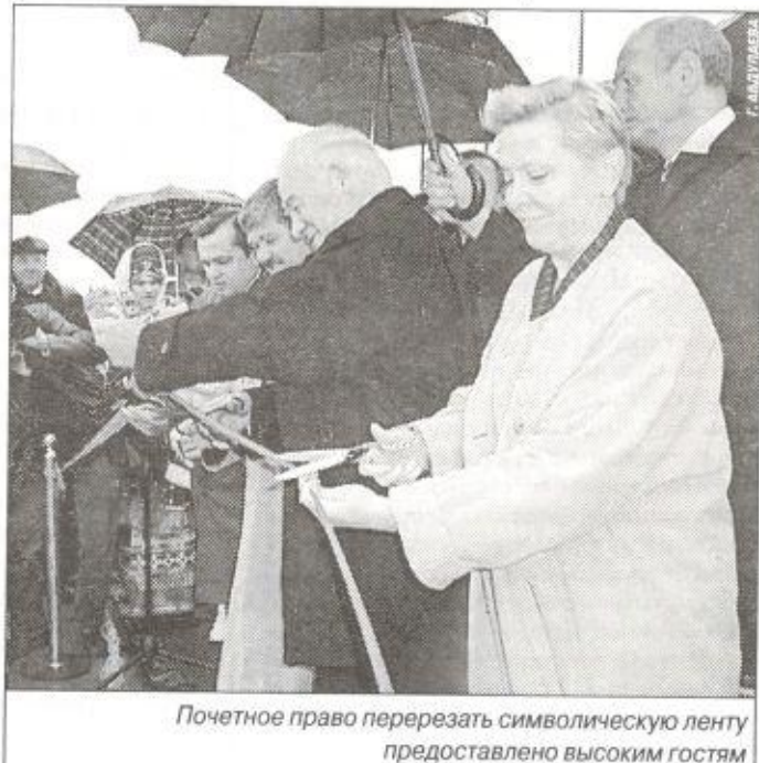
Почетное право перерезать символическую ленту предоставлено высоким гостям