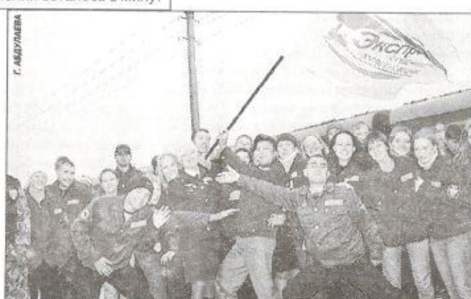
Первыми пассажирами фирменного поезда стали студенты Уральского государственного университета путей сообщения