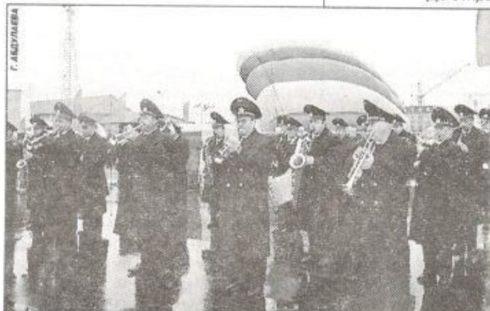
Под звуки духового оркестра первый состав фирменного поезда Новый Уренгой - Москва отправляется в путь

Тепло поздравил новоуренгойцев с праздником и поблагодарил их за доблестный труд полномочный представитель Президента РФ в Уральском федеральном округе Пётр Латышев. Затем министр путей сообщения Геннадий Фадеев вручил Почётные грамоты, денежные премии и именные часы лучшим работникам, восстановившим железнодорожное полотно. А первому пассажиру был выдан документ на бесплатный проезд в фирменном поезде до конца года. Под звуки духового оркестра первый состав поезда сообщением Новый Уренгой - Москва отправился в путь. Знаменательное событие, которого ждали более 10 лет, свершилось. В добрый путь, «Ямал»!