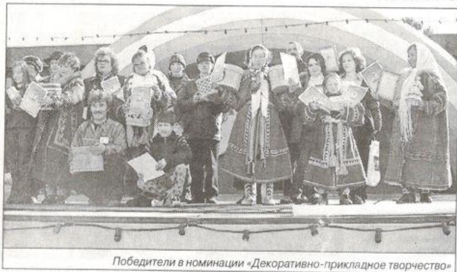
Победители в номинации «Декоративно-прикладное творчество»

1 место - мастер года - решено не присуждать