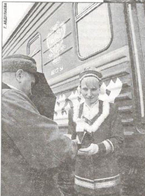
До отправления осталось 5 минут

ководства округа построить новое здание вокзала в Новом Уренгое и пустить в будущем году фирменный поезд по маршруту Лабитнанги - Москва».