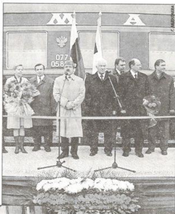
Юрий Неёлов поздравляет новоуренгойцев

лена система безопасности движения поездов. Освоено 900 млн. рублей. Прибывший на торжественную церемонию министр путей сообщения Геннадий Фадеев сказал: «Мне нравится тот подход к решению проблем в округе, который предлагает губернатор Ю. Неёлов. Богатейший край, который даёт тепло всей стране и многим государствам Европы, теперь имеет более надёжную транспортную схему. Я целиком поддерживаю инициативу ру-