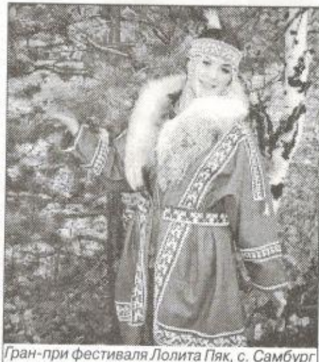
Гран-при фестиваля Лолита Пяк, с. Самбург