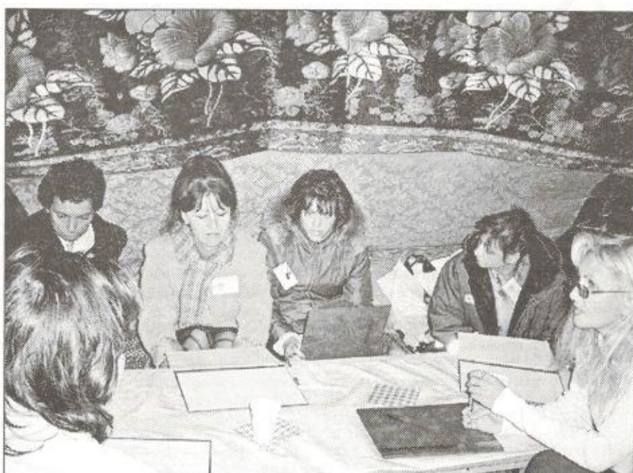
Работа жюри хореографической и вокальной номинаций