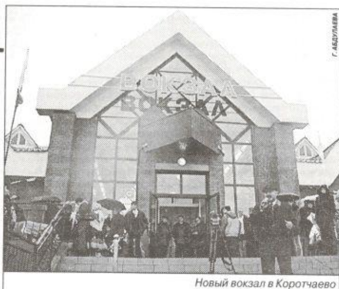
Новый вокзал в Коротчаево

В 9 часов утра на торжественное мероприятие прибыли высокие го-