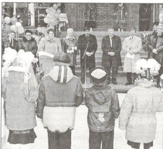
Торжественное открытие школы-интерната