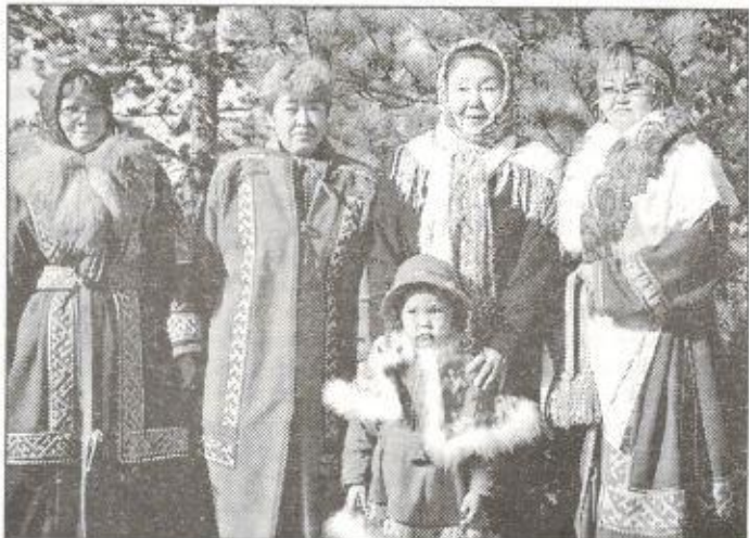
Участницы фестиваля из п. Тарко-Сале