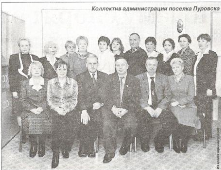
Коллектив администрации поселка Пуровска

И главный источник, за счет которого предполагается рост Пуров-