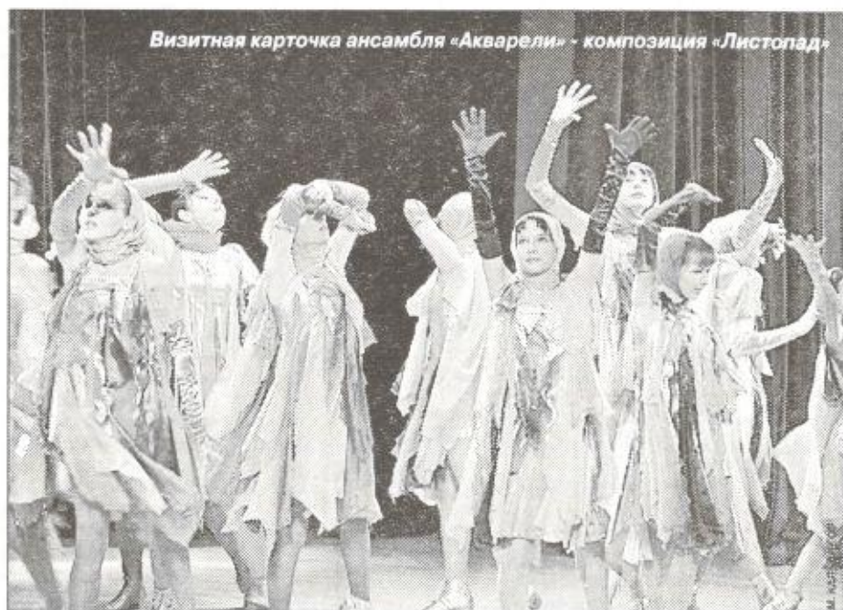
Визитная карточка ансамбля «Акварели» - композиция «Листопад»

- За девять месяцев этого года нашим Домом культуры проведено 114 мероприятий, которые посетили 17627 человек. За этот период творческие коллективы «Юбилейного» семнадцать раз участвовали в районных мероприятиях, конкурсах и выставках. Нами были подготовлены и проведены шесть собраний и одна радиогазета. Все запланированные мероприятия прошли на высоком уровне, с хорошей организацией. Положительные отзывы коллектив ДК получил после проведения внеплановых мероприятий: вечера чествования спортсменов поселка Тарко-Сале, «Вечера добрых отношений» и вечера отдыха ветеранов войны и труда. Та-