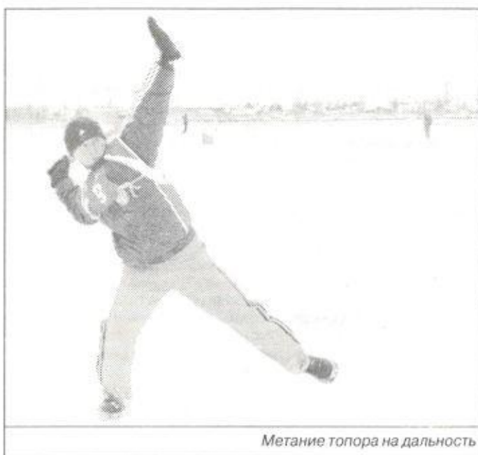
Метание топора на дальность