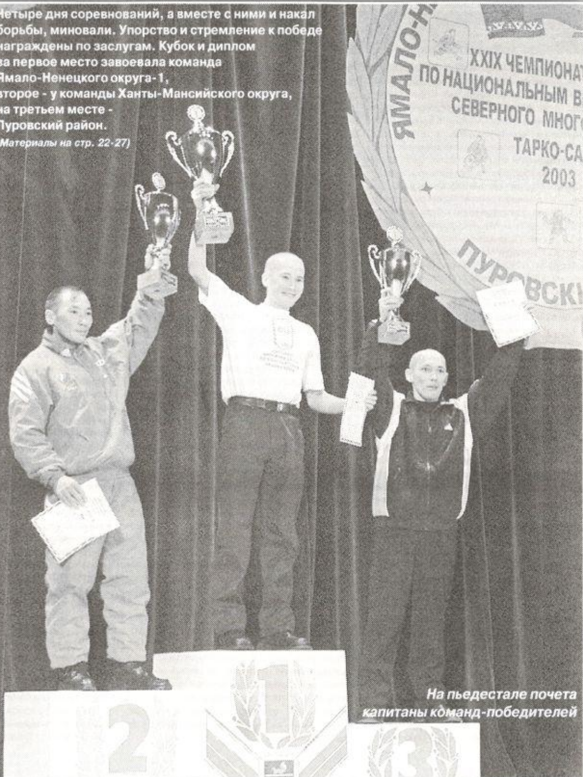
На пьедестале почета капитаны команд-победителей