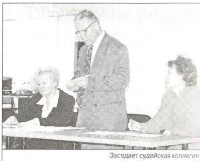
Заседает судейская коллегия