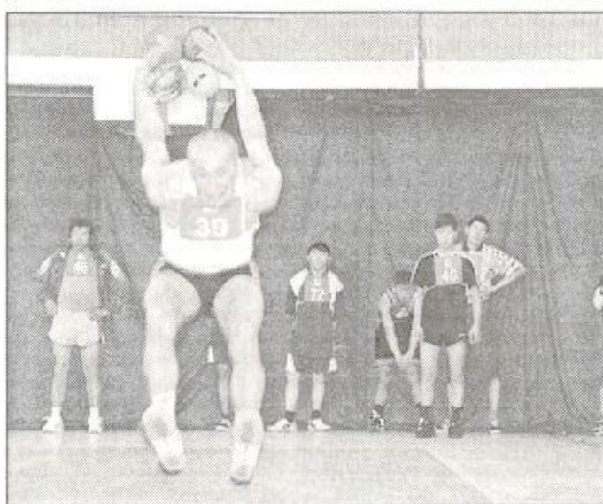
Соревнования в тройном национальном прыжке