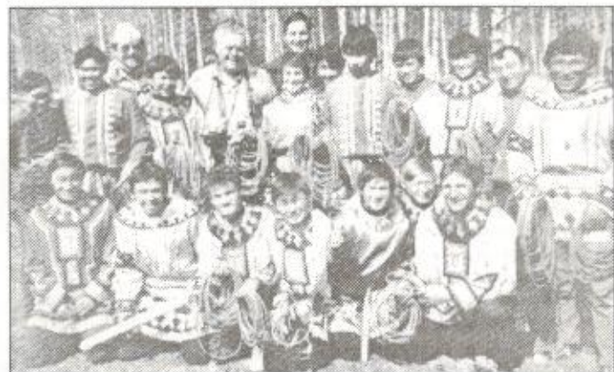
Команда Ямала 80-х. Сегодня многие из них представляют спортивную элиту России.

Основное вооружение древних кочевников тундры и тайги состояло из кольчуги (прекрасно владели техникой обработки металла) и различного вооружения. К боевому оружию относились: лук со стрелами, топор, хорей с металлическим копьевидным наконечником - наря (используется до настоящего времени для защиты от волка и для щегольства), кинжал и аркан - тынча . С помощью аркана удобно было снимать дозорных на