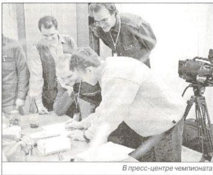
В пресс-центре чемпионата

нее, главу района и районный спорткомитет, администрацию поселка Тарко-Сале за то, что дали возможность участвовать в соревнованиях. Она пообещала впредь достойно защищать честь Пуровского района и пожелала участникам XXIX чемпионата воли к борьбе и честных побед.