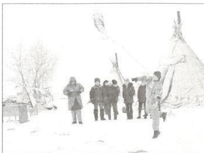
Метание тынзяна на хорей