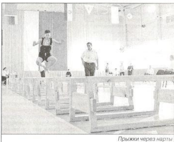
Прыжки через нарты