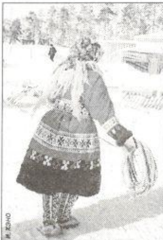
Тынзяном вполне профессионально владеют и женщины. Март 2002 г., восточные ханты

дальнем расстоянии, а топор использовали в ближнем бою. (Во время Великой Отечественной войны аркан часто использовали воины-северяне для снятия часовых и добычи немецких «языков».) Используя хорей с наконечником, можно было преодолевать преграды (рвы, небольшие реки), одним прыжком догнать убежавшего, также использовать его как оружие в дальнем бою. Всеми этими вооружениями владели и женщины. После гибели своих мужей и сыновей они зачастую занимали их место в сражениях. Помимо этого надо же было попросту выживать, воспитывать детей, охотиться и защищать свое жилище от непрошенных гостей.