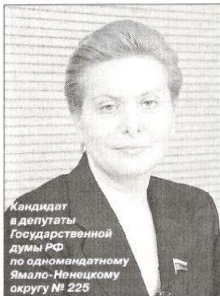
Кандидат в депутаты Государственной думы РФ по одномандатному Ямало-Ненецкому округу № 225

7 декабря 2003 года Ямал выбирает своего депутата