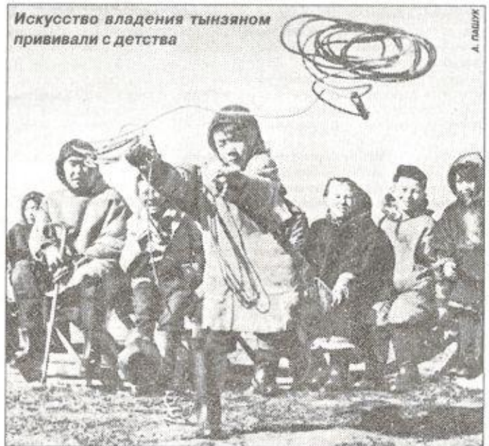
Искусство владения тынзяном прививали с детства

Есть и более усложненный вариант для ребят постарше - ловля оленей в движении. Играющие делятся на две команды: «оленеводов-пастухов» и «оленей». Обычно оленей изображают младшие дети, они дер-