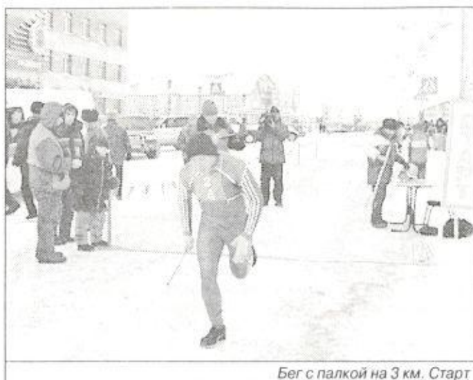
Бег с палкой на 3 км. Старт