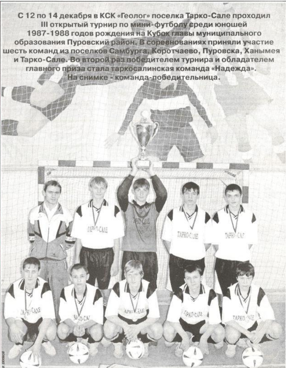
С 12 по 14 декабря в КСК «Геолог» поселка Тарко-Сале проходил III открытый турнир по мини-футболу среди юношей 1987-1988 годов рождения на Кубок главы муниципального образования Пуровский район. В соревнованиях приняли участие шесть команд из поселков Самбурга, Коротчаево, Пуровска, Ханымея и Тарко-Сале. Во второй раз победителем турнира и обладателем главного приза стала таркосалинская команда «Надежда». На снимке - команда-победительница.