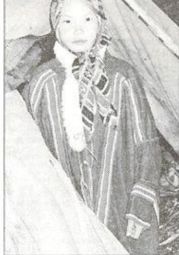
Вот и в школу пора. Так не хочется расставаться с мамой, братиком...

Первые, чуть заметные приметы осени начинают подкрадываться в тундру уже в середине августа, с наступлением заморозков. Кстати, в этом году они наступили 9 августа: тундровый мох был подморожен. В сентябре уже чувствуется резкое дыхание цэрм - Севера.