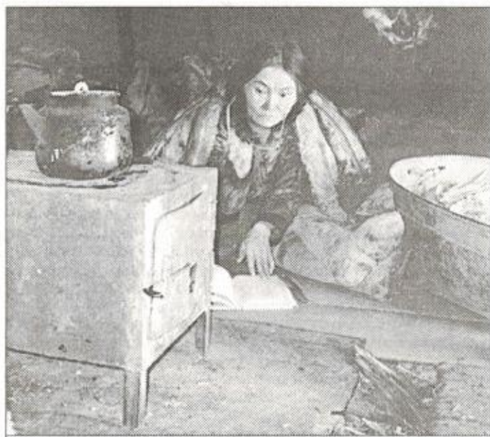
Глаза привыкают к полумраку, можно даже почитать при свете керосиновой лампы

К началу или середине октября тундра полностью застывает, реки и озера покрываются льдом, землю припорошивает снегом. Лед уже достаточно крепок и выдерживает вес взрослого человека. Значит пора! Еще ранним утром взрослые, сложив на небольшие нарты