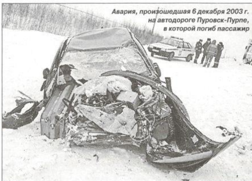
Авария, произошедшая 6 декабря 2003 г. на автодороге Пуровск-Пурпе, в которой погиб пассажир