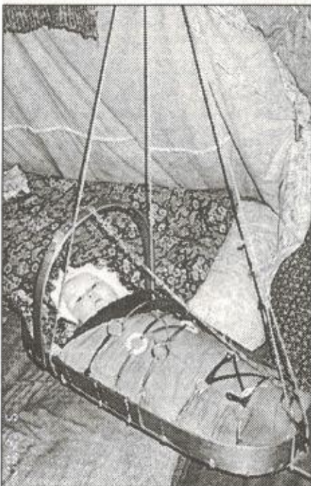
Люлька - это первое жилище маленького чочевника. В нем всегда тепло, уютно и сухо. Пяку-Пур, сентябрь, 2000 г.

«Малышу, если предстоящей ночью не захочет уgomониться, надо дать имя,» - твердо ска-