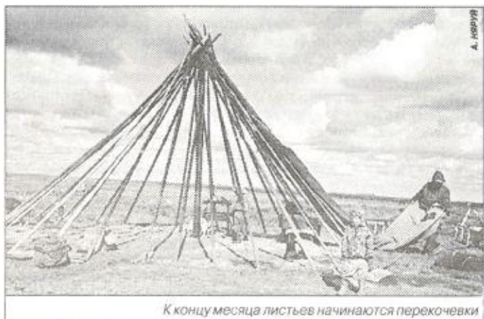
К концу месяца литьев начинаются перекочевки

Специальная охота на дичь в осенний период традиционно почти не велась. В старину разрешалась охота лишь на линных гусей. Стреляли в них из лука, иногда устраивали соревнования в беге: если догонял кто-либо из соревнующихся гуся, то добыча доставалась ему. Кстати, подобные соревнования похлеще марафонских забегов и бега с препятствиями: ведь надо было бежать по болоту, по кочкам, по высокой траве и совсем не в спортивной форме. В настоящее время осенняя охота допускается только в случае крайней нужды. Бывает, что утки случайно попадают в рыбацкие сети, тогда из них охотно готовят жаркое или суп. А вообще летом и осенью