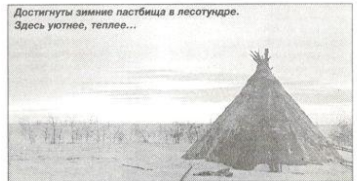
Достигнуты зимние пастбища в лесотундре. Здесь уютнее, теплее...

Автор публикации и руководитель проекта И. ХЭНО. Материалы к публикации подготовила И. АМАНЕНКО