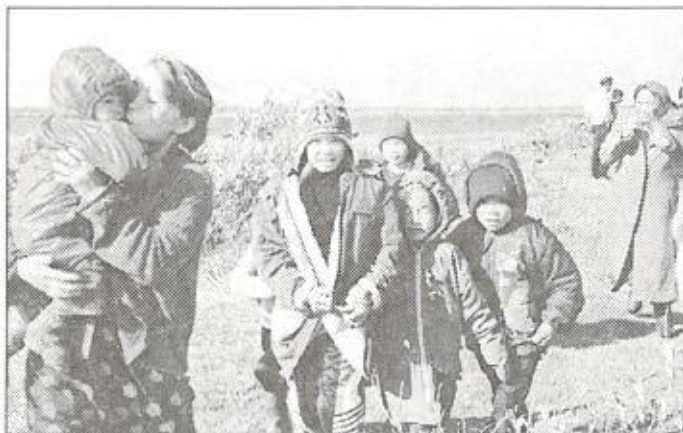
Прилетел вертолет - "разлучник". А так хочется пожить еще дома