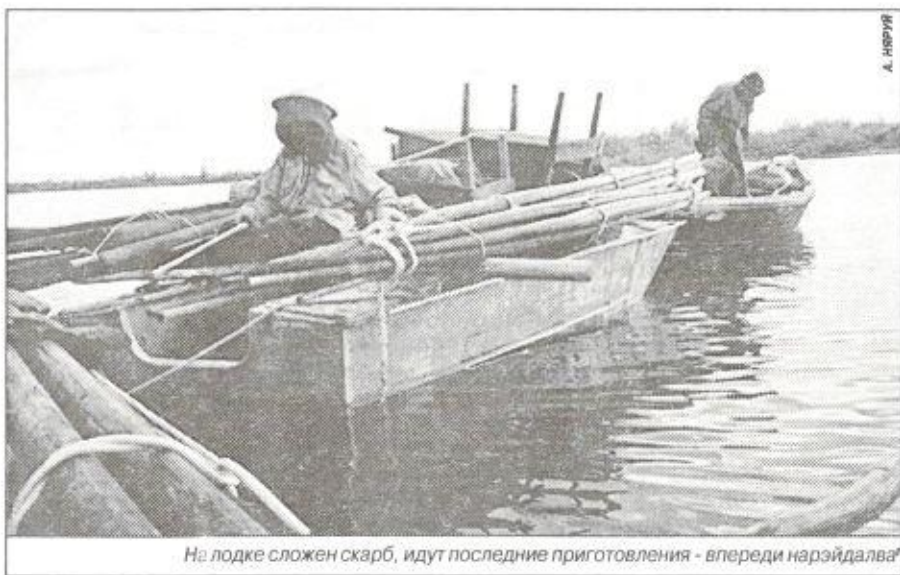
На лодке сложен скарб, идут последние приготовления - впереди нарэйдалва

В ясные и теплые дни месяца литьев на окраинах засохших проток и озер - хасре'э женщины собирают сухую траву - пива'чум - для подкладок в кисы, а также для плетения циновок - вав'чум . В редких березовых рощицах может попасться и чуначь - чага, и на-