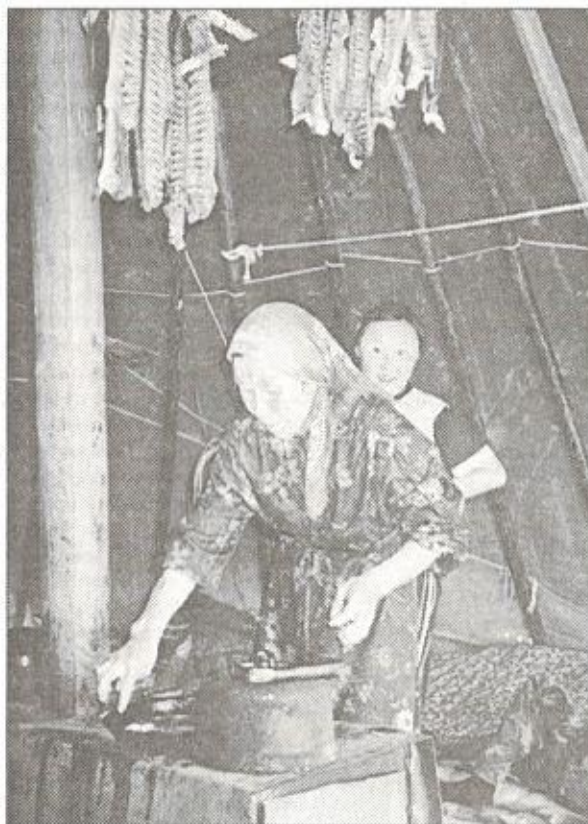
Скоро будут готовы котлеты из белой рыбы

Солнечные дни позади, начинается сезон дождей. Кажется, что осенний тундровый дождь льет нескончаемыми потоками, а под напором шквального ветра скрипят шесты чума. Дрова из ольхи и ивняка плохо горят, костер шипит и сильно дымит. Сухие дрова приходится экономить, их кладут в печку вперемешку с ивняком. Дождь иногда перестает, но не надолго. Через небольшой промежуток вре-