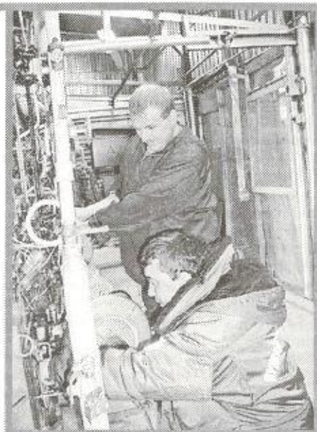
своей работе. Энергетики готовы и дальше трудиться с полной отдачей, чтобы обеспечить эффективную работу промыслов и других производственных участков предприятия.

Несмотря на экономические трудности, коллектив добивается устойчивых результатов в