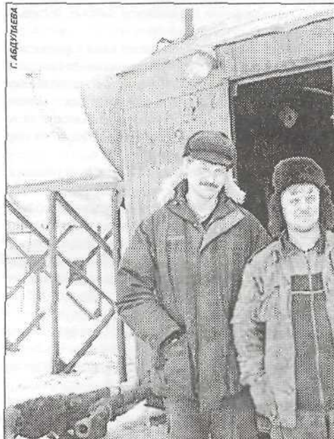
В бригаде ТС НГРЭС готовятся испытывать скважину

ции нестабильного конденсата, блока депарафинизации, конденсатопровода и газопровода, по которым добываемое сырье будет транспортироваться на Пуровский ЗПК. На этом этапе планируем уровни добычи составят 780 тонн газоконденсата в сутки и 2200 тысяч кубометров газа сепарации».