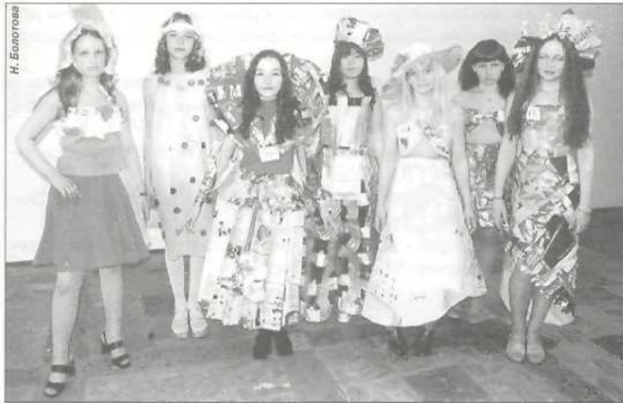
Театр моды «Созвездие» школы № 3 г. Тарко-Сале признан лучшим в номинации «Одежда из бросового материала»