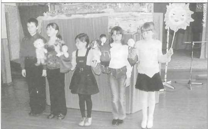
Театр «Куколки» ДДТ п. Ханымея получил диплом в номинации «Кукольный театр»