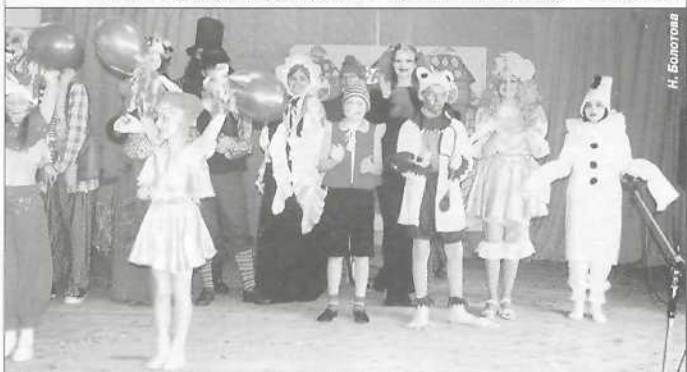
Театральный коллектив «Маска» СШ № 1 п. Пурпе получил третье место в номинации «Детский театр» и диплом за лучшее художественное оформление и сценические костюмы в спектакле «Золотой ключик»