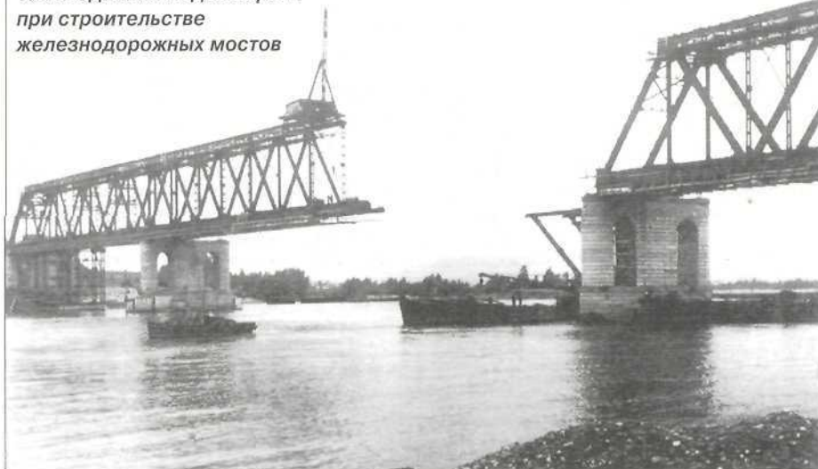
Так соединяются два берега при строительстве железнодорожных мостов