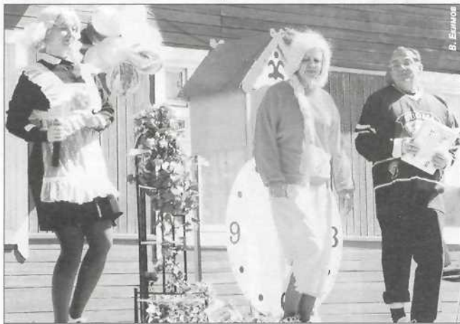
«Сказку о потерянном времени» рассказали сотрудники «Юбилейного»

Сейчас они только-только набирают силу, перенимают опыт и просто живут своей детской жизнью: падают и зарабатывают шишки на лбу, ошибаются и получают двойки, влюбляются и терпят первое фиаско. Но за всей этой детской реальностью и непосредственностью стоим мы – взрослые. И то, какими эти цветы будут, зависит именно от нас. Мы стараемся научить, направить, подказать, похвалить, приласкать, но бывает достаточно подарить ребенку небольшой праздник, чтобы он понял, насколько мы дорожим, насколько любим и верим в него.