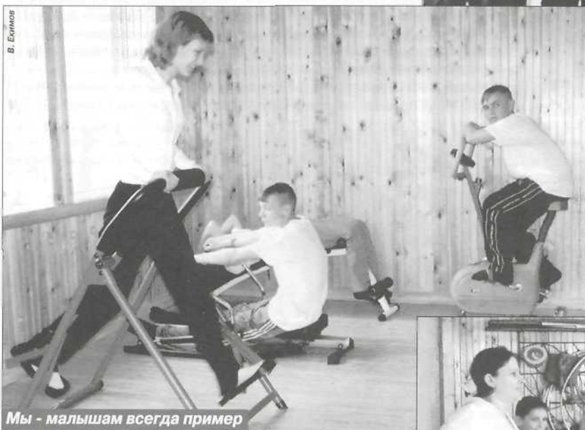
Мы - малышам всегда пример

соты «Русская красавица» подростки изготавливают подарки, специальные заказы и многое другое.