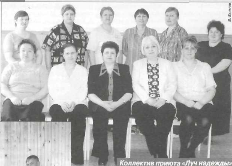
Коллектив приюта «Луч надежды»

В Пуровском районе социальной заботе и защите граждан отводится приоритетная роль. Создано несколько муниципальных учреждений: Центр социальной помощи семье и детям - лучший на Ямале, социальный приют для детей и подростков «Луч надежды», который существует уже более восьми лет. За это время в приюте нашел помощь и поддержку 461 ребенок.