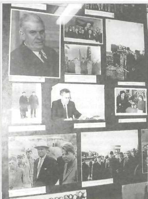
Экспонаты музея им. Д. И. Коротчаева, который находится в г. Тюмени в здании, где ранее располагалось управление «Тюменьстройпуть»

2003 год, сентябрь. 15 сентября завершилась реконструкция участка железной дороги Коротчаево - Новый Уренгой. До Москвы отправился первый фирменный поезд «Ямал».