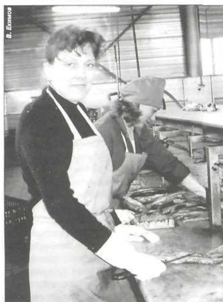
Ремонт цеха и оборудования успешно завершили

«Мы живем на территории, богатой ценными породами рыб, поэтому здесь должно развиваться и соответствующее производство. Несколько лет назад рыбной продукции выпускалось больше, она пользовалась спросом и приносила прибыль. Наша задача - выйти на прежний уровень производственных объемов и сделать производство рентабельным. Поэтому было принято решение о создании на базе муниципального предприятия «Пуровский рыбокомбинат» общества с ограниченной ответственностью «Пур-рыба». Это дало возможность начать хозяйственную деятельность с чистого листа, без долгов прежнего предприятия. Хотя вновь образованное ООО и осталось в муниципальной собственности, такая форма хозяйствования возлагает больше ответственности на руководителя предприятия. И если раньше он мог прийти и попросить денег на нужды производства, то сейчас должен предложить эффективную производственную программу.