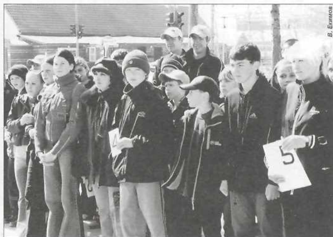
К сезону «Трудовое лето-2004» всегда готовы!

Не менее красочно и задорно прошло празднование Дня защиты детей у КСК «Геолог».