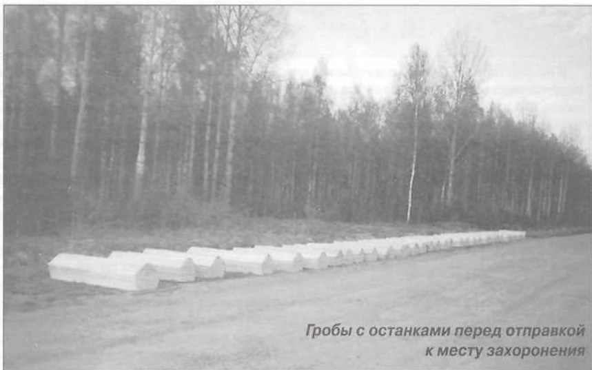
Гробы с останками перед отправкой к месту захоронения

С собой мы привезли несколько предметов, найденных в экспедиции. Это - хорошо сохранившаяся советская каска, даже с краской (в этих местах это большая редкость, т. к. места болотистые); ствол винтовки Мосина; ствольная коробка от писто-