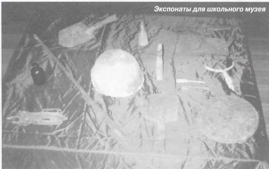
Экспонаты для школьного музея