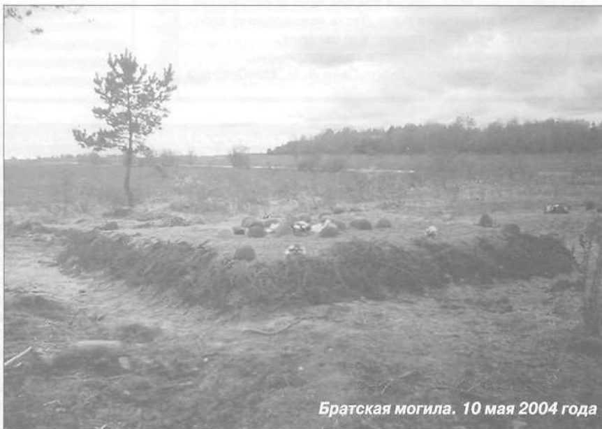
Братская могила. 10 мая 2004 года

лета-пулемета Шпагина; две саперные лопатки разных заводов изготовления, датированные 1941 годом; светильник, сделанный из гильзы советской пушки 45-го калибра; ухват от печи, найденный рядом с санитарным захоронением; две ложки (одна - железная, вторая - алюминиевая с буквами СКФ, видимо, инициалы владельца), а также магазин от ручного пулемета Дегтярева (РПД).