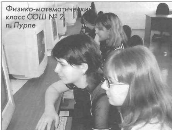
Физико-математический класс СОШ № 2 п. Пурпе

Профильные классы, как мы уже говорили, предназначены для расширения и углубления общеобразовательной подготовки учащихся в той или иной области. И ее хороший уровень дает возможность выпускникам выбирать тот вуз, который больше нравится, а не тот, куда проще попасть.