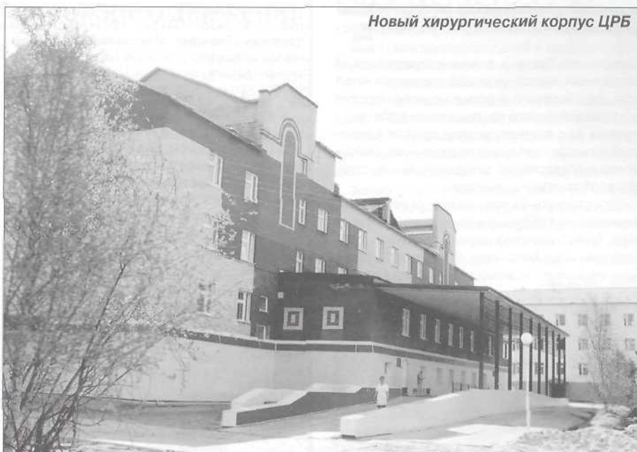
Новый хирургический корпус ЦРБ

Район наш уникален. Его уникальность заключена во многих аспектах. Во-первых, некоторые лечебные учреждения района находятся на удаленном расстоянии от райцентра. Например, до Самбурга от Тарко-Сале - свыше 250 километров, а до Ханымея - около 280 километров. В связи с этим возникают проблемы, связанные с транспортной схемой. Во-вторых, на территории Пуровского района выросло несколько крупных городов, и некоторые наши населенные пункты расположены намного ближе к ним, чем к райцентру. Поэтому людям гораздо удобнее получать медицинскую помощь именно в близлежащих городах, чем ездить в Тарко-Сале. Если раньше это не влекло за собой большие сложности, то сейчас, когда здравоохранение пытаются втиснуть в прокрустово ложе рыночных отношений, медицинские учреждения соседних муниципальных образований требуют оплаты за лечение пуровских больных, или им все-таки придется обращаться за медицинской по-