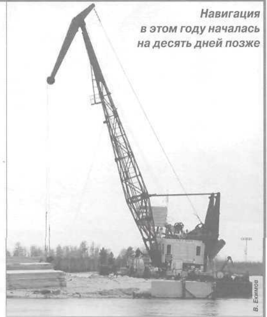
Навигация в этом году началась на десять дней позже

Речной флот - самый дешевый вид транспорта после трубопроводного, поэтому заказчики у нас всегда будут. ОАО «Пургеолфлот» уже