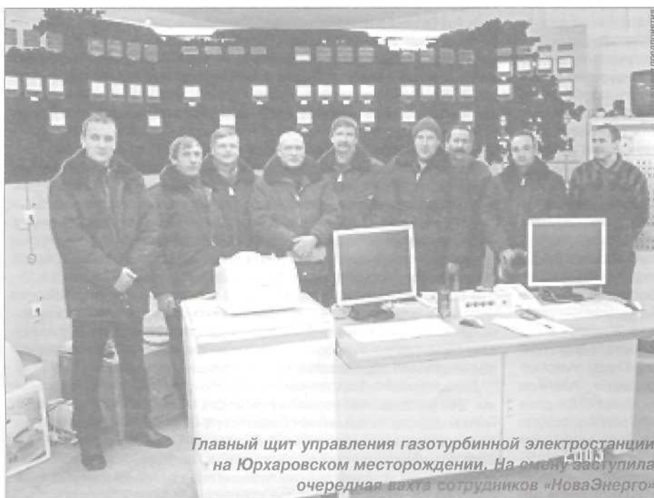
Главный щит управления газотурбинной электростанции на Юрхаровском месторождении. На смену заступила очередная вахта сотрудников «НоваЭнерго»