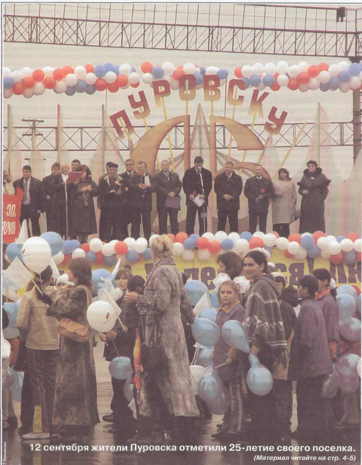
12 сентября жители Пуровска отметили 25-летие своего поселка.