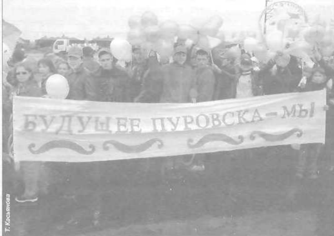
Колонна СШ № 1