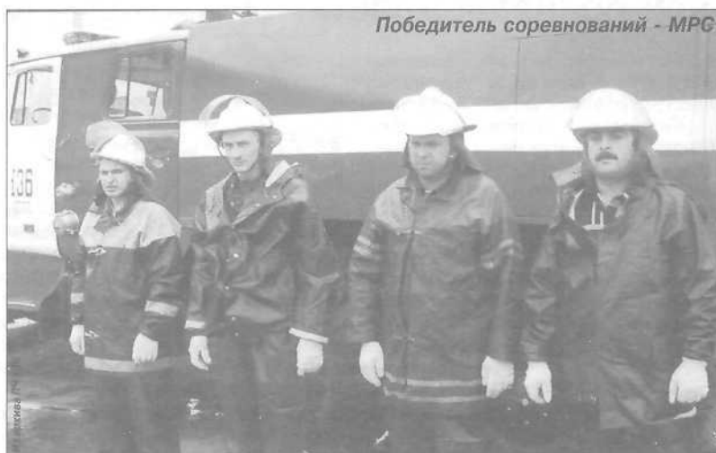
Победитель соревнований - МРС

В этом году в состязании приняли участие три команды: команда механоремонтной службы, службы энерговодоснабжения и автотранспортной колонны. Им предстояло сразиться в двух видах соревнований. Первый вид - одевание боевой одежды и снаряжения на скорость - не выявил фаворита, так как две команды показали одинаковый по времени результат. Службы ЭВС и МРС выполнили задание за 27 секунд, а служба АТК - за 32 секунды. Но во втором, самом сложном этапе победил сильнейший. Команда механоремонтной службы за одну минуту и двадцать одну секунду установила