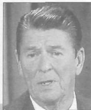
Рональд Рейган признавал, что был болен Альцгеймером в 1994 году

Удалившись в свою резиденцию в Калифорнии, экс-президент вел скрытый образ жизни и не появлялся на публике вплоть до самой своей смерти.