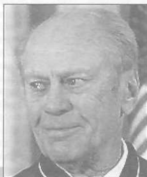
Джеральд Форд проводит время за игрой в гольф

Когда Форд покинул Белый дом, ему было 63 года. Однако он успешно продолжил свою политическую деятельность в республиканской партии. Форд был также знаменит своим увлечением игрой в гольф. Об экс-президенте вновь заговорили после выборов 2000 года, когда он вместе со своим бывшим соперником Картером выступил за изменение существующей избирательной системы.