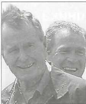
Джордж Буш-старший - великолепный советчик для своих сыновей