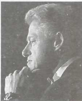
Билл Клинтон пока не у дел

Закончив президентскую карьеру совсем недавно, Билл Клинтон до сих пор испытывает на себе недовольство части американцев за все то, что, по их мнению, происходит в стране не так. В 54 года перед бывшим президентом открыты широкие перспективы, однако Клинтон пока не решил, куда приложить свой талант и силы. Близкие к Клинтону люди говорят, что трагические события 11 сентября заставили бывшего президента еще больше почувствовать себя "безработным". Клинтону приписывают слова о том, что у каждого президента должен быть на счету некий определяющий, решающий момент, чего он был лишен. Будучи 11 сентября в Нью-Йорке, Клинтон решил затаиться и не выступать в роли актера второго плана. В то же время администрация Буша решила не прибегать к помощи Клинтон в качестве посла для мирных переговоров в Северной Ирландии и на Ближнем Востоке. Так что экс-президент остается пока не у дел.