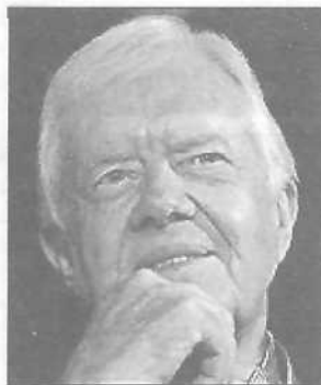
Джимми Картеру лучше всех удалась постпрезидентская деятельность

Некоторые обозреватели говорят, что, возможно, обществу просто требовалось больше времени, чтобы понять и оценить Картера. К мнению бывшего президента о кризисе на Ближнем Востоке до сих пор прислушиваются. Не надо забывать, что в заслуги Картера