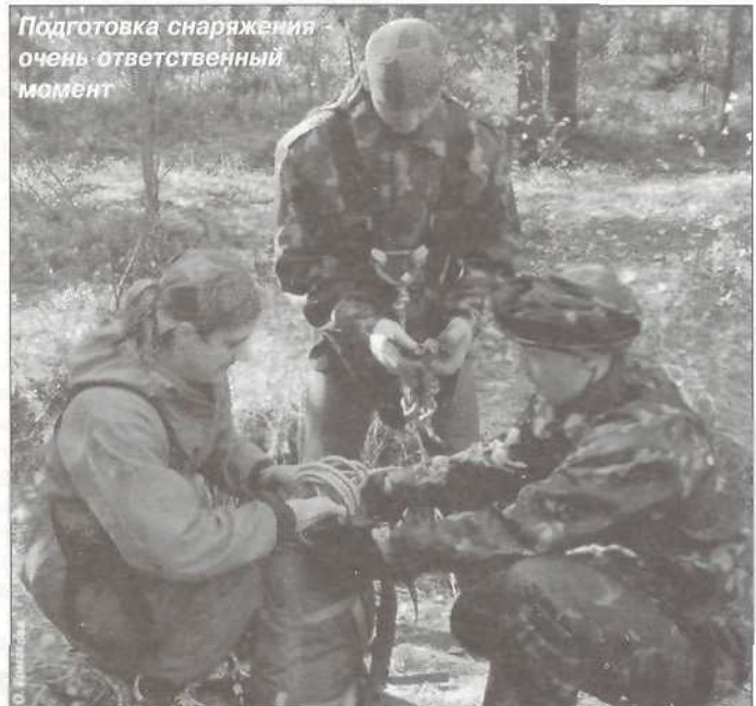
Подготовка снаряжения - очень ответственный момент

Состязания по спортивному рыболовству - третьему виду соревнований - состоялась ранним утром 20 сентября. В составы мини-