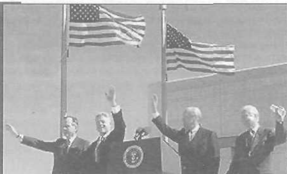
Бывшие президенты США: все дороги открыты

Бывшие президенты США всегда занимали привилегированное место в обществе. Когда лозунги “Да здравствует президент!” стихают, репортеры покидают пресс-конференцию, а фотографы закрывают объективы своих камер, бывшие хозяева Белого дома задумываются над своим будущим. Говорят, что Билл Клинтон ведет переговоры о том, чтобы стать ведущим ток-шоу на телевидении, а Джимми Картер намеревается поехать на Кубу для пропаганды демократии и прав человека. Где же находят свое призвание бывшие лидеры американской империи?