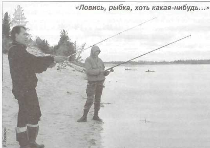
«Ловись, рыбка, хоть какая-нибудь...»

ченный вариант. Командам не пришлось укладывать бревно, как это было раньше. Спортсмены лишь организовывали командные перила и благодаря им преодолевали препятствие. Для прохождения закрытого этапа команда получала индивидуальное задание у старшего судьи этого этапа и старалась как можно быстрее с ним справиться.