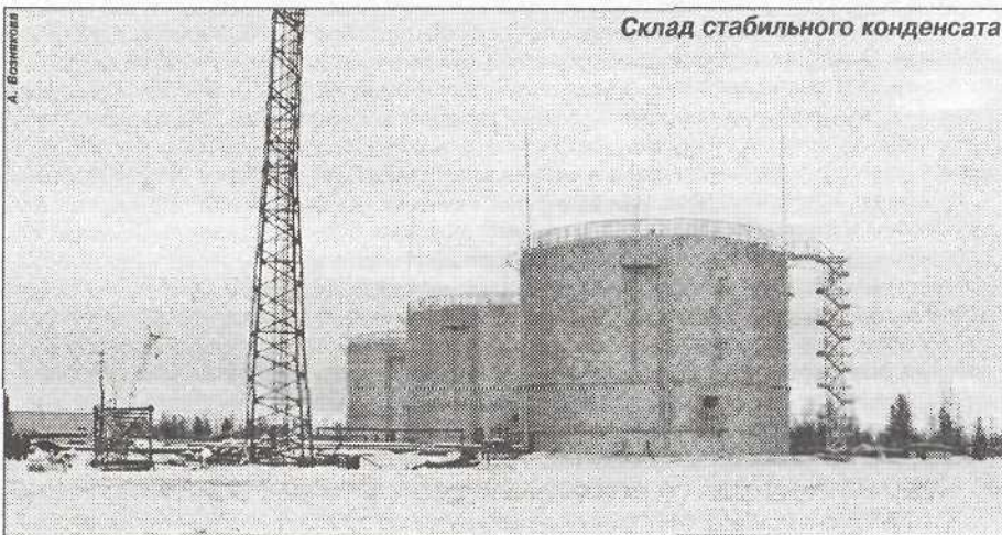
Склад стабильного конденсата

Особенности газового строительства заключаются в строжайшем соблюдении технологии: и детям малым понятно, с каким производством специалистам газопе-