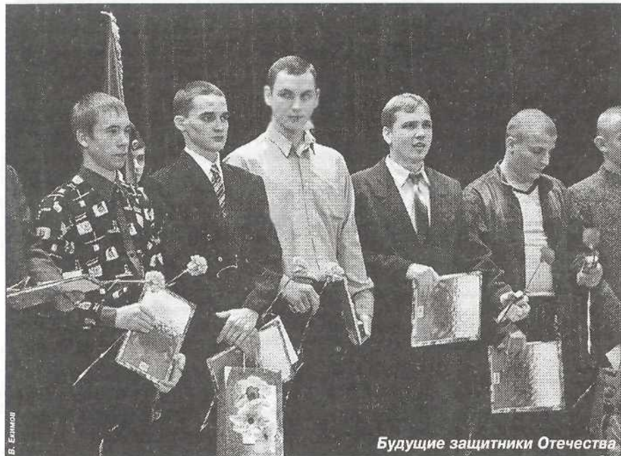
Будущие защитники Отечества