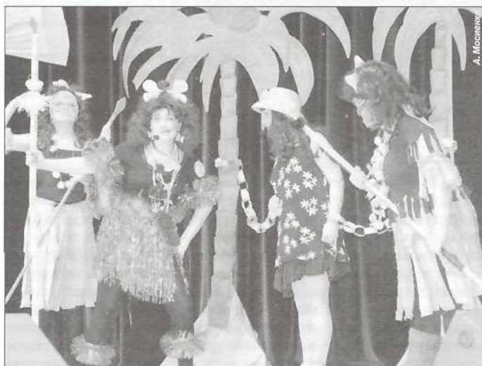
Африканский Новый год по пуровскому календарю

Так получилось, что в заключительном «Игровом» этапе раскрыли свои способности не участницы, а зрители. Раскрепощенность, талант, смекалку и актерский дар продемонстрировала со сцены большая часть зала. Но надо отдать должное, конечно же, конкурсанткам, сумевшим расшевелить и разогреть публику до такой степени, что в заданиях «Игрового» этапа зрители принимали участие с удовольствием и рвением: и в съемках новых версий кли-