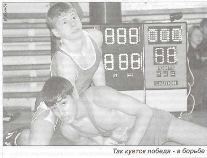
Так куется победа - в борьбе