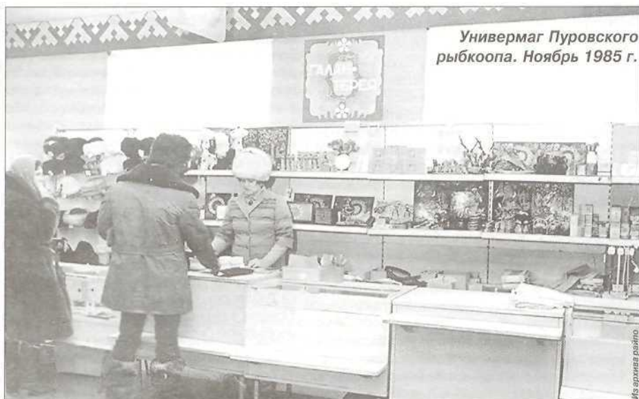
Универмаг Пуровского рыбкооп. Ноябрь 1985 г.

Закупки сельскохозяйственной продукции облегчают жизнь людей, обеспечивая селянам стабильные доходы, повышают занятость и экономическую активность жителей села.