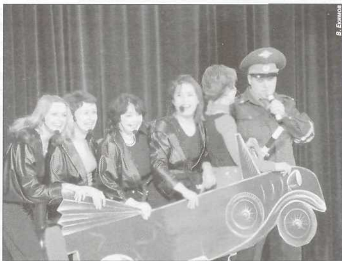
День автомобилиста празднуют пурпейцы