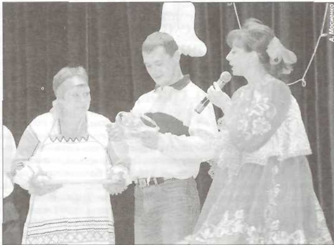
«Молодецкие забавы» городского ДК «Юбилейный»

«Пуровский затейник» прошел, оставив в наших сердцах неизгладимый след. И то, что этот конкурс стал праздником как для уча-