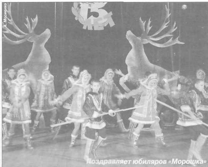
Поздравляет юбиляров «Морошка»

становится возможным благодаря грамотной работе актива Ассоциации с нефтегазодобывающими предприятиями: НК «Роснефть», ОАО «Сибнефть-Ноябрьскнефтегаз», ОАО «Пурнефтегазгеология», ОАО «НК «Таркосаленнефтегаз», ОАО «Ханчейнефтегаз» и др. В этот вечер партнеры обменялись словами признательности и уважения и выразили надежду, что деловые отношения, сложившиеся за эти годы, станут еще прочнее.