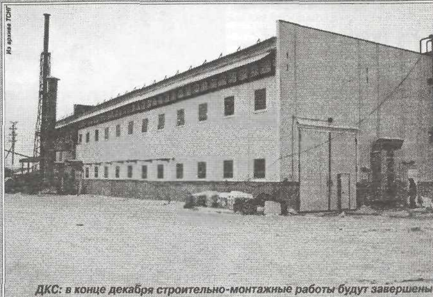
ДКС: в конце декабря строительно-монтажные работы будут завершены