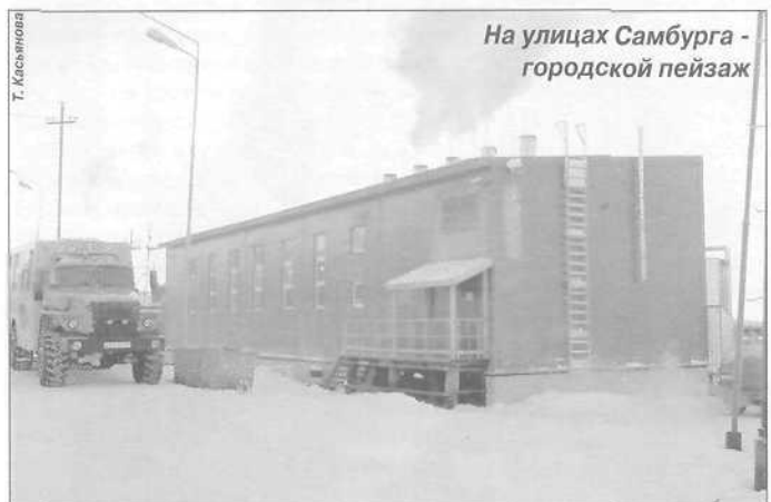
На улицах Самбурга - городской пейзаж

Экскурсией по городу закончился первый день праздничных торжеств, посвященных юбилею Пуровского отделения Ассоциации «Ямал - потомкам!». Дорогих гостей, приехавших практически со всех уголков земли ямальской, познакомили с достопримечательностями города Тарко-Сале.