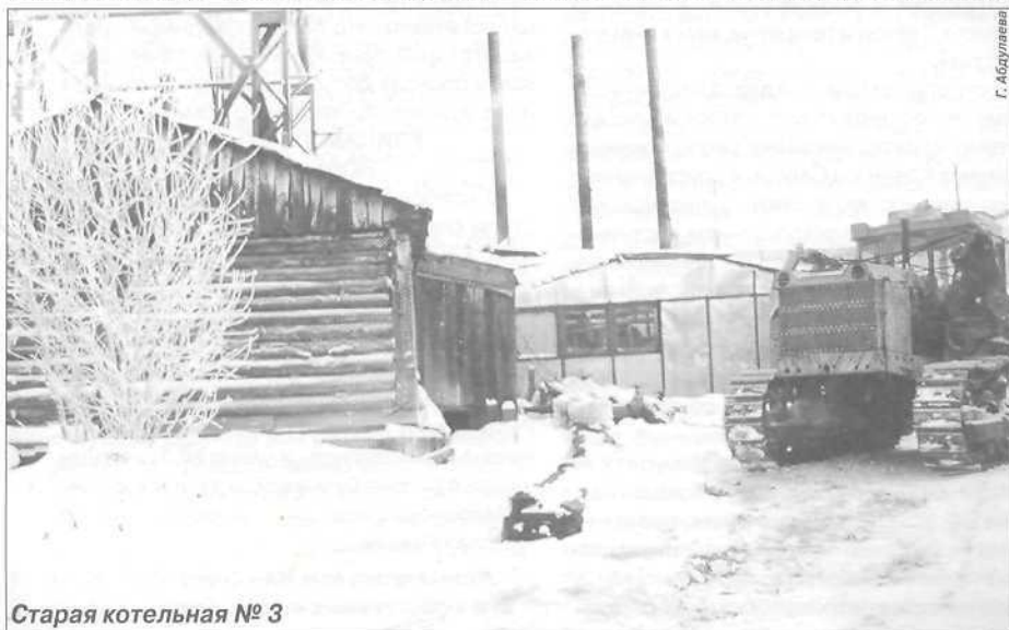
Старая котельная № 3