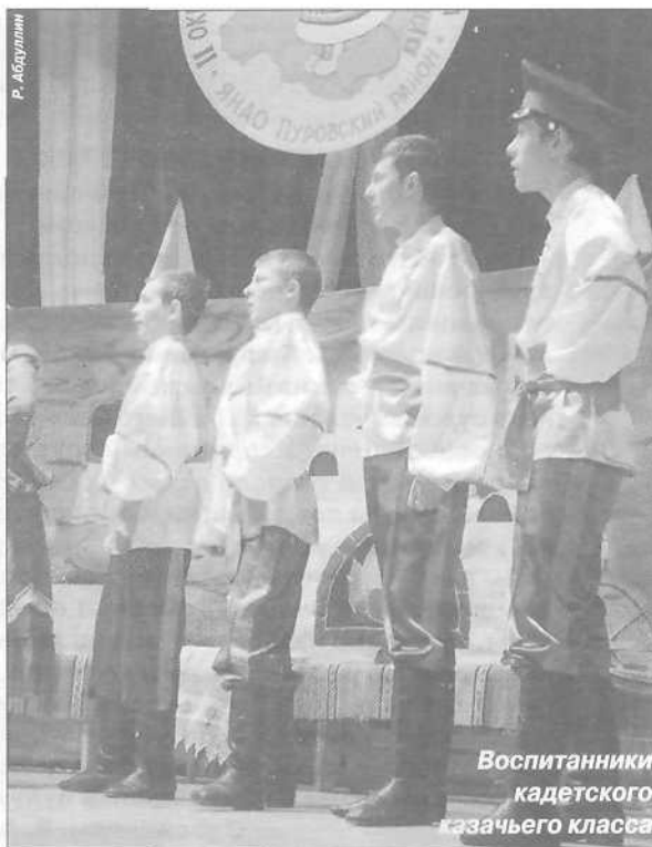
Воспитанники кадетского казачьего класса

- Период возрождения – это всегда тяжело. Особенно трудно работать у нас. Если где-то на Дону, в Краснодарском крае традиции казачества худо-бедно сохранились, то здесь не осталось вообще ничего. Еще одна большая проблема – очень мало родо-