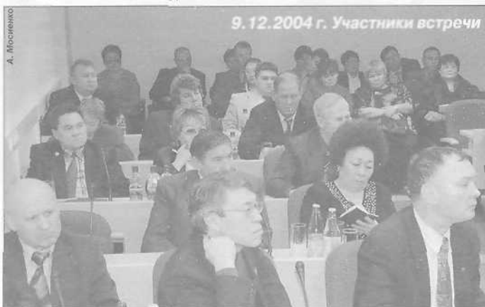
9.12.2004 г. Участники встречи

национальных культур. Как это происходит на пуровской земле, также рассказал глава района: «Во всех национальных поселках мы должны реставрировать культуру. Превратить ДК в очаги культуры, куда будет стремиться молодежь. Так, например, уже происходит в Самбурге. Это очень оправдано, потому что такой подход помогает нашим национальным культурам сделать следующий виток, раскрывающий творческие способности у людей коренной национальности. Я думаю, что и районная администрация, и Ассоциация «Ямал - потомкам!», и предприятия нефтегазового комплекса приложат все усилия, чтобы пуровская национальная культура поднялась на новый, более высокий уровень».