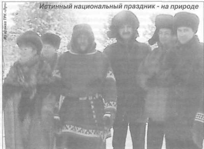
Истинный национальный праздник - на природе

Юбилей не будет считаться истинным юбилеем без празднично-