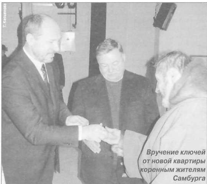
Вручение ключей от новой квартиры коренным жителям Самбурга

ная котельная, равной которой по уровню надежности, степени управляемости и энергозапасу в округе нет. Сегодня она работает на дизтопливе, а завтра запросто перейдет на газ, приумножив при этом свой резерв. Будущее Самбурга - городское, это когда в каждом доме будут два водовода - холодный и горячий, природный газ и для всех - магистральная канализационная сеть. Воображение гостей, а особенно прямых участников и спонсоров процесса развития и обновления Самбурга - представителей «Уренгойгазпрома», - поразило жилищное строительство. Здесь главная особенность в том, что новое жилье, во-первых, обособлено для каждой семьи, во-вторых - исполнено в полном соответствии с пакетом современных социальных потребностей человека. А в достижении это-