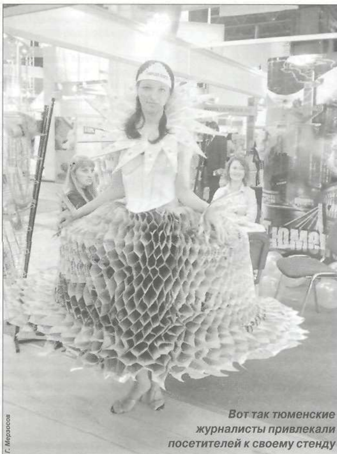
Вот так тюменские журналисты привлекали посетителей к своему стенду

Очень обнадеживающим для всех нас было благожелательное отношение московских властных и журналистских структур к нам, региональщикам. Ну разве можно отнести к неправильным слова бывшего первого заместителя министра печати, а ныне руководителя (директора) Федерального агентства по печати и массовым коммуникациям Михаила Сеславинского о том, что кроме послереформенных существуют и дореформенные проблемы на рынке прессы, такие как высокая стоимость подписки и развал системы доставки изданий? И подобных правильных слов в поддержку региональных СМИ было сказано немало, как немало было и стремления москвичей включать региональчиков в конкретную борьбу за свое выживание. В этом ряду - и согласие Г. П. Мальцева опубликовать в первом 2005 года номере «Журналиста» нижеприводимое «Горячее письмо».