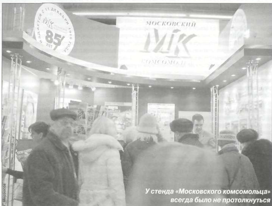
У стенда «Московского комсомольца» всегда было не протолкнуться