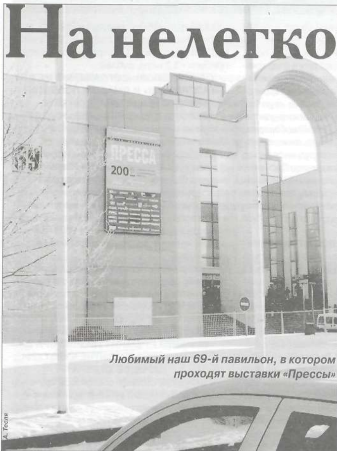
Любимый наш 69-й павильон, в котором проходят выставки «Прессы»

Фестиваль - это общероссийское целевое собрание, утрированно - большая профессиональная тусовка, на которой отмечаются успехи и достижения конкретного редакционного коллектива, происходит обмен опытом, обсуждаются приемы и методы улучшения работы, завоевания читательских сердец.