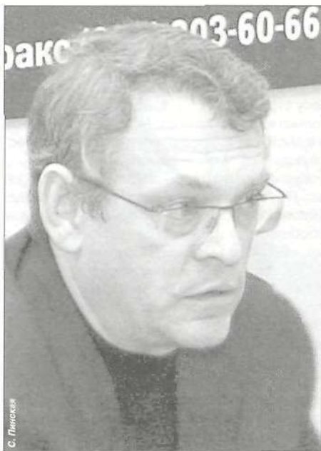
и связи. В мае 1998 года на VI съезде его избирают генеральным секретарем Союза журналистов России. С апреля 2004 года он - директор Института «Общественная экспертиза».