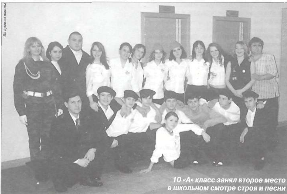
10 «А» класс занял второе место в школьном смотре строя и песни