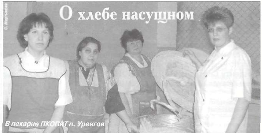
В пекарне ПКОПиТ п. Уренгоя

Искусство хлебопечения постигается только многолетним опытом. Чтобы печь настоящий русский хлеб, нужно еще, наверное, иметь и русский характер.