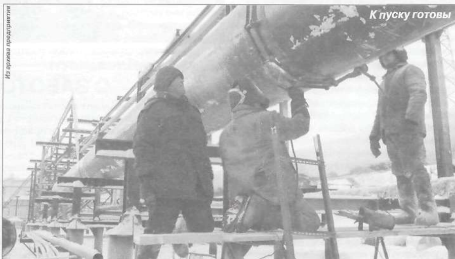
Из архива предприятия