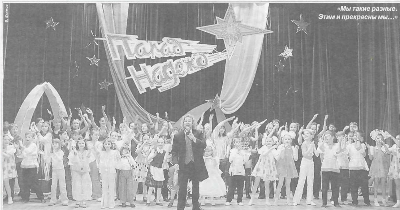
«Мы такие разные. Этим и прекрасны мы...»