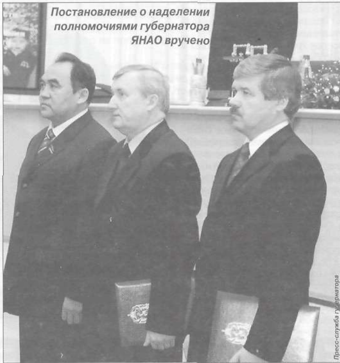
Постановление о наделении полномочиями губернатора ЯНАО вручено

По данным социологического исследования, проведенного на территории автономного округа в феврале нынешнего года, 80 % ямальцев на вопрос о доверии действующему главе региона ответили «Да».