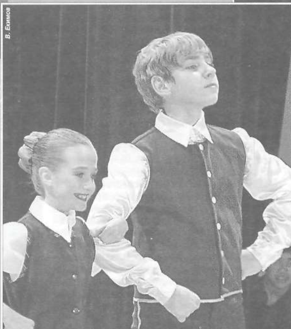
Дует «Виктория» из Ханымея