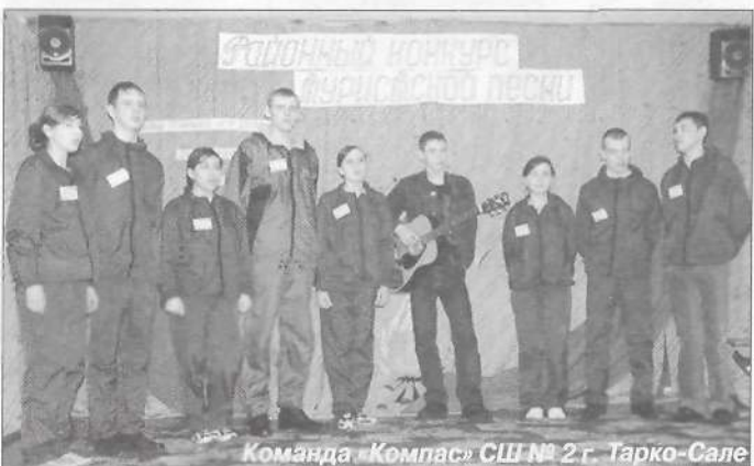
Команда «Компас» СШ № 2 г. Тарко-Сале