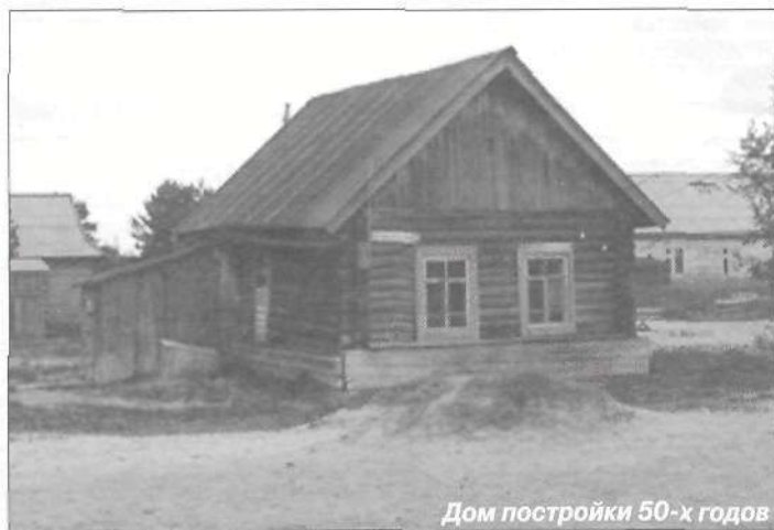
Дом постройки 50-х годов