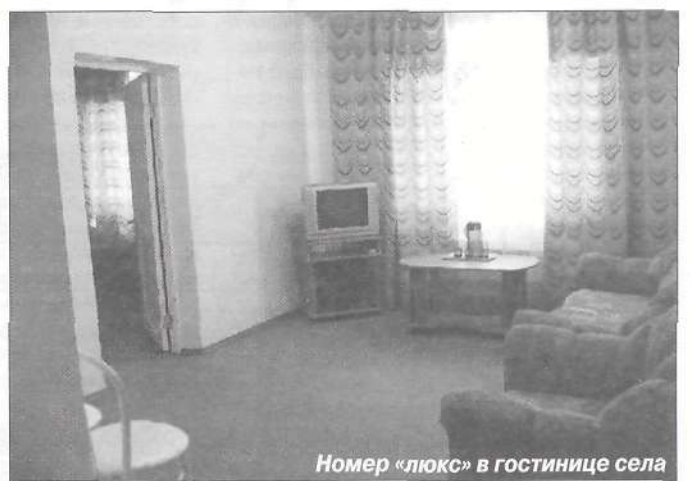
Номер «люкс» в гостинице села