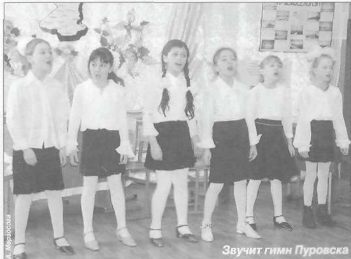
Звучит гимн Пуровска