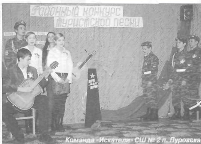
Команда «Искатели» СШ № 2 п. Пуровска

Л. ПАЙМЕНОВА, педагог-организатор ЦДТиК, фото А. МЕРЗОСОВОЙ