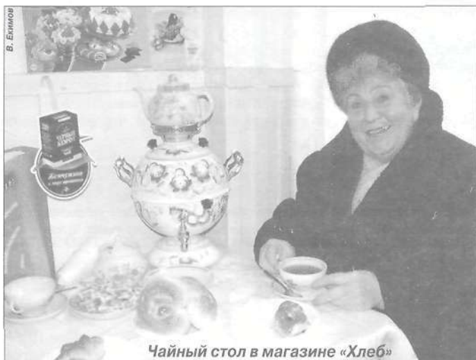
Чайный стол в магазине «Хлеб»

го населения, живущего в деревнях Харампур, Толька, в селе Самбург, на фактории Быстринка. (А это уже другой ассортимент промышленных и продовольственных товаров.) Осложняет работу территориальная разбросанность торговых точек: торгово-закупочный пункт (ТЗП) Самбурга находится в 300 км от райцентра на север, ТЗП Тольки - в 100 км - на юг. Но глаз хозяйский всюду есть. Такой евроремонт магазина в Тольке район сделал, что первое время люди снимали обувь, заходя в помещение. А живет в деревне 109 человек (73 рыбака, остальные - безработные).