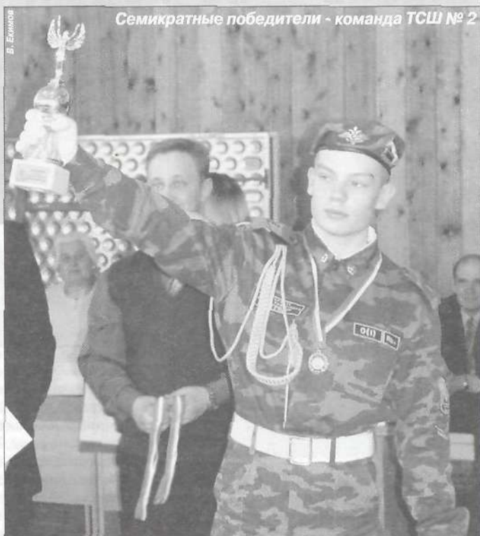
В. Екимов Семикратные победители - команда ТСОШ № 2

ванности участников. С этой целью проводились тестирования по курсам основ безопасности жизнедеятельности и военной службы. Участникам были розданы билеты, каждый из которых включал в себя три вопроса по ОБЖ, три вопроса по ОВП и один - по Дням воинской славы России. На ответы давалось 15 минут. Как отметили организаторы игр, теоретическая подготовка школьников находится на очень высоком уровне, что, конечно же, не может не радовать.