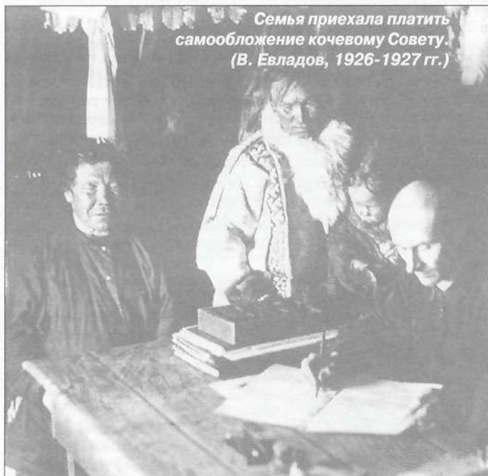
Семья приехала платить самообложение кочевому Совету.

В течение последующего десятилетия на территории северных тундр Пуровского района продолжалось «мягкое» правление большевиков. В 1925 г. туземное население освобождено от ясака (налогов и сборов), было запрещено также взимать с него недоимки, списывались долги, а нуждающиеся получали безвозмездные и долгосрочные ссуды - проводилось некое подобие НЭПа в северных широтах. Реальное же становление советской власти кочевники ощутили на себе к концу 20-х.