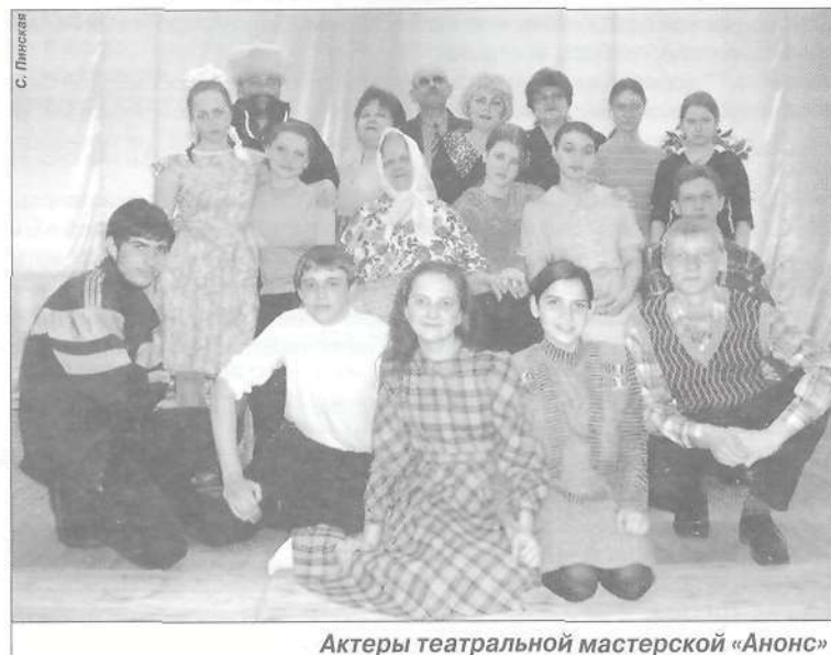
Актеры театральной мастерской «Анонс»

Существует ли настоящая любовь? Как сберечь это чувство? Каждый человек в жизни должен решить сам. На это и настраивает пьеса, посмотреть которую в ДК «Строитель» жители п. Пурпе смогут 14 мая.