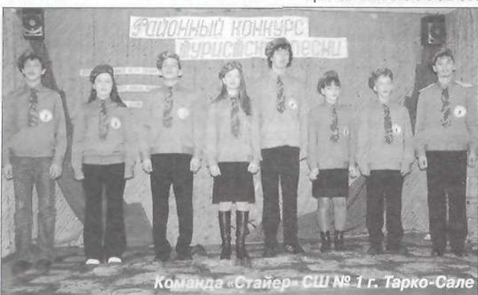
Команда «Стайер» СШ № 1 г. Тарко-Сале