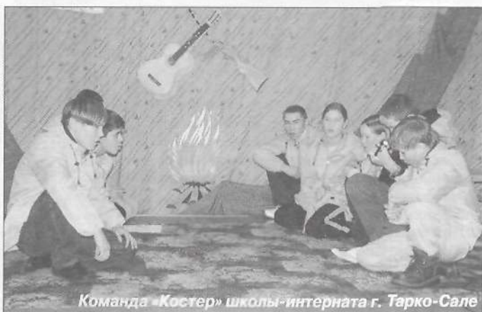
Команда «Костер» школы-интерната г. Тарко-Сале