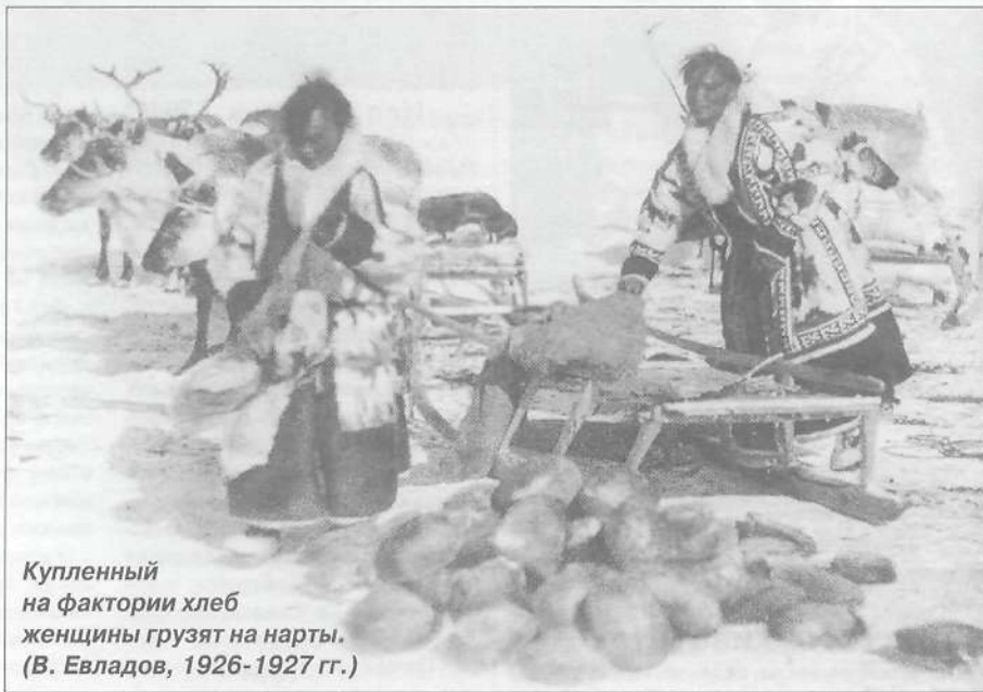
Купленный на фактории хлеб женщины грузят на нарты.

но-неопределенная оттепель: месяц - одна власть, месяц - другая. То белые, то красные, тут в пору было запутаться грамотному человеку, а что уж говорить о кочевниках тундры. Преобладающая масса туземцев Пура не имела никакого представления о большевиках. Деятельности частных предпринимателей в эти годы сворачивается, с 1920 года происходят постоянные реорганизации рыбопромышленных предприятий, отобранных со всеми, как сейчас сказали бы, основными фондами у промышленников и купцов, в го-