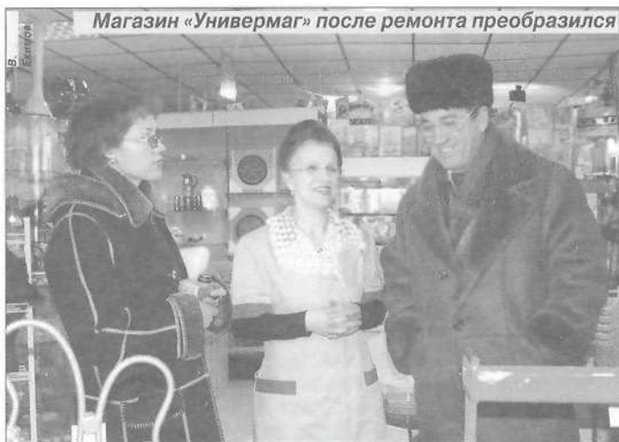
Магазин «Универмаг» после ремонта преобразился

дывая России, но при этом самое главное наше богатство - люди, живущие здесь. Цель, которую работники потребительской кооперации ЯНАО ставят перед собой, заключается в улучшении жизни жителей округа, в понимании и разрешении их проблем и нужд.