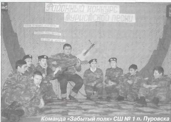
Команда «Забывтый полк» СШ № 1 п. Пуровска