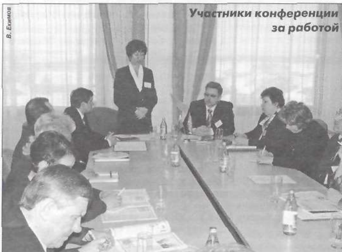
Участники конференции за работой