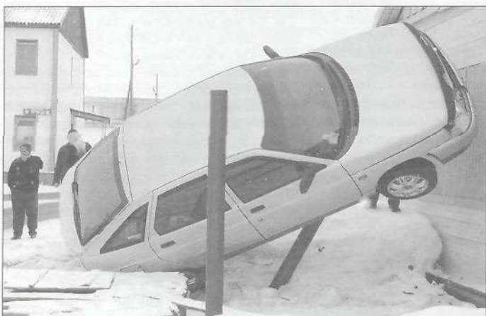
29 апреля 2005 года в 11.55 в г. Тарко-Сале около магазина «Юлишна» на перекрестке водитель «ВАЗ-21120» не учел скоростной режим, не справился с управлением и совершил наезд на металлическое ограждение выгребной ямы. Водитель находился в состоянии алкогольного опьянения.

С участием детей произошло 2 дорожно-транспортных происшествия, в обоих случаях дети не были виновниками сложившейся ситуации. В одном случае ребенок был пассажиром, а в другом - пешеходом, и пьяный водитель сбил девочку прямо на тротуаре, что особенно возмутительно.