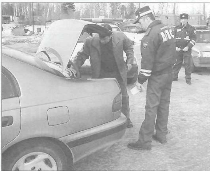
Проверка транспортных средств в ходе операции «Вихрь-Антитеррор»

За время проведения операции отделом ГИБДД ОВД МО Пуровский район осмотрено 6333 единицы автотранспорта, проверено 178 объектов хранения и ремонта транспортных средств, выявлено 2030 административных правонарушений и 13 граждан, нарушивших правила пребывания в РФ, изъят один поддельный документ. Было задействовано 22 маршрута патрулирования и 266 человек личного состава.