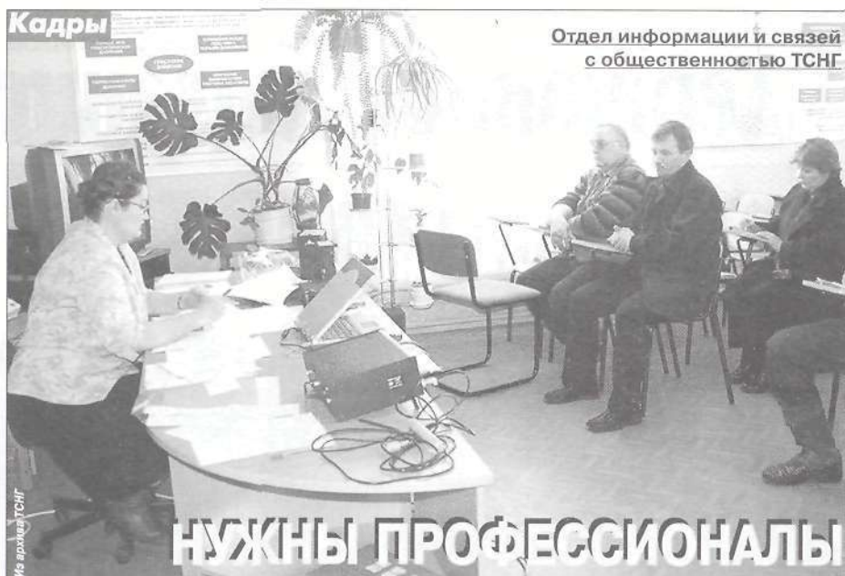
Отдел информации и связей с общественностью ТСНГ