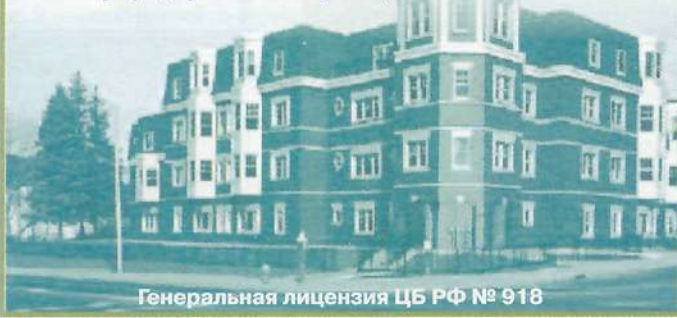
Генеральная лицензия ЦБ РФ № 918

Возможно предоставление ипотечных кредитов на приобретение жилья или доли у предприятий-застройщиков в г. Тюмени.