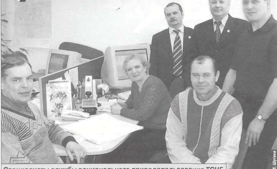
Специалисты службы рационального природопользования ТСНГ