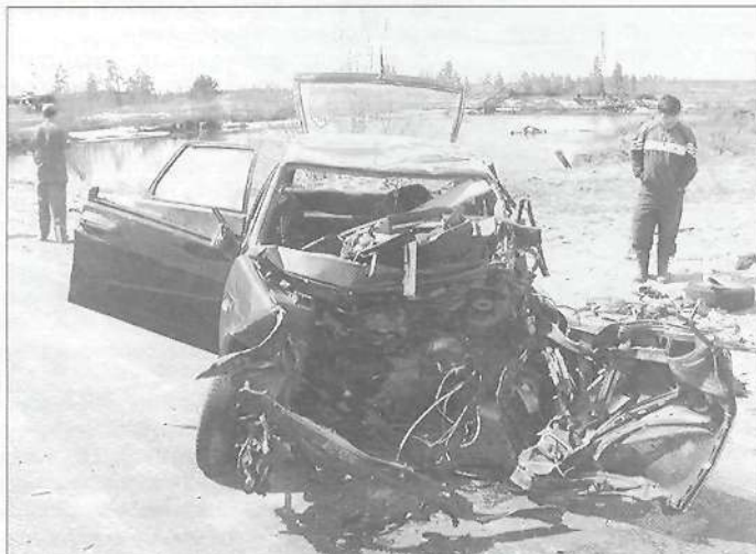
22 мая 2005 года в 9.15 на шестом километре автодороги Тарко-Сале - Пурпе водитель «ВАЗа» выехал на полосу встречного движения и совершил лобовое столкновение с «МАЗом», в результате которого он погиб.

За пять месяцев этого года на автодорогах Пуровского района произошло 30 дорожно-транспортных происшествий, в которых погибли 7 человек, 38 получили травмы различной степени тяжести. На загородных дорогах зарегистрировано 22 дорожно-транспортных происшествия, 6 погибших и 28 человек травмированы. Именно в пурпейской зоне на сегодняшний день сложилась особо сложная обстановка, где зарегистрировано 16 ДТП, 5 - погибших и 17 - раненых.