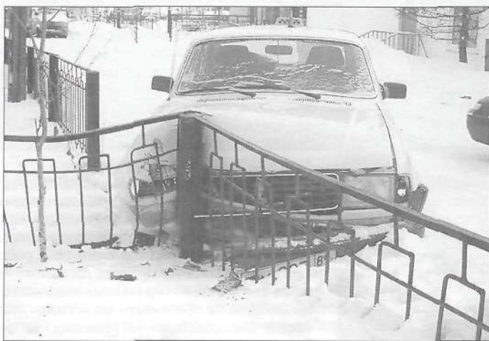
4 марта 2005 года в 14.35 гражданин В., находясь в состоянии алкогольного опьянения, неправомерно завладел автомашиной «ГАЗ-310290», в районе дома № 17 по ул. Ленина не справился с управлением и совершил наезд на 11-летнюю Т. Кутанову

Основными причинами возникновения дорожно-транспортных происшествий являются: нарушение правил дорожного движения водителями, нарушение правил дорожного движения пешеходами, неудовлетворительное состояние улиц и дорог, техническая неисправность автотранспорта. Но нам с вами нужно научиться оставаться живыми и здоровыми в