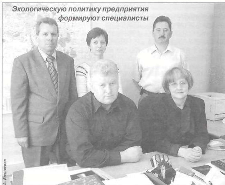
Экологическую политику предприятия формируют специалисты

Д ень охраны окружающей среды - это не только профессиональный праздник экологов, а повод для того, чтобы задуматься о проблемах окружающей нас действительности.