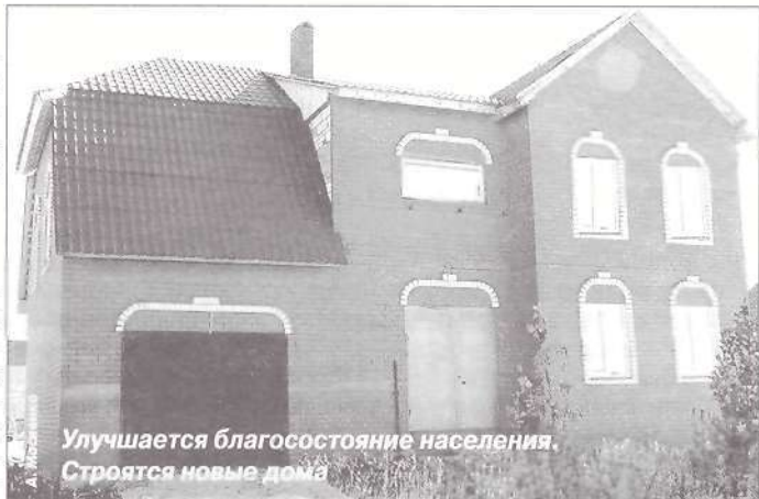
Улучшается благосостояние населения. Строятся новые дома

По предварительной оценке, в июне 2005 года номинальные денежные доходы в среднем на душу населения составили около 22 тысяч рублей, что на 13,4 про-