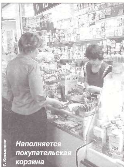
Т. Кельмина Наполняется покупательская корзина

Активизация инвестиционной деятельности способствовала повышению кредитного рейтинга Ямало-Ненецкого автономного округа международным рейтинговым агентством Standart & Poor's 30 июня текущего года. Автономный округ находится на четвертом месте по инвестиционному рейтингу среди остальных субъектов РФ - с кредитным рейтингом ВВ-/Стабильный. Standart & Poor's также повысило рейтинг округа и по его приоритетной необеспеченной задолженности по национальной шкале с «ruA+» до «ruAA».