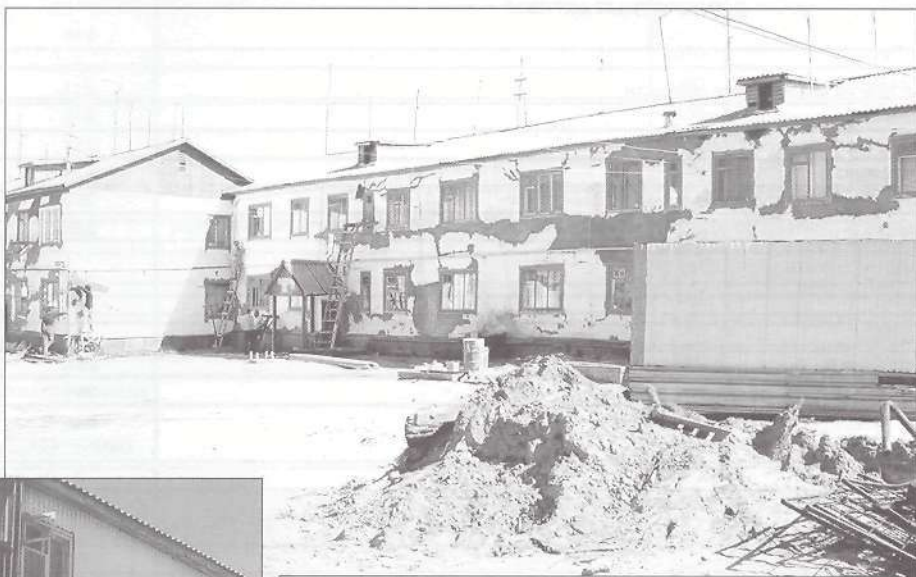
Улица Тарасова в Тарко-Сале скоро преобразится. Дома подготовлены к побелке

Люди должны знать, что они могут быть хозяевами положения. В доме, из числа проживающих почти всегда есть электрик, сантехник, плотник, дворник. Может