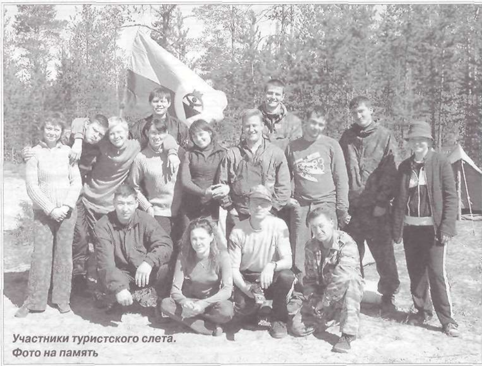
Участники туристского слета. Фото на память