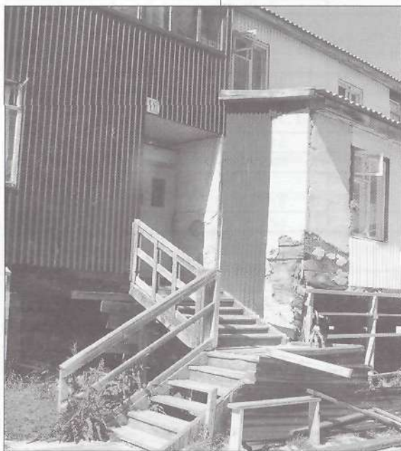
А эти подъезды в Комсомольском микрорайоне ждут ремонта. Капитального

ческое обслуживание жилого фонда возможно и нужно.