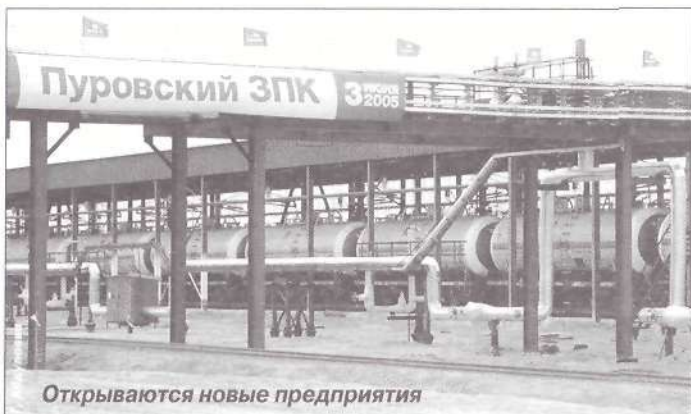
Открываются новые предприятия

По материалам пресс-службы губернатора ЯНАО