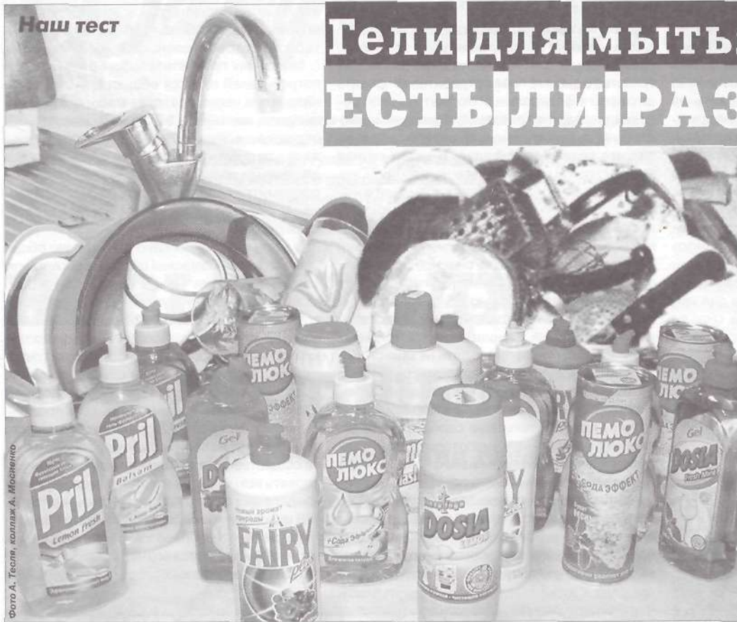
Фото А. Тесля, коллаж А. Мисленко