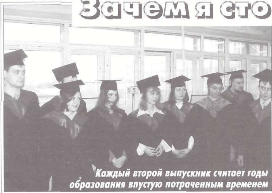
Каждый второй выпускник считает годы образования впустую потраченным временем

Ребенок благополучно сдал экзамены, поступил в институт. Родителям и учителям кажется, что самый важный рубеж взят, судьба молодого человека определена и устроена на много лет вперед. Однако социологические исследования не подтверждают нашего оптимизма. Поступление в институт лишь один из вариантов вступления во взрослую жизнь, к тому же иногда черновой.