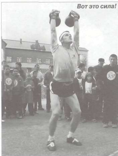
Вот это сила!

На площади перед КСК «Геолог» 12 августа 2005 года в одиннадцать часов утра состоялось торжественное открытие Спартакиады. Перед выстроившимися в