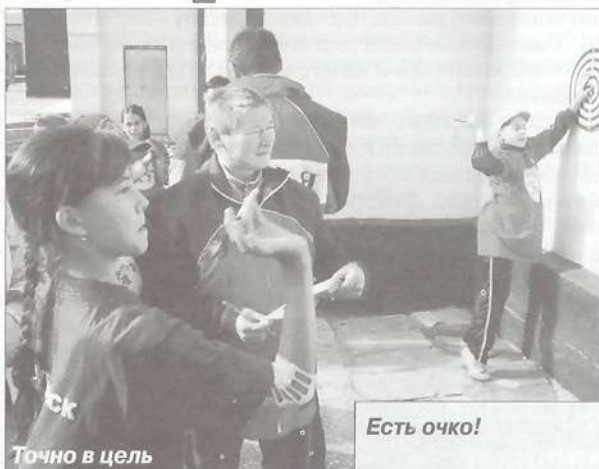
Точно в цель

участие вне конкурса, второй - команда из посёлка Пурпе; третьей - Тарко-Сале-2; четвёртой - п. Пуровск. В пионерболе также первыми стали ребята из села Самбург, вторыми - из п. Пурпе, третьими - из Тарко-Сале-2, четвёртыми - из Пуровска. Настольный теннис: первое место заняла команда из посёлка Пуровска, второе место - за поселком Ханымей, третье - за селом Самбургом, чет-