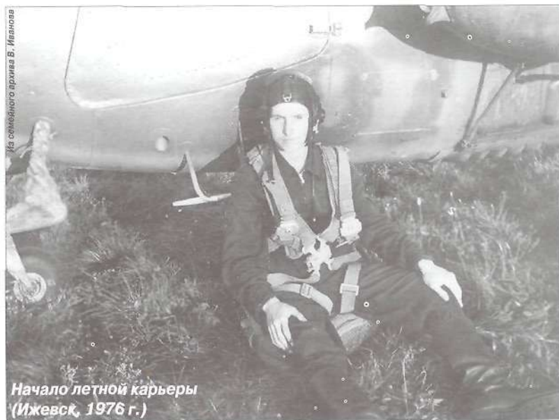
Начало летной карьеры (Ижевск, 1976 г.)

Председатель Государственной думы Ямало-Ненецкого автономного округа С. Н. ХАРЮЧИ