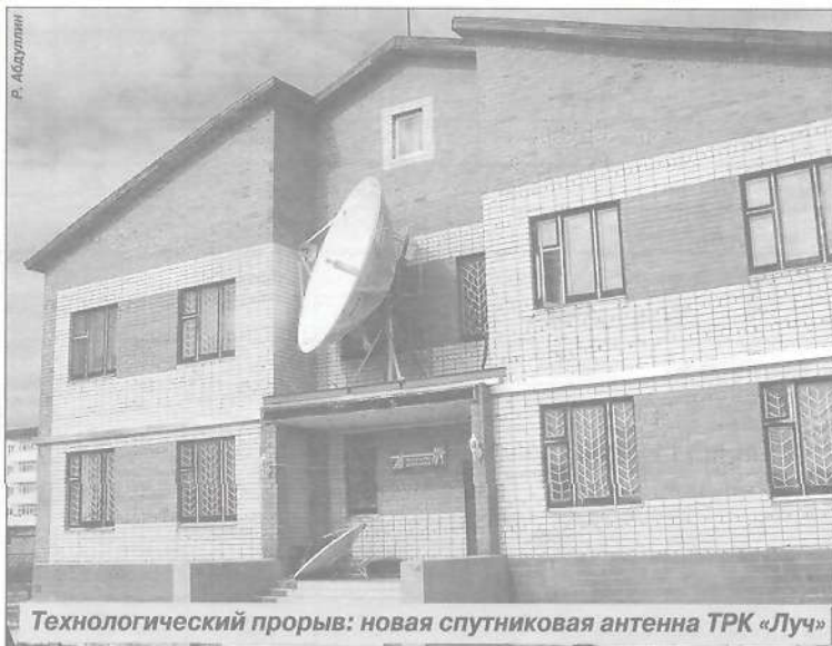
Технологический прорыв: новая спутниковая антенна ТРК «Луч»