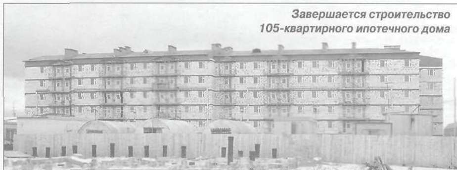
Завершается строительство 105-квартирного ипотечного дома

Меняется к лучшему облик посёлка - как за счёт строительства новых зданий, так и благодаря обновлению фасадов старых домов. Чувство удовлетворения вызывает интенсивно проводимая работа по капитальному ремонту жилищного фонда. За два последних года отремонтировано около 90 жилых домов. При этом в будущем году предстоит отремонтировать ещё порядка 20 домов, чтобы полностью обновить жилищный фонд посёлка. Кроме того, вскоре он должен пополниться вновь построенными по ипотечной системе домами. Причём 15-квартирный дом уже готов к заселению, а строительство 105-квартирного близится к завершению. Новостройки вселяют в уренгойцев чувство уверенности в завтрашнем дне. В настоящее время продолжается строительство ледового катка на 650 мест - подарок прославленным юным уренгойским хоккеистам. За последнее время построен также рентгенкабинет Уренгойской больницы, где в настоящее