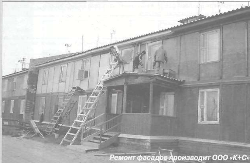
Ремонт фасадов производит ООО «К+С»

Работа у сотрудников отдела ЖКХ администрации хлопотная, требующая большой отдачи, а со старым жилищным фондом - ещё и больших моральных издержек, ведь мы принимаем на себя недовольство населения на этот счёт. Тем более радуется, когда видишь результаты труда. Но останавливаться на достигнутом нельзя. В будущем году при капитальном ремонте домов будут производиться работы не только по их фасадной части, но и по восстановлению вентиляционной и канализационных систем с выводом на крышу. Едва закончится подготовка к предстоящей зиме, как все имеющие к ней отношение службы начнут готовиться к следующей - 2006-2007 годов.