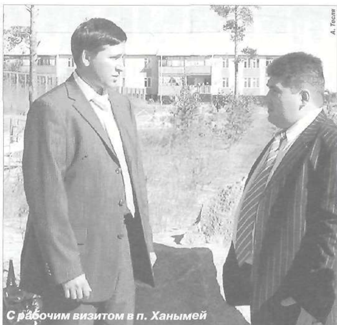
С рабочим визитом в п. Ханымей

– Конечно. К сожалению, в России часто бывает так: пока есть лес – мы будем пилить лес, и никто не думает, что его нужно поса-