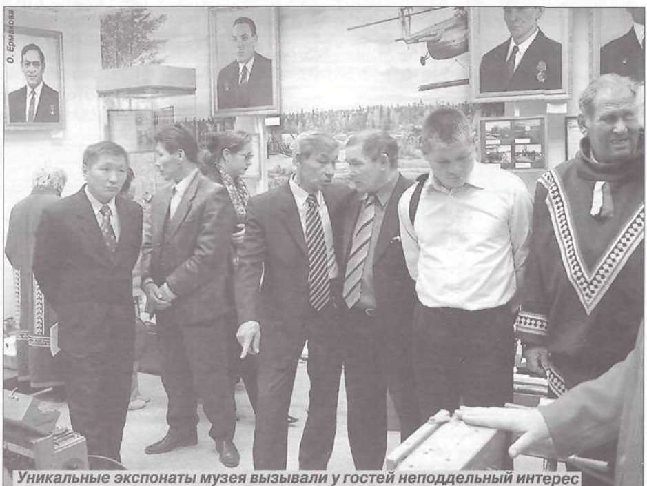
Уникальные экспонаты музея вызвали у гостей неподдельный интерес

О. ЕРМАКОВА при информационной поддержке пресс-службы главы района