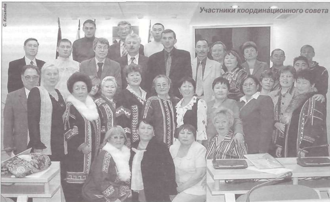
Участники координационного совета