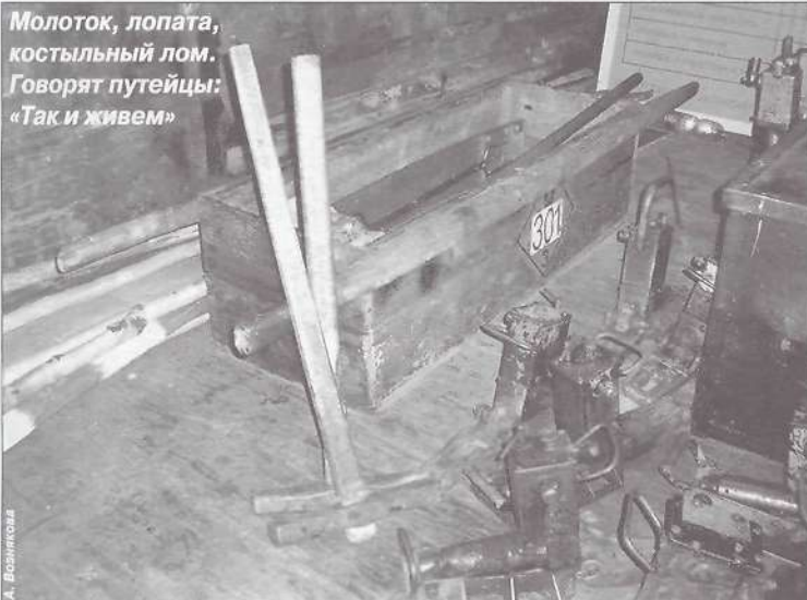
Молоток, лопата, костыльный лом. Говорят путейцы: «Так и живем»

Тогда, может, и будет решена задача построения свободного общества свободных людей, о которой говорил в послании Федеральному собранию РФ президент страны. «Говоря о справедливости, имею в виду ... открытие широких и равных возможностей развития для всех. Успеха - для всех. Лучшей жизни - для всех». «Россия станет процветающей лишь тогда, когда успех каждого человека станет зависеть не только от уровня его благосостояния, но и от его порядочности и культуры».