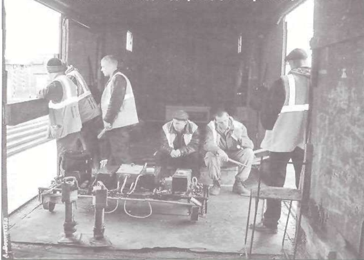
Рабочий вагон: две дырищи, ветер свищет

До банальности простая история. В любом коллективе ежедневно решается масса подобных вопросов. Только решается по-разному. Там, где научились уважать людей независимо от их карьерных высот, где личность любого члена коллектива ценится, а достоинство не попирается, там и цели общие, и пути решения быстро находят, и ущемленных и обиженных нет. Где интересы разграничены и лежат в разных плоскостях понимания, не может быть продуктивного слаженного труда. Обречен такой коллектив обрастать мелочными дрязгами и недовольством. И будет так - рабочие, возмущенные отношением мастеров к себе, мастера, равнодушно игнорирующие желания бригады, выжимающие из них последние соки. В одном случае полное отсутствие понятия команды, общего понимания цели. В