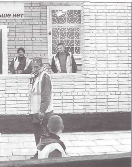
Лимбей. Глаз радуется, а душа болит - базы больше нет

Не сидели, не ждали бы, а работали, а то и положенных восьми часов не отработывают». Опять же, кто этот процесс отслеживать должен? Вины рабочих в том, что у них