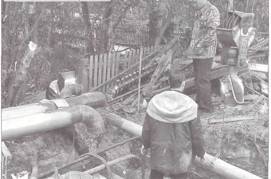
Подведение теплосетей к новой котельной в Тарко-Сале

Кроме того, мы плотно работаем с надзорными органами: с Пожнадзором, Энергонадзором и так далее. Надо признаться, что мы немного не успеваем выполнять все их предписания. Здесь надо понимать, что