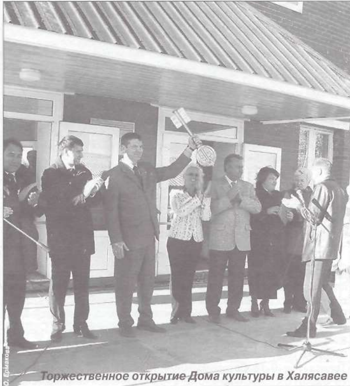
Торжественное открытие Дома культуры в Халясавее

Обучающий семинар стартовал утром. В течение всего дня присутствовавшие рассматривали основные направления дальнейшей деятельности ассоциации, заслушивали доклады и сообщения председателей городских и районных отделений. В частности, специалисты Пуровского отделения рассказали, как складывается сотрудничество с нефтегазовым комплексом. Кроме того, были рассмотрены вопросы делопроизводства и финансово-хозяйственной деятельности отделений. В ходе работы семинара особое внимание присутствовавших было обращено на механизмы поиска средств для существования общественных организаций. Как вариант была рассмотрена возможность получения грантов.