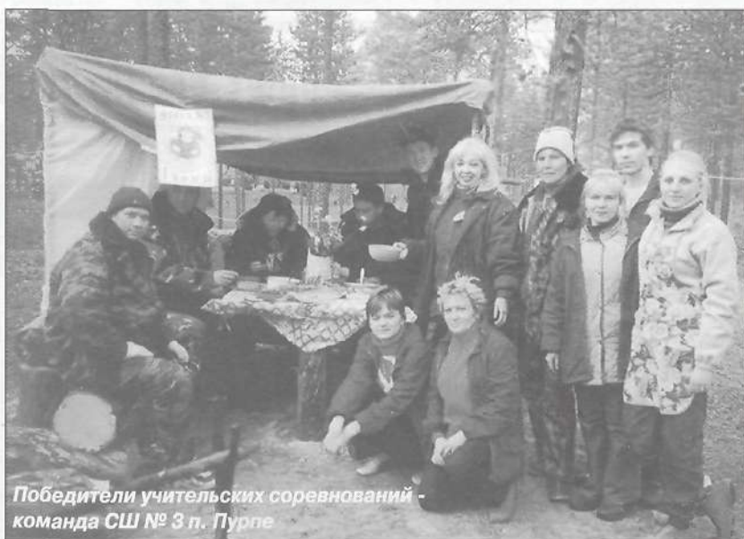
Победители учительских соревнований - команда СШ № 3 п. Пурпе