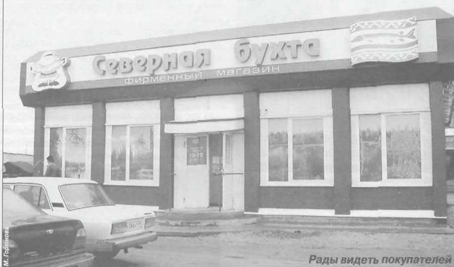
Рады видеть покупателей

Общинами района в 2004 году было добыто 170 тонн рыбы, в 2005 году ожидается добыть 260 тонн, план добычи на 2006 год составляет 375 тонн. Нарастивает объемы