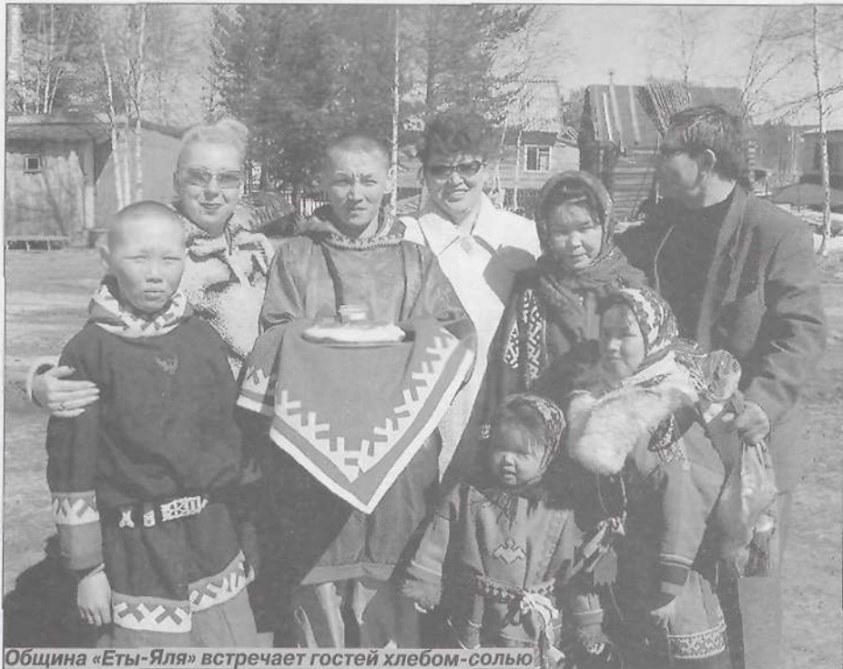
Община «Еты-Яля» встречает гостей хлебом-солью

Параллельно велась работа по разработке торговой марки. С помощью московского агентства было разработано название для продукции. Теперь продукция носит самостоятельное имя, не совпадающее с названием предприятия. Также был разрабо-