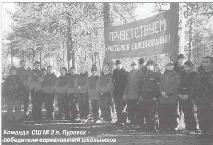
Команда СШ № 2 п. Пуровск - победители соревнований школьников

По итогам соревнований в общем зачете места распределены следующим образом: первое место заня-