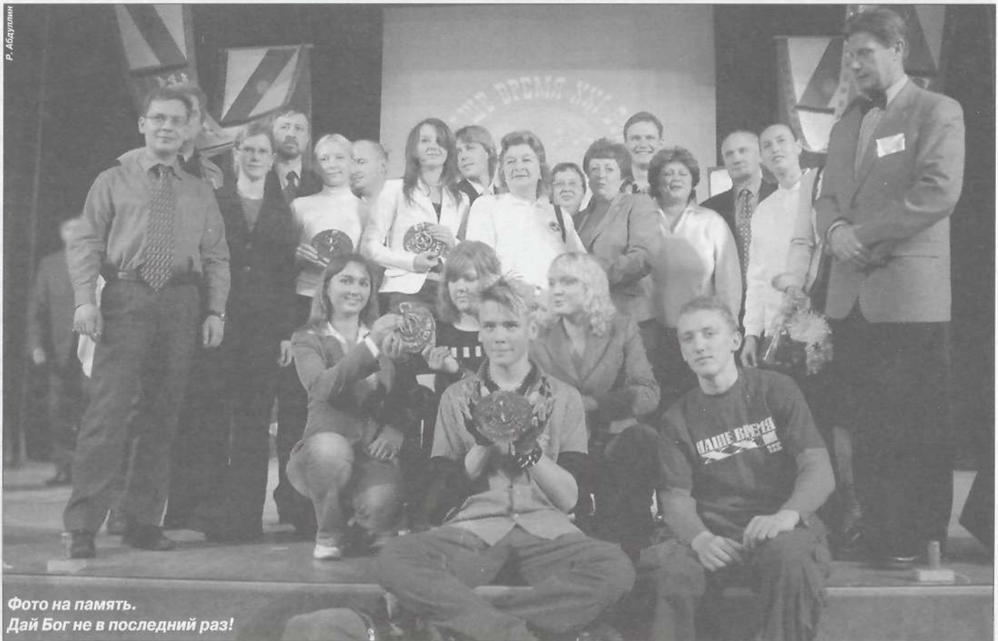
Фото на память. Дай Бог не в последний раз!