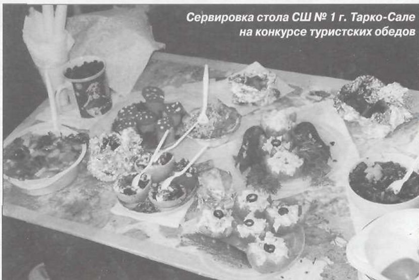
Сервировка стола СШ № 1 г. Тарко-Сале на конкурсе туристских обедов