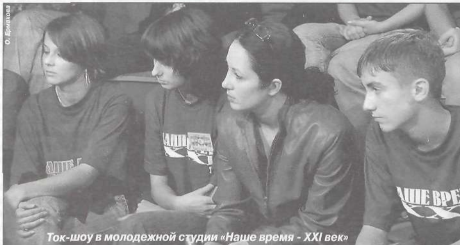
Ток-шоу в молодежной студии «Наше время - XXI век»