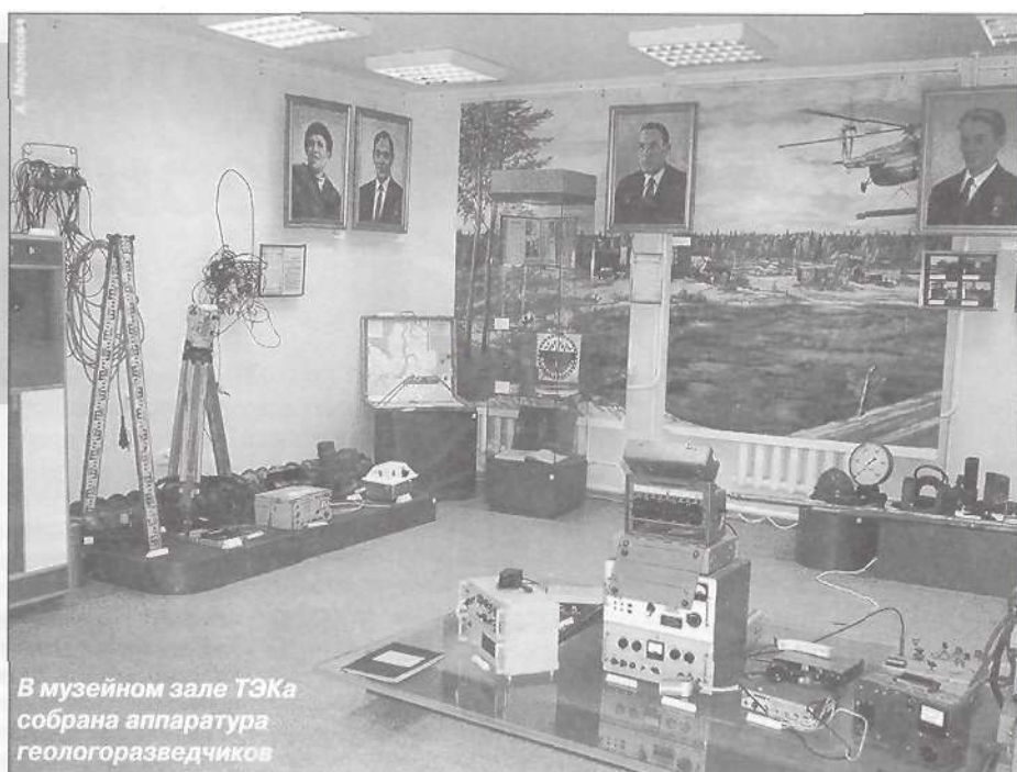
В музейном зале ТЭКа собрана аппаратура геологоразведчиков