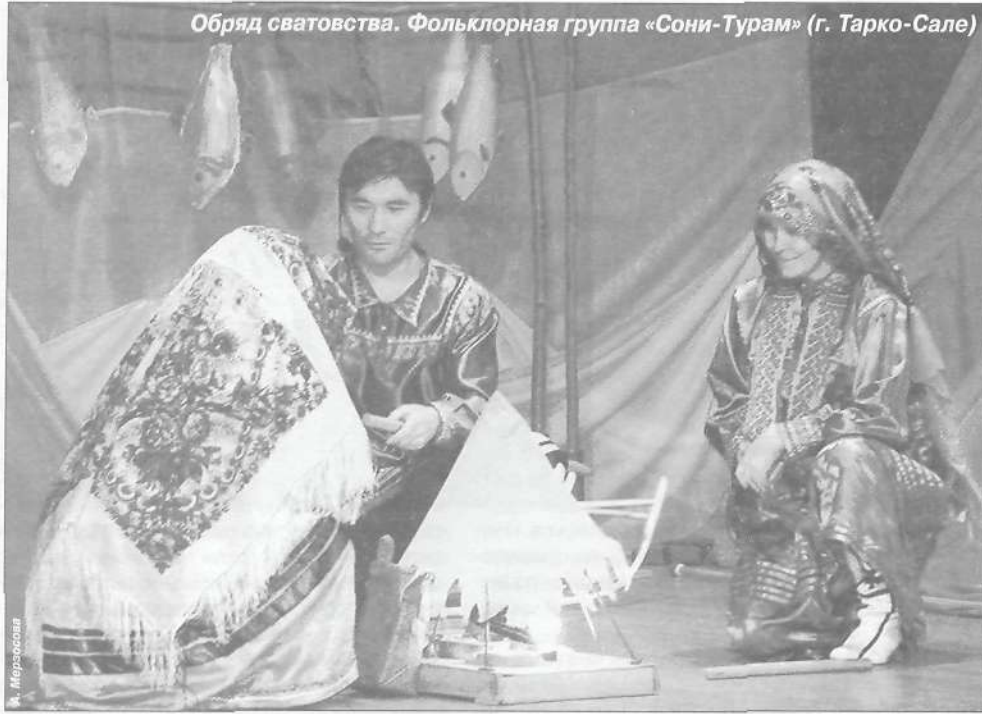
Обряд сватовства. Фольклорная группа «Сони-Турам» (г. Тарко-Сале)