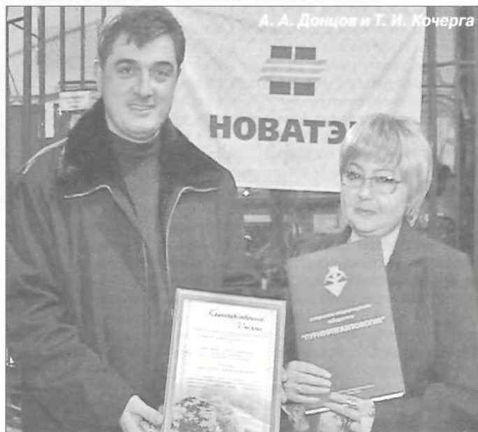
Подготовлено по материалам, предоставленным пресс-службами компаний

Третье декабря отмечен в календаре как Международный день инвалидов. В жизни этих людей есть моменты, когда нужно бросить вызов судьбе, собрать воедино волю и крепость духа, терпение и упорство - выстоять и победить. Несмотря на боль и невзгоды, преодолевая преграды и трудности, они не перестают радоваться жизни и побеждать судьбу. Коллектив ОАО «Пурнефтегазгеология» от всей души желает им здоровья, улыбок, добра и удачи!