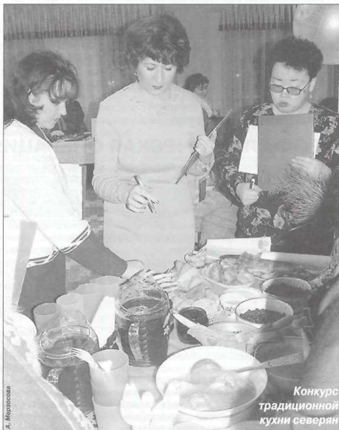
Конкурс традиционной кухни северян