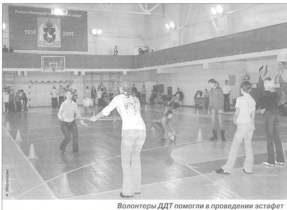
Волонтеры ДДТ помогли в проведении эстафет