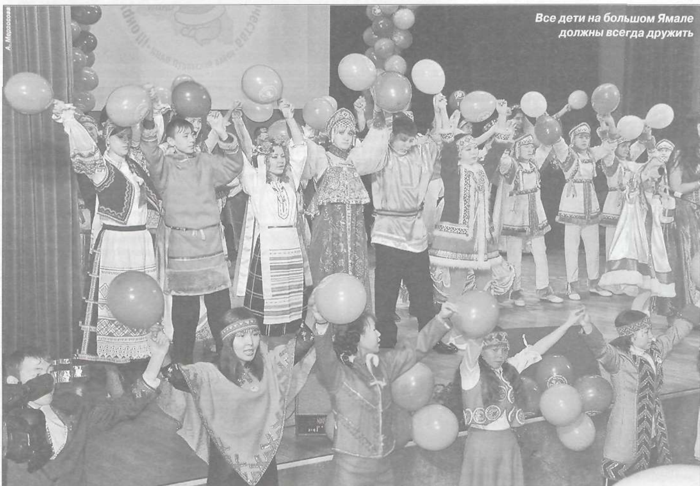
Все дети на большом Ямале должны всегда дружить

Национальный обряд - традиционный и самый сложный кон-