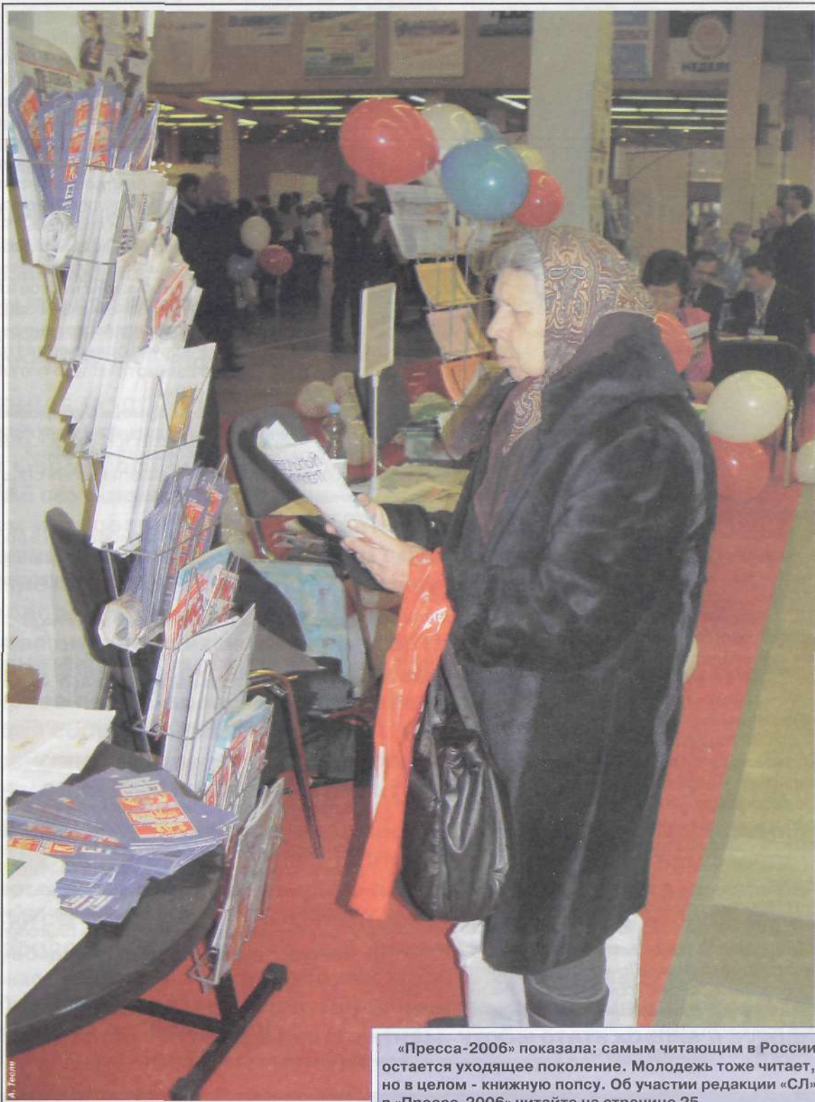
«Пресса-2006» показала: самым читающим в России остается уходящее поколение. Молодежь тоже читает, но в целом - книжную попку. Об участии редакции «СЛ» в «Прессе-2006» читайте на странице 25