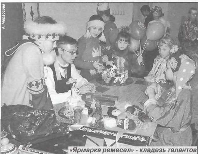
«Ярмарка ремесел» - кладезь талантов

В своем выступлении они достоверно передали колорит украинской жизни. Порой, глядя на выступление этого коллектива, казалось, что празднование Рождества происходит не на сцене концертного зала, а в маленькой хатке, где за ужином собралась большая украинская семья. Надо отметить, что пурпейцы продумали все до мелочей: и костюмы, и прекрасные декорации, и истинно украинский говор. Не уронили они планку и в других конкурсах, поэтому присуждение Пурпейской средней школе № 2 Гран-при фестиваля было заслуженным и никого не удивило. Ханымейские ребята тоже молодцы. Они порадовали уровнем подготовки, танцевальными композициями и вкусными варениками, но члены жюри посчитали нужным отметить вокальное мастерство этого коллектива и присудили победу в номинации «За многоголосное исполнение обрядовой песни».