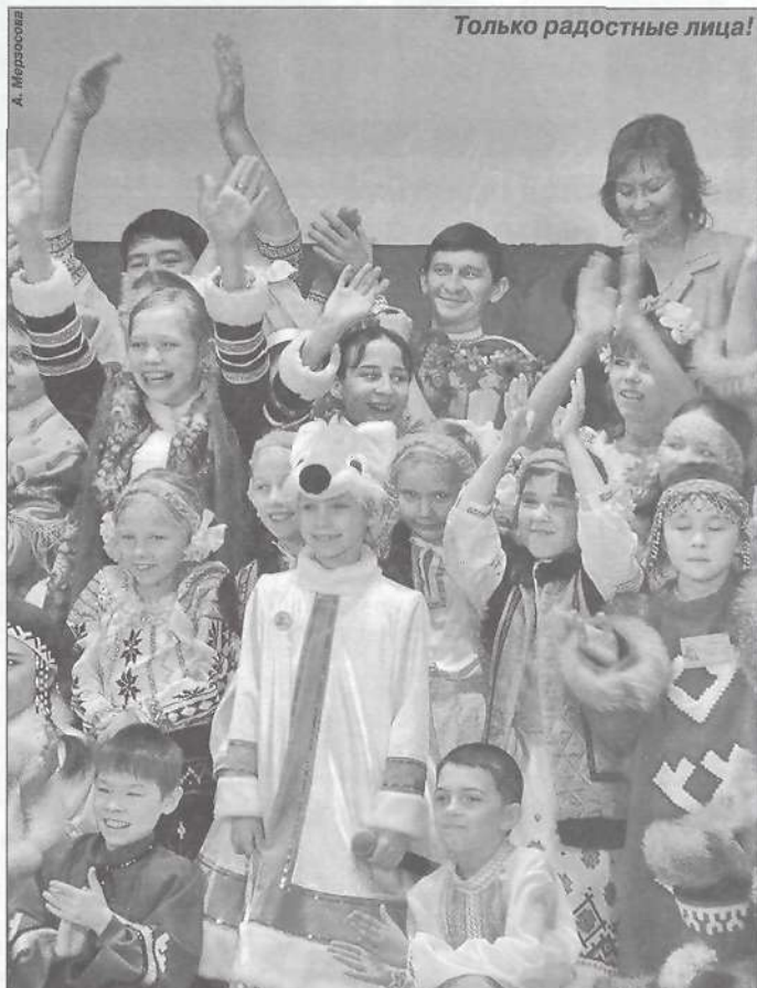
Только радостные лица!