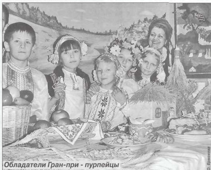
Обладатели Гран-при - пурпейцы

А самое большое количество наград было присуждено членам жюри в последнем конкурсе - народной игры. Обе наши творческие делегации были удостоены дипломов второй степени, но постарались все команды-участницы. Таких замечательных игровых дворов не помнят организаторы фестиваля за все десять лет его проведения.