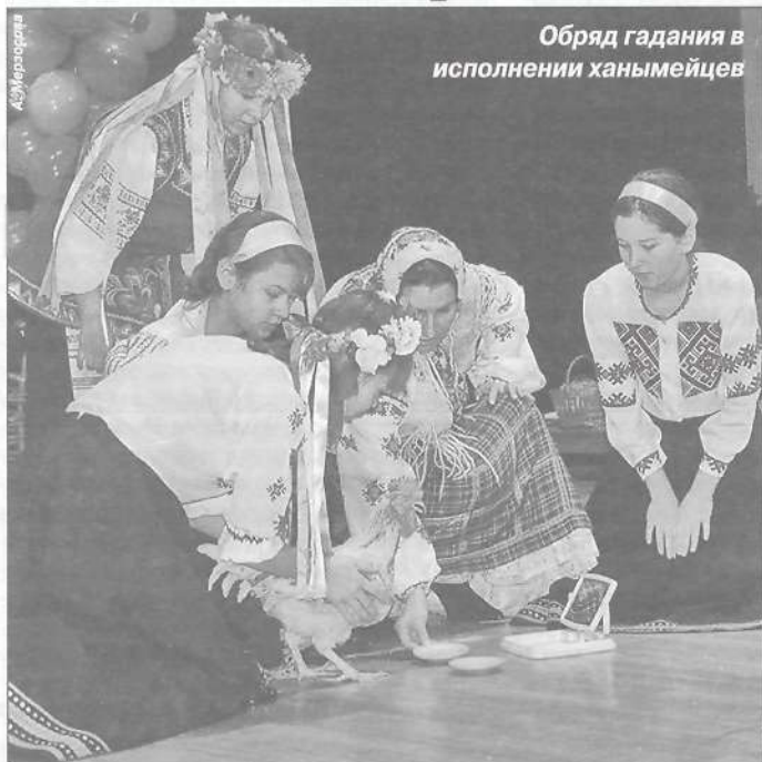
Обряд гадания в исполнении ханymeйцев

Могли ли предположить организаторы детского фестиваля народного творчества «Все краски Ямала», каким станет это мероприятие через десять лет своего существования. Небольшой районный конкурс, зародившийся в Пуровском доме детского творчества, перерос в грандиозный, уникальный фестиваль, собравший в третий раз на пуровской земле фольклорные коллективы со всех уголков Ямала. Сто участников, масса конкурсов и игр, глубокое погружение в культуру и быт разных народов, а еще улыбки, смех и радостные лица детворы - ведь именно для них - ямальских мальчишек и девчонок - все это и было создано при участии и поддержке департаментов образования округа и района и Таркосалинского дома детского творчества.